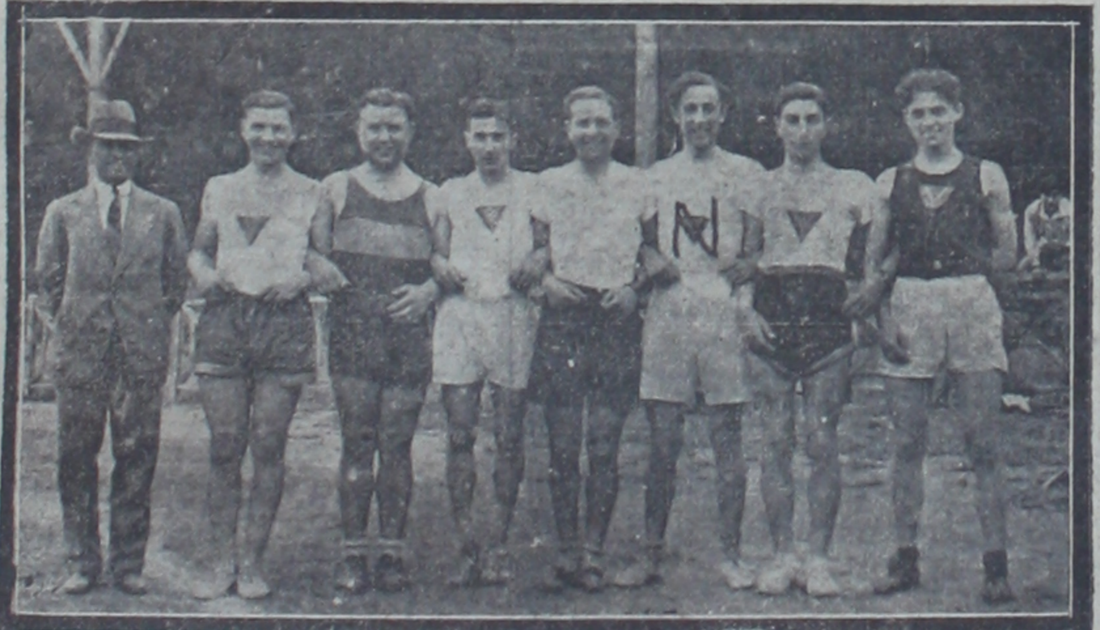
Dünkü müsabakalarda birinci gelen Galatasaray Lisesi atletleri bir arada

Dün Taksim Stadyumunda Galatasaray lisesi atletleri arasında ilk defa olarak senelik atletik müsabakaları yapılmıştır. Bu müsabakalar, şimdiye kadar memleketimizde yapılan her hangi bir atletik müsabaka ile kıyas kabul etmeyecek derecede mükemmel ve güzel olmuştur.