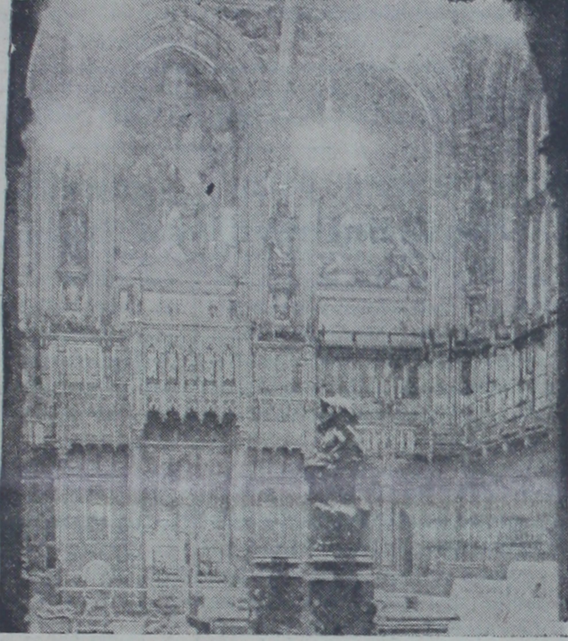
Paris teklifleri hakkında gürültülü konuşmalara sahne olan İngiliz avam kamarasının bir görünüşü.

Londra, 17 (A. A.) — İngiltere hükümeti, Cenevre'de zecri tedbirlerin tatbikiyle İngiltere için tehlikeli bir askeri durum hasıl olduğunu, halbuki bu tehlikeli durumun başka devletlerle müşterek olmak lazım geleceğini ileri süreceği ve B. Eden'in Milletler Cemiyeti azalarından bu tehlikelere katılmak için ne gibi askeri ve bahri tedbirler almak düşüncesinin hemen tasrihini isteyeceği söylenmekte idi.