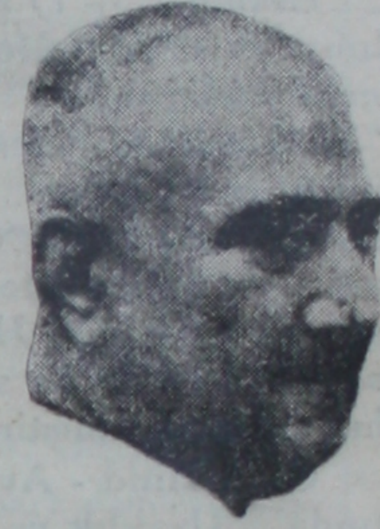
Dün inkılâp dersini veren B. R. Peker

Dün Ankara Halkevinde C.H. P. Umum Sökreteri B. Recep Peker bu ders yılı devresinin ikinci dersini, büyük salonu dolduran seçkin bir dinleyici kalabalığının önünde vermiştir.