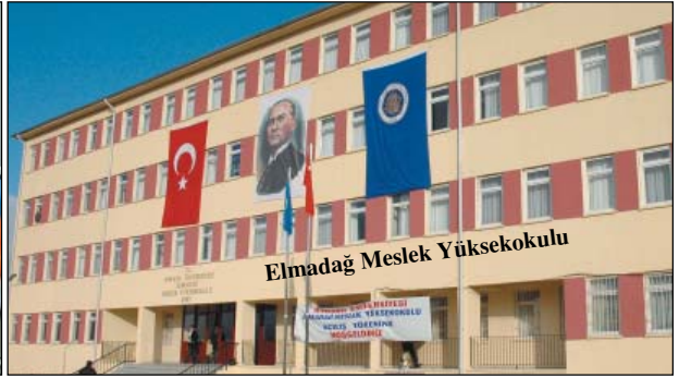
Elmadağ Meslek Yüksekokulu