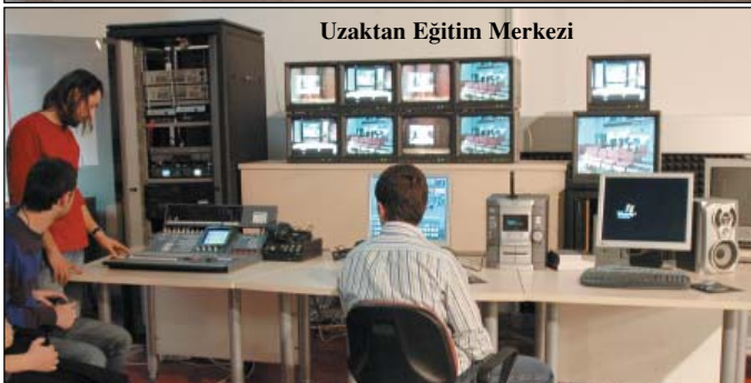
Uzaktan Eğitim Merkezi