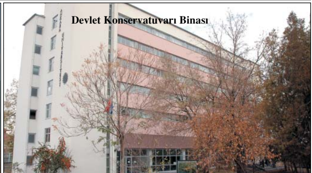
Devlet Konservatuvarı Binası