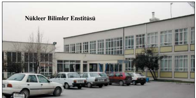
Nükleer Bilimler Enstitüsü