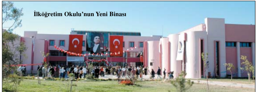
İlköğretim Okulu'nun Yeni Binası