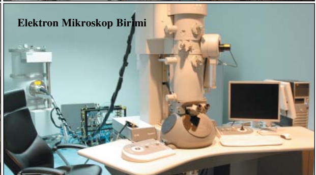
Elektron Mikroskop Birimi