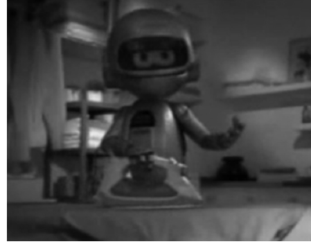
Resim 8: Çelik ve ütü