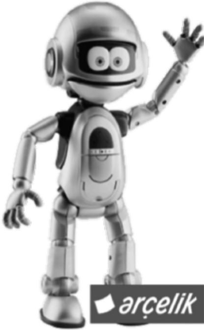
Resim 1: Çelik