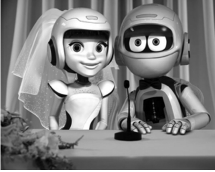
Resim 3: Çelik ve Çeliknaz'ın düğünü