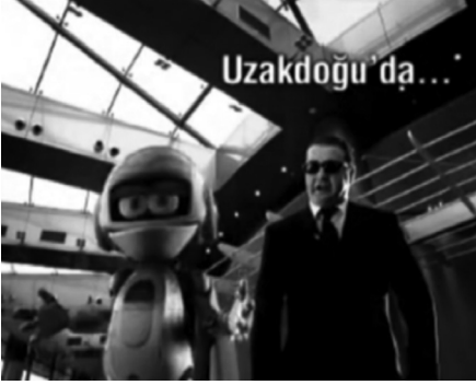
Resim 7: Çelik Uzakdoğu'da