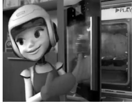
Resim 6: Çelikle ve fırın