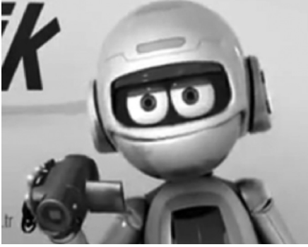
Resim 5: Çelik ve kamera