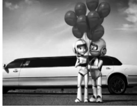
Resim 4: Çelik ve Çeliknaz'ın balayı