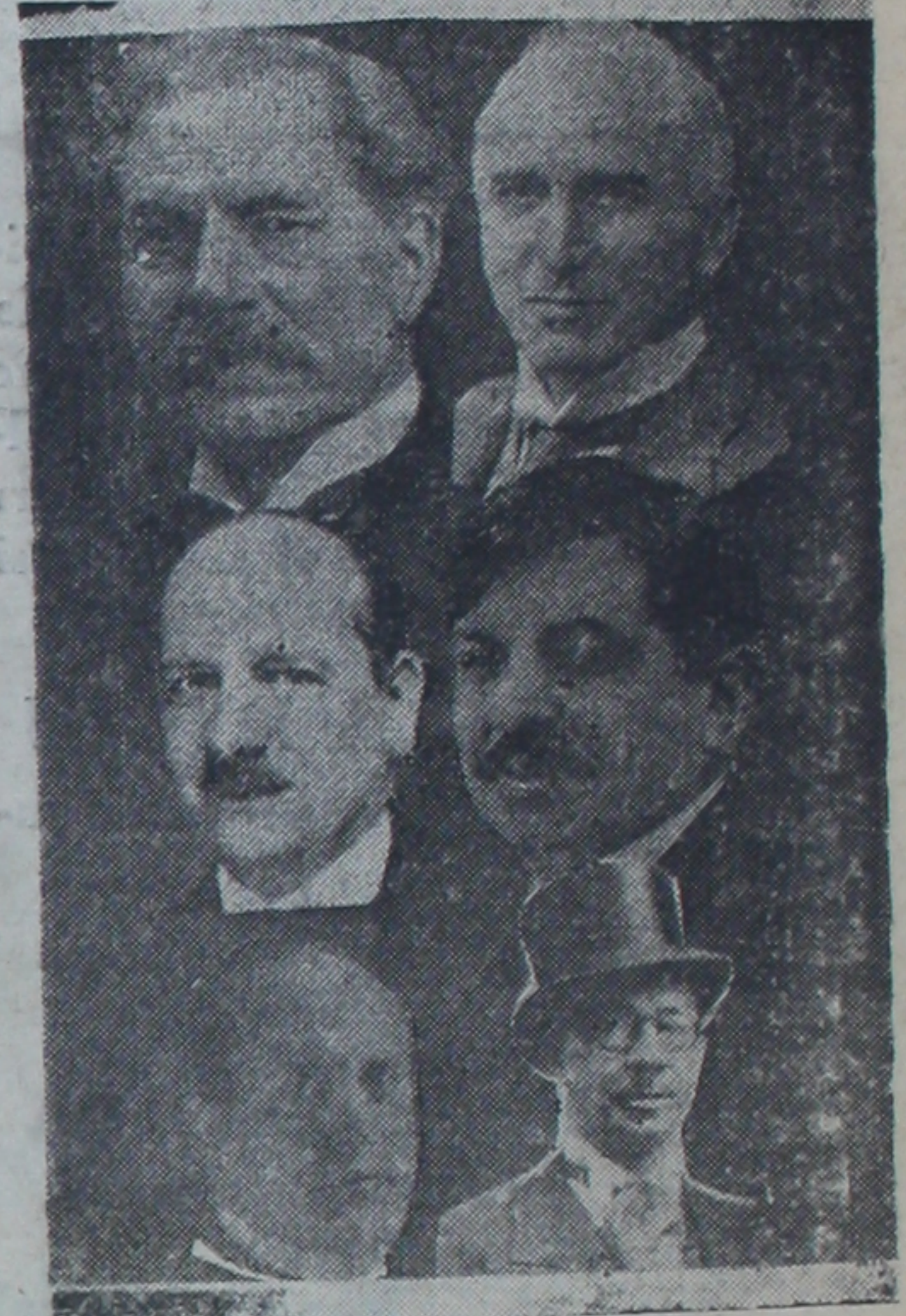
Bugün Stresa'da buluşacak olan İngiliz, Fransız ve İtalyan başbakanlarıyla dışişler bakanları

Roma, 10 (A.A.) — Gazette de Popolo Stresa konferansının yalnız bir (Sonu 4 üncü sayıfada)