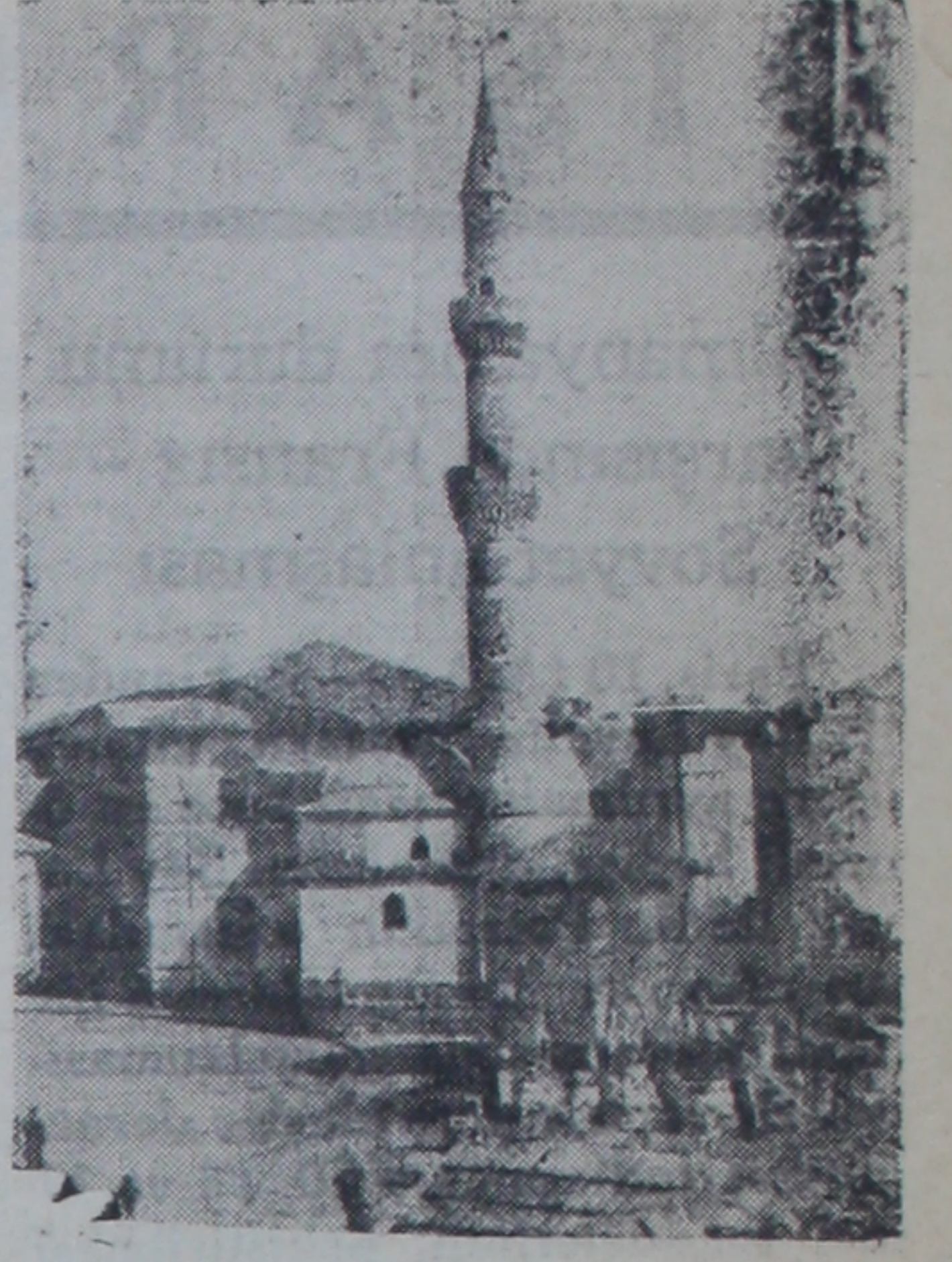
Hacıbayram camisinin genel görünüşü

mıştır. Bundan başka uzun, kısa, köşeli, müdevver, sırça tuğlalarla süslenmiş tuğlalı minareli Ankara camilerinin hepsi değerli türk izerleridir. Buralardaki mihrabların üzerine sonradan badana ile arabesk süsler yapılmıştır. Arslanhane camisinin mihrabı sonradan temizlenmiştir.