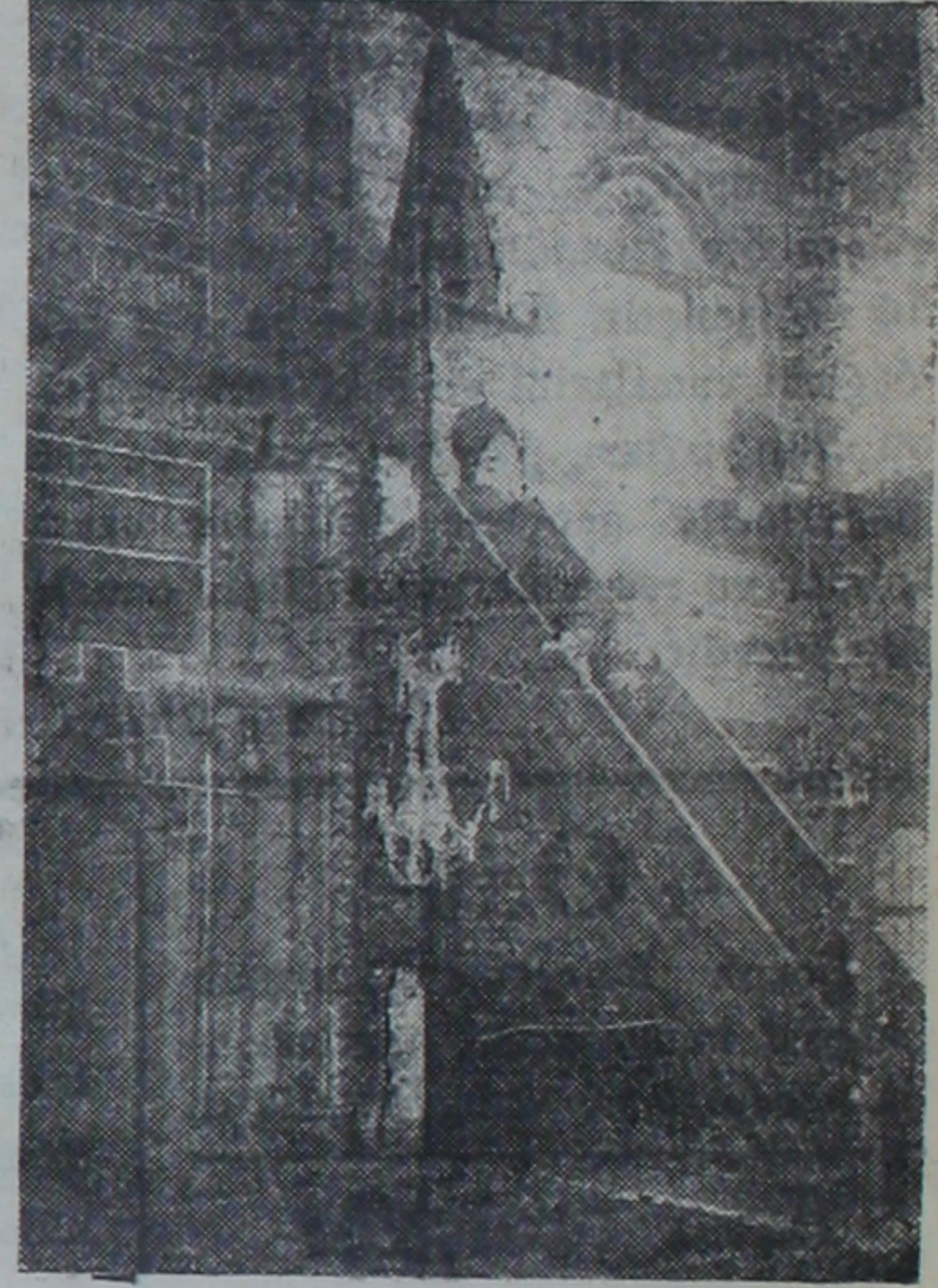
Hacıbayram camisinde mihrab ve minber

Nakış itibarile lâle ve karanfillerle süslü Hacıbayram, Zincirli, Ağaçayak