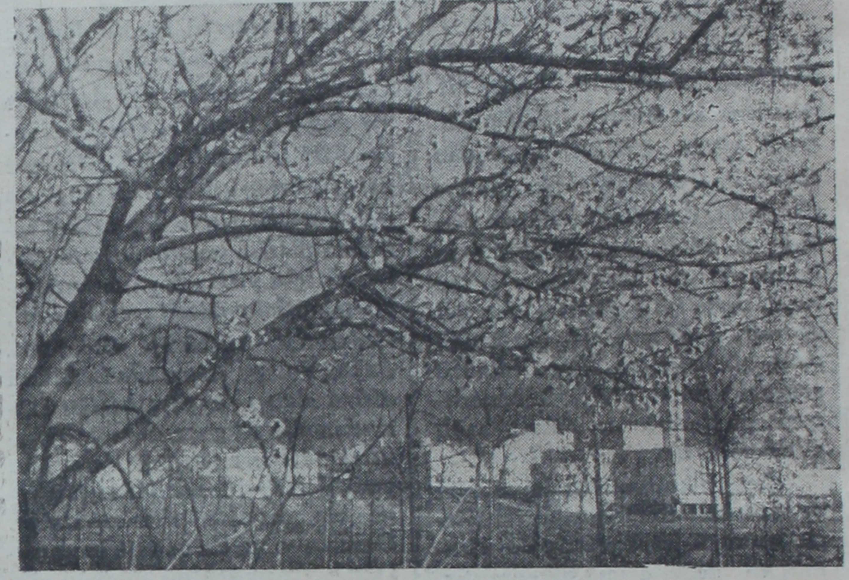
Kıştan artık kurtulduk, diyebiliriz Ankarada, hemen her yerde ağaçlar çiçeklendi. Yukarıki fotoğraf tabiatın bu en güzel mevsim başlangıcını gösteriyor