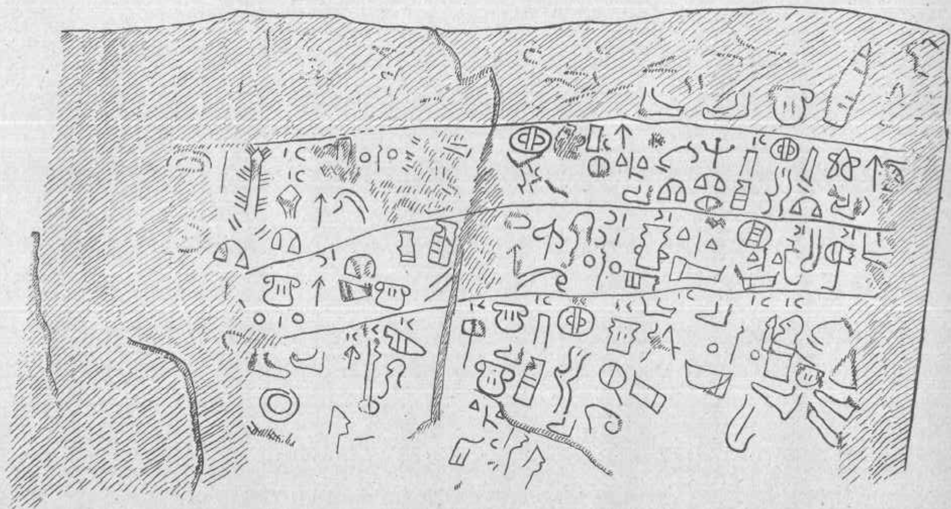
Şırası kitabesi — Inscription of Şırası