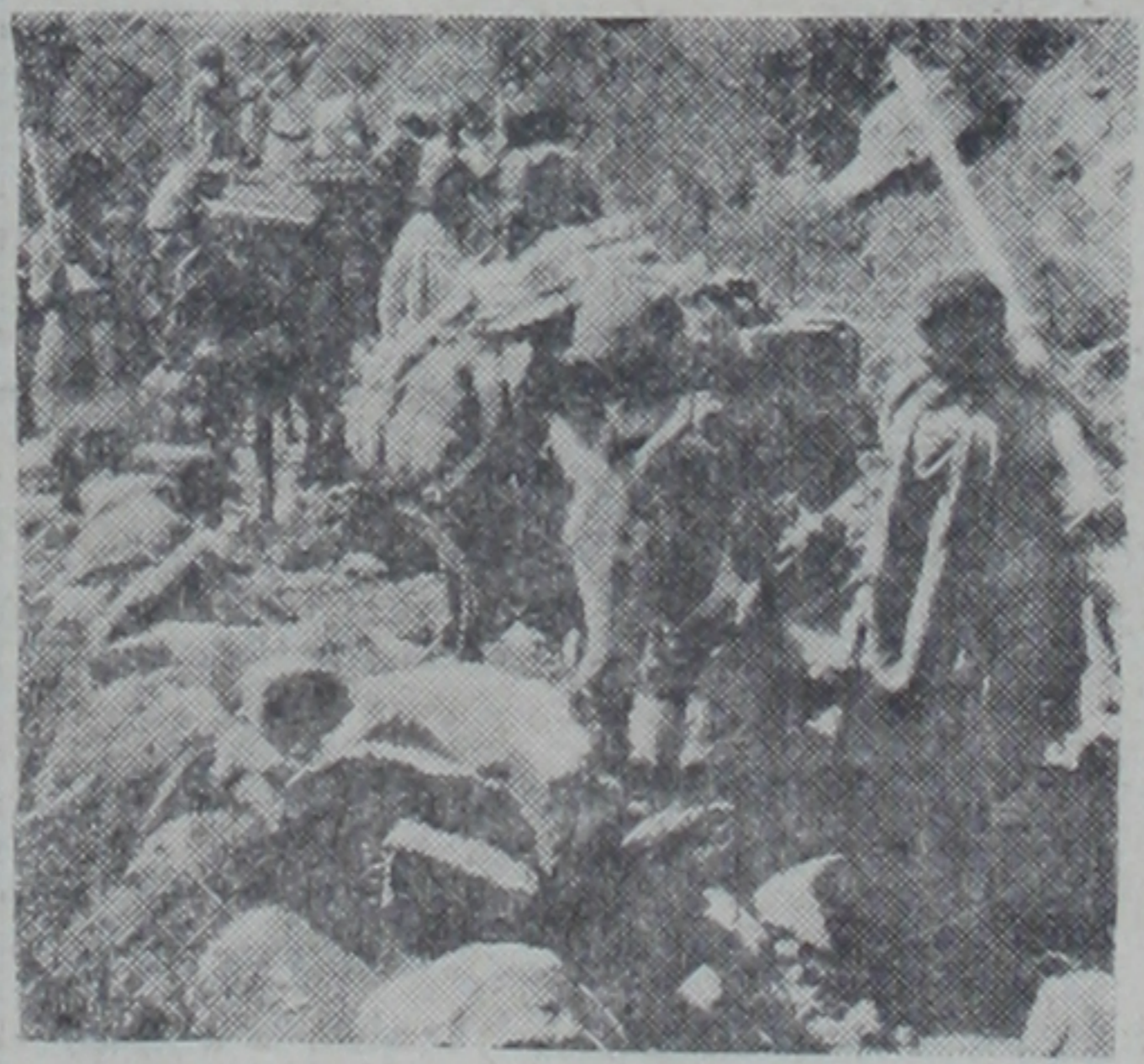
Habesler dağlarda cephane taşıyorlar

Harrar genel ilbayı Nasibu, Ciciğa civarındaki büyük ordunun