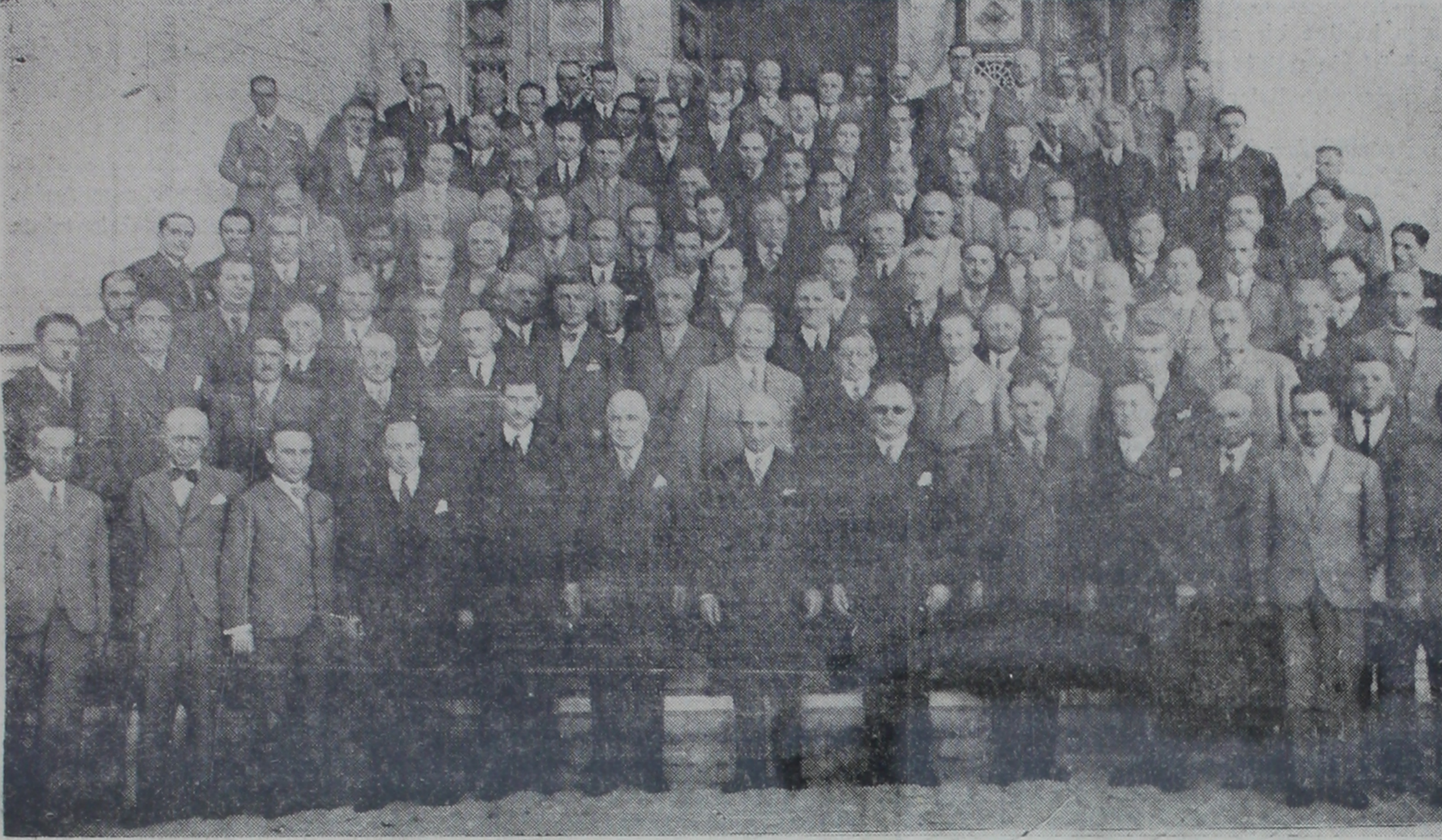
Kamutay Başkanı, Başbakanımız ve Bakanlar Uraylar Kurultayı üyeleriyle bir arada.

"Düzgün işleyen her belediye, memleketimizin ilerlemesi ve yükselmesi için mühim bir mekanizmadır," — İsmet İnönü