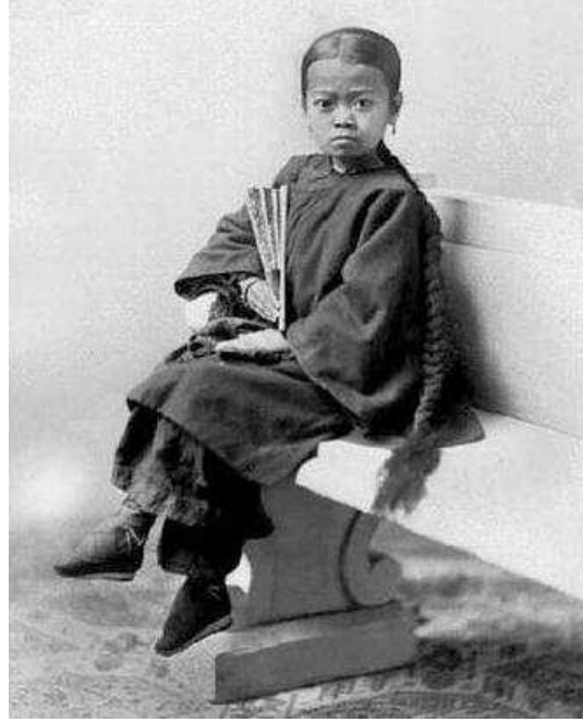
Ayakları bađlanmış k¼¼k bir inli kız çocuđu

Kaynana, gelin olarak almak istediđi kızın eteđini kaldırıp ayaklarını kontrol eder; eđer kızın ayađı bađlı deđilse, ođlunun bir daha o kızla konuřmasına dahi izin vermezdi. 65