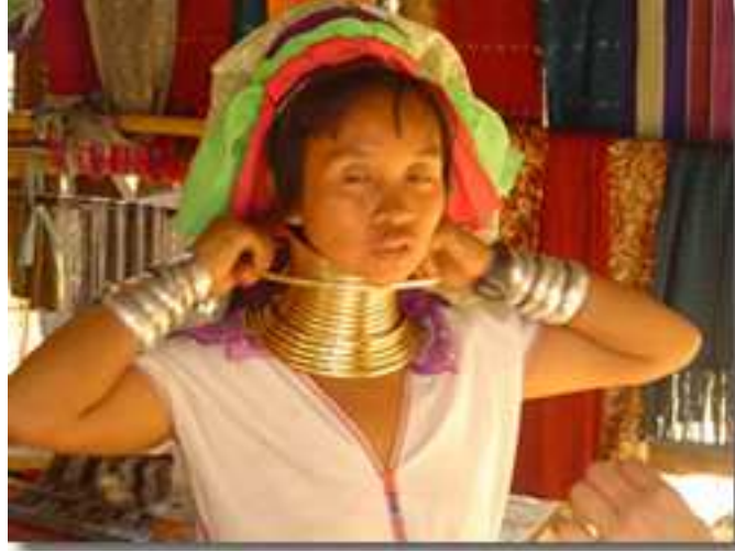
Tayland' da güzellik uğruna katlanılan eziyet

Bazı toplumlarda ise, güzelliğe ulaşmanın yolu, vücudun çeşitli yerlerini deldirmek ve dövmeleler yaptırmaktır. Bu, korseler kadar ciddi sonuçlara yol açmasa da, güzellik uğruna yapılan uygulamalar kategorisinde yer alıyordu. 53