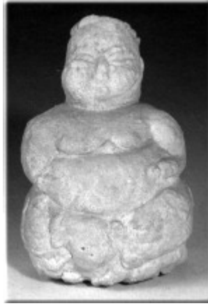
Kalkolitik Çağ' a ait bir kadın heykeli

Kadının doğurganlığı, sütünün gelmesi, ayın hareketlerine uygun biçimde adet görmesi, erkek için daima gizemli ve ilgi çekici olmuştur. Bu nedenle törenlerde, tüm katılımcılar, kadını sembolize eden aksesuarlar takmış ve giysiler giymişlerdir.