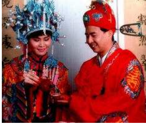
Gelin ve damat

Tüm bu etkinlikler bittiğinde, çift birlikte içki içer ve birbirlerinin şerefine kadeh kaldırırlardı. Çöpçatanları yeni evli çifte, tatlı ve meyve ikramında bulunduktan sonra, bol çocuklu, uzun bir ömür diler ve onları baş başa bırakırdı. 104