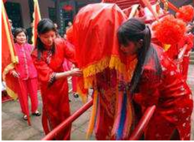
Gelinin Düğün Evine Getirilişi

Düğün alayı, damadın evine ulaştığında, gelinin geldiğini müjdelemek için yeniden havai fişekler atılırdı. Bütün ev halkı gelini karşılamak için beklerdi. Ateşin gelini kötü etkilerden koruduğuna inanıldığından, gelin yakılan bir ateşin üzerinden atlatılırdı. Damat, gelini, ancak tüm bu ritüeller tamamlandığında, duvağını kaldırıp görebilirdi. Ardından, gelinle damat, atalarının ve aile büyüklerinin önünde saygıyla eğilirlerdi. Aile büyükleri ise, gelin ve damada iyi dileklerini sunarlar, kırmızı paketlere sarılmış değerli hediyeler verirlerdi.