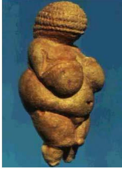
Paleolitik Çağ' a ait bir kadın heykeli

Kadının bereket kavramıyla özdeşleştirilmesi, onun doğurgan bir canlı olmasından kaynaklanmaktadır. İnsan soyunun devamı, avların başarılı olması ve toplanan besinin hepsine yetebilmesi için “bereket” son derece önemlidir.