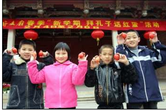
Ellerinde kırmızı boyalı yumurtalar tutan Çinli çocuklar

Çin geleneklerine göre, bebeğin ailesi, doğumdan sonra, bebeği görmeye gelen akrabalara ve arkadaşlara, çeşitli hediyeler sunardı. Hediyelerin çeşitleri, bölgeden bölgeye farklılık gösterse de, hem şehirlerde hem de kasabalarda uygulanan ortak gelenek, kırmızı boyalı yumurta geleneği idi. 38 Yumurtanın hediye olarak seçilmesinin sebebi, yuvarlak biçimi ile mutlu ve uyumlu bir hayatı sembolize etmesiydi. Yumurtaların kırmızı renge boyanmasının sebebi ise, kırmızı rengin, Çin kültüründe, mutluluğu sembolize etmesiydi.