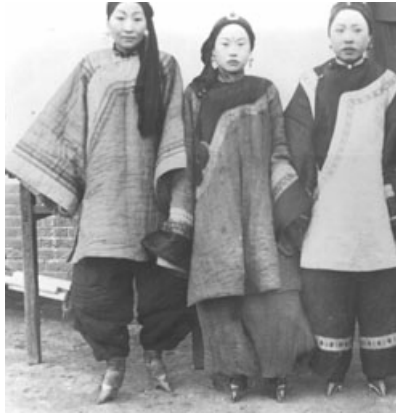
Geleneksel Çin’ de güzelliğin simgesi küçük ayaklar

Güzellik uğruna yapılan en acı verici ve zararlı uygulama, şüphesiz, 10. yüzyılın ortalarında Çin’ de uygulanmaya başlanan “Ayak Bağlama Geleneği” dir. Ayağın gelişimini durdurmaya amaçlayan bu uygulamaya, Çinli kadınlar, yaklaşık bin yıl boyunca maruz kalmışlardır. 55