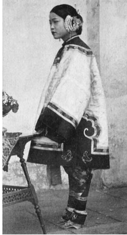
Ayağı bağlı Çinli bir genç kız

düşünüldü. Oysa ki, çürümüş ve deforme olmuş ayakların bu biçimde nitelendirilmesi tamamen bir yanlış anlaşılımdı. Erkekler, kadınların ayaklarını hiçbir zaman göremezlerdi. Çünkü, bir kadın için, ayaklarının çıplak halde görülmesi son derece utanç verici ve rahatsız ediciydi. Kadın, kötü koku yayan, çürümüş ayaklarını, kimselerin görmesini istemez ve onları, küçük lotus ayakkabılarının içine saklardı. 67