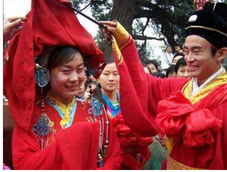
Gelin ve Damat