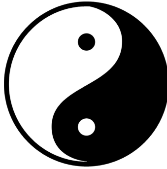
Yin Yang Sembolü

Kadınlara, toplumsal gelenek ve göreneklerle dayatılan bu 'düşük statü', hiyerarşik düzene sahip Çin toplumunun kendini ifade tarzlarından yalnızca biridir. Bu, bir anlamda toplumun bütün sosyal katlarını ve Çin toplumunun hayat evrenini dile getirmektedir. 35