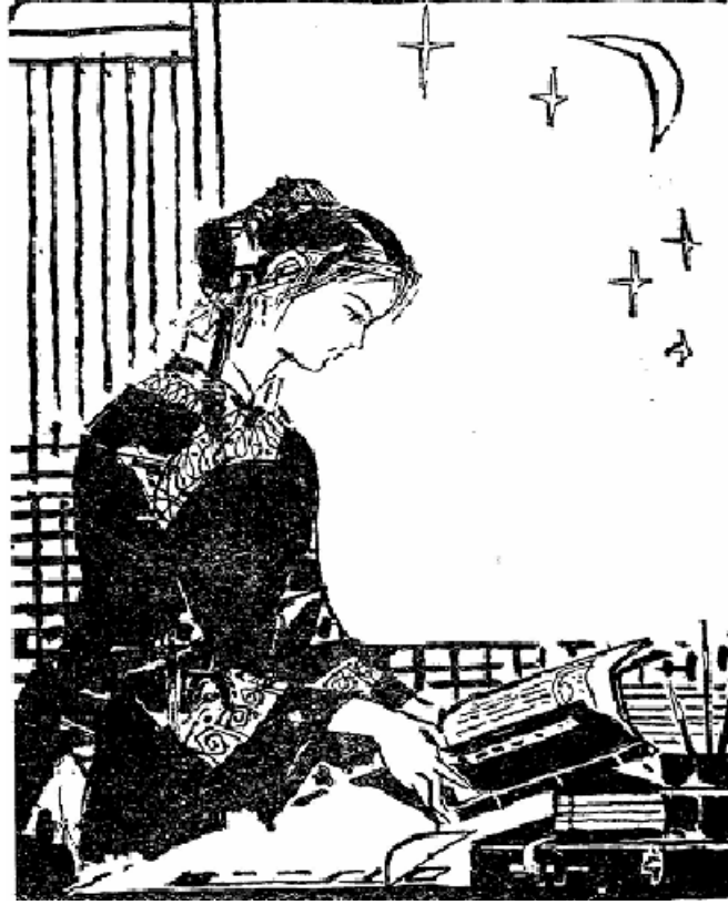
Wang Zhen Yi

Wang Zhen Yi, Qing Hanedanlığı döneminde yaşamış ilk kadın matematikçi ve astronomdur. Bilimsel konulara ilgisinin yanında, şiir, resim, okçuluk ve binicilik dallarında da önemli başarılarla imza atmıştır. Bu başarılı kadın, 29 yıllık yaşamını, kendini geliştirmeye adanmış Çin toplumunun şanslı azınlığından biridir. Çin'in feodal düzeninde, çok az kadının eğitim alabildiği göz önünde bulundurulursa, Wang Zhen Yi'yi şanslı azınlığa dahil etmiş olmak yanlış olmayacaktır.