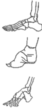
Bağlı ayaklarda meydana gelen kemik deformasyonu

Ayak bağlama uygulamasına, kız çocukları henüz 3 yaşındayken başlanırdı. Uygulamaya küçük yaşta başlanmasının sebebi, kemiklerin henüz gelişmemiş olması ve kıkırdak halinde bulunan bu kemiklere biçim vermenin daha kolay olmasıydı. Bu işlem, genellikle sonbahar ya da kış aylarında gerçekleştirilirdi. Bu mevsimlerin tercih edilmesinin nedeni, ayakların bu dönemde soğuktan uyuşması ve böylelikle acının çok fazla hissedilmemesiydi. 60