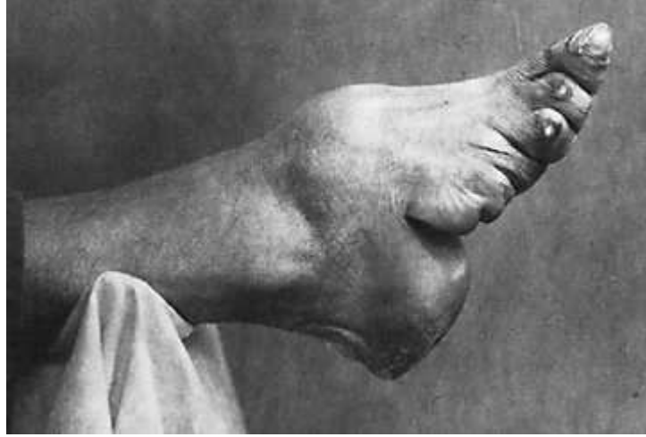
Ayaęın geęirdięi korkun deęiřim

değiřtirmiyor, aynı zamanda, pelvik bölgesindeki kaslarının sıkılařmasını saęlıyordu. Bu da, erkekler için cinsel birleřmenin daha zevk verici olmasını saęlıyordu.