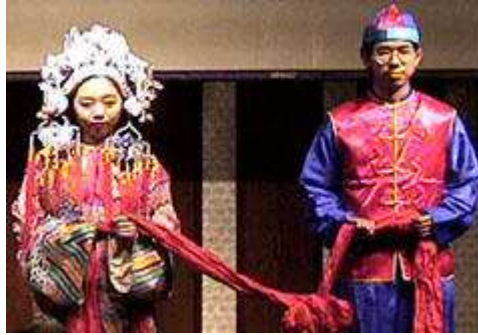
Geleneksel Kıyafetleriyle Gelin ve Damat

Gelinin saç yapımı ve damadın başlık giymesi, düğün hazırlıkları içinde çok önemli bir yer tutardı. Bu törenler, çiftin yetişkinliğe adım attıklarının bir göstergesiydi. Batı geleneklerinden farklı olarak, geleneksel Çin düğünlerinde kırmızı renkli kıyafetler kullanılırdı. Belirlenen düğün günü gelip çıktığında, gelinin ve damadın evi kırmızı eşyalarla donatılırdı. Çinlilerin, bu gibi özel günlerde, kırmızı rengi kullanıyor olmalarının sebebi, bu rengin, neşeli bir ortam yarattığına ve uğur getirdiğine inanmalarıydı.