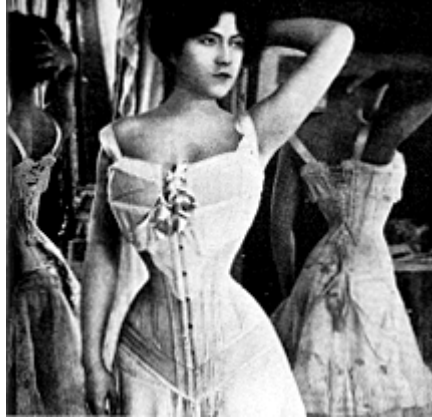
Eski Çağ Avrupası' nda güzelliğin simgesi korse

Tarihler boyu bütün kültürlerin ortak amacı, güzelliğe ulaşabilmek ve güzel olmayı başarabilmek olmuştur. Güzellik uğruna, kadınlar ve erkekler çağlar boyu pek çok acı ve ızdırap çekmişlerdir. Kültürden kültüre değişimler gösteren güzellik kavramı, bize, ortaya çıktığı toplumun yapısına, geleneklerine ve kadın - erkek arasındaki farklılıklara dair önemli ipuçları vermektedir.