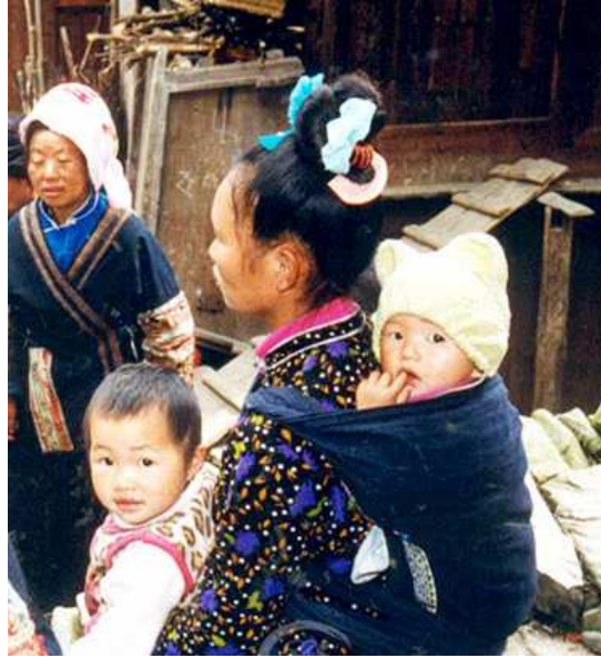
Çinli bir anne ve iki çocuğu

Yin, karanlık, zayıf, pasif ve dişi şeylerin; Yang ise, aydınlık, kuvvetli, aktif ve erkek olan şeylerin niteliğini sembolize etmektedir. Bu ideolojiyi temel alan eski Çin filozofları, yüzyıllar boyu kadınlardan itaatkâr ve pasif olmalarını beklemiş ve bu doğrultuda birtakım kurallar belirlemişlerdir. Bu kurallara göre, kızlar evin erkek çocuklarına, kadınlar kocalarına, anneler oğullarına bağımlı olmak durumunda kalmışlardır.