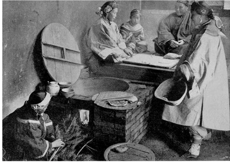
Ayağı bağlı Çinli kadınlar mutfakta yemek yaparken

Kayınvalideye bir şey olması durumunda, kocalarının kız kardeşlerinin denetimi ve bakımı altında hayatlarını sürdürürlerdi. Pek çok kadın, Konfüçyanizmin ve toplumsal estetik yargılarının verdiği güçle bu durumdan şikayetçi olmazdı. Çektikleri acının karşılığında, yüksek toplumsal statü, zenginlik, saygınlık ve iyi bir evlilik elde edeceklerini düşünürlerdi. Ayağı bağlanan her kız çocuğunun, hükümdarın karısı olmaya aday olduğu söylenirdi. Bu küçük ayaklı kadınlar, bu nedenle kendilerini ayrıcalıklı hissederlerdi. Bağlı ayaklarıyla cinsel cazibenin ve namusun timsali sayılırlardı. 64