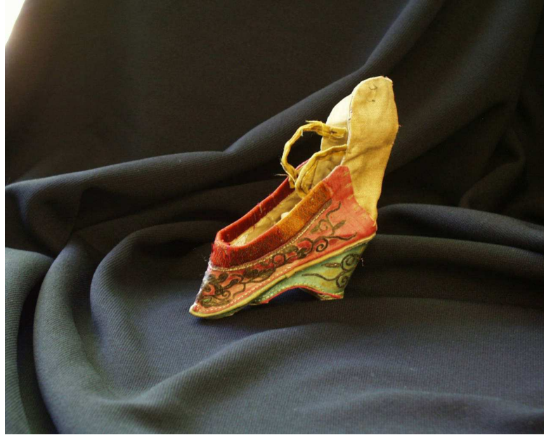
Küçük bir lotus ayakkabı

Ayak bağlama geleneği, bir statü sembolüydü. Kadınları daha cazip, evlenilebilir ve yüksek bir sosyal statüye sahip kılıyordu. Bu uygulama önceleri, varlıklı aileler arasında uygulanmaya başlanmış; bir süre sonra, alt sınıf aileler de, kızlarını yüksek sınıftan bir erkekle evlendirme umuduyla kızlarının ayaklarını bağlamaya başlamışlardır. Ancak, bu tarz evliliklerin çok olmaması sebebiyle, bu kızlar, ömürlerinin kalan kısmında, ayakları bağlı olduğu halde, tarlalarda zor koşullar altında çalışmak zorunda kalmışlardır. 66