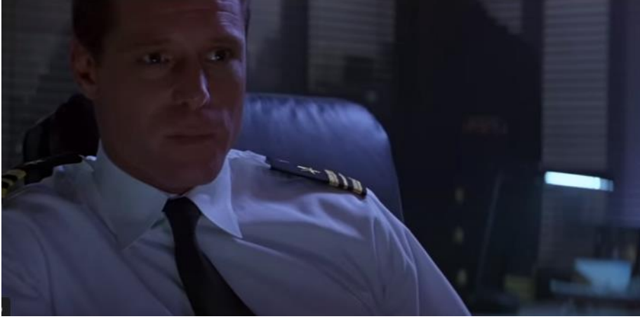
Görüntü 4. O'Neill'in erkek arkadaşı Royce karakterinin görünümü