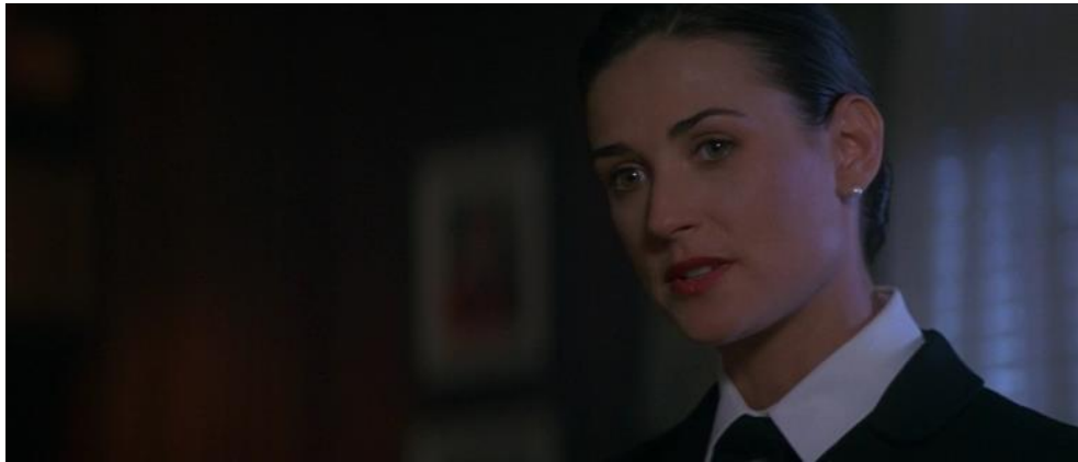
Görüntü 1. O'Neill karakterinin görünümü