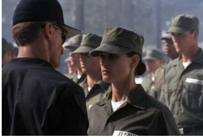
Görüntü 5. Komutan Urganyle'in birlik karşısında konuşması

önemli meslektir. Ciddi bir eğitim, bilgi, beceri, dikkat, konsantrasyon, sezgi yeteneği, doğru ve hızlı karar alabilme ve soğukkanlı olmayı gerektirir. Askeri karargahın lideri de komutandır. Askeri karargahta komutanın fikirleri ve eylemleri önemlidir. Komutanın fikir ve eylemleri başkalarının düşünce ve davranışlarını etkiler. Komutan Urganyle'nin karargahdaki hareket ve tavırları dominant ve etkin geleneksel erkek cinsiyetinin rol modelini göstermektedir. Bu bağlamda eril şiddetin, genel kabul görmüş değerlerin korunması amacıyla ortaya konan bir davranış biçimi olduğunu söylemek mümkündür. Komutan Urganyle'nin bu tavırları hem O'Neill üzerinde hem de diğer erkek askerler üzerinde etkili olmakta, onlar üzerinde baskı yaratmaktadır.