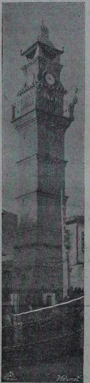
پوزفاده ساعت قلدى

خدمات مدموحه سنه ميني بيهاد معتبرانندن خياط زاده عبدالجبار بكه تديلا ايكني رتبه ندى عيبدى تلفراف وپورته نظارتى مجلس اداره رئيس ووكيلي سعادتلو صلاحى بك افندى به اوجي رتبه ندى عثمانى سرساتان رئيس نظار و خارجيه نظارى موسيو هاكسدا نواوويوچ چنابلرته ريحى رتبه ندى عثمانى وداخله نظارى موسيو لازار پوپويوچ وعايله نظارى موسيو ميغاپوپويوچ وهدليه نظارى تشرواندوويوچ وخرىبه نظارى قائم مقام موسيو ميلوش وشيخ ونيجات وزراعت نظارى موسيو دوشان ساسيج وناغه نظارى قائم مقام موسيو اندر پوپويوچ وماروف نظارى موسيو بولمارنوويوچ چنابلرته رتبه ندى كورده و صربستان خارجيه نظارى مطبوعات اجنبيه تالينده مستخدمه سانبى فورسبونلانس بالمانيق غزافه مديرى موسيو بوكوسه اوجي رتبه ندى عيبدى وبيروت پوپويوچ توميسرى نيولا مانويه وچي دروندى رتبه ندى عثمانى شان نظارى