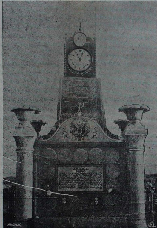
ديار بكرده انشا قناتان چشمه

حسن خدمتليه ميني خالى تجارندن سراج الدين بكه اوجي وپايله كائند قايقره سنك درسمادات اجنبه موسيو طاهر دروندى رتبه ندى عثمانى وكائند تجارندن راضى بكه مصطلح نظام افندى به رتبه ندى كورده ندى عيبدى و اكني اوردى هاونه منسوب بدنجى سيار طويچى الايك ايكني بلوكى پوز باشي استاهلى على افندى به دروندى رتبه ندى عثمانى باب والى سرعسكرى سوارى داره بويه ريحى