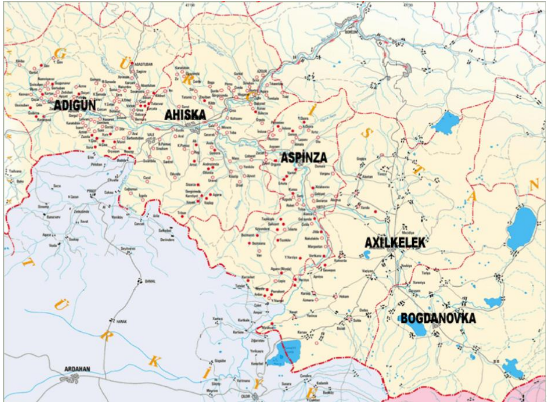
Şekil 1: Ahıska Haritası 84

Günümüzde Ahıska Sancağı toprakları; Samtskhe-Cavakheti Bölgesi'nin güneybatı kısmını oluşturmaktadır (Şekil 1).