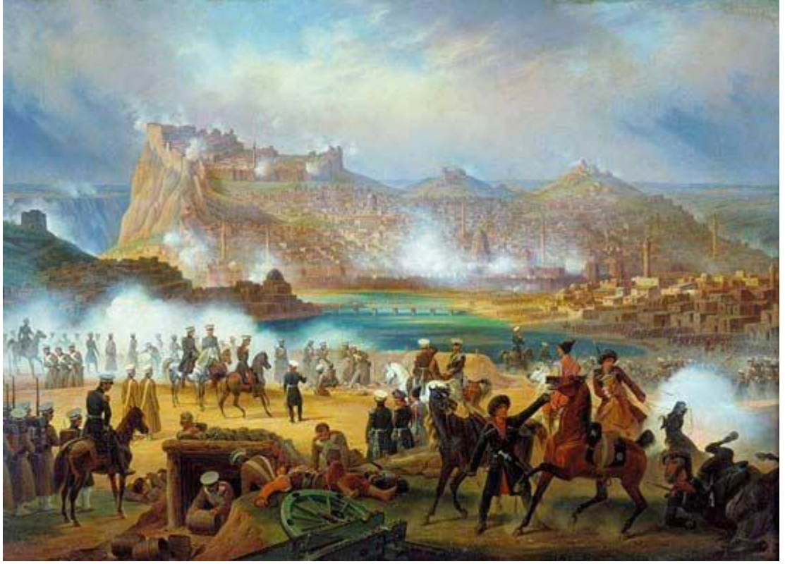
Şekil 3: 1828-1829 Rus-Türk Savaşı Zamanı Kars'ın Kuşatılması 179