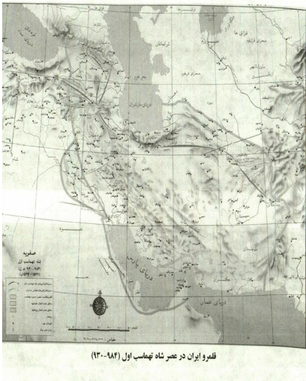
Şah Tahmasb döneminde Safevi devleti'nin haritası