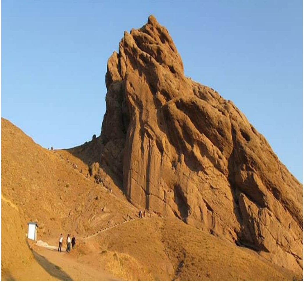
Alamut Dağı. Şah Tahmasb'ın kardeşi Alkas Mirza, buradan aşağıya atılmıştır.