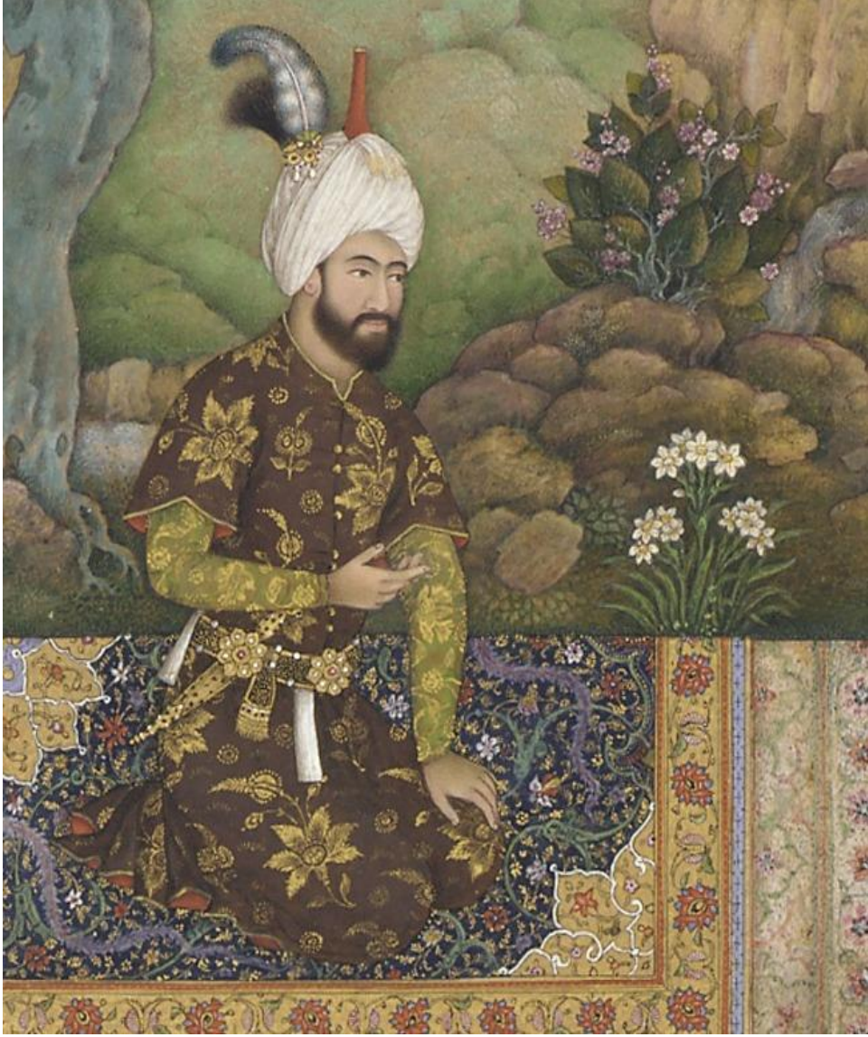
Şah Tahmasb Safevi