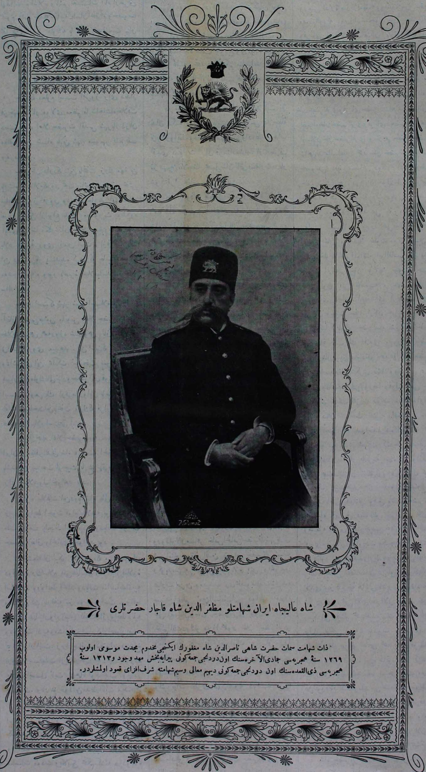
شاه عالیجاه ایران شمانلو مظفرالدین شاه قاجار حضر تلری

شرفك كزیده ، محتمم ، حلیه عرفان و حصافته متصف حکمداران عقلمندن اولان ذات شهامتت جناب، شاهی غریك الك قوی الشکیمه، الك معبود، الك زیاده معارف و صنایع مدنیه سیله مشهور حكومات و بلادی آره سنده محضا قدره الی خسروانه لرینك جهان شایع اولان علوم منزلت و مسومریت كاهرا ایلریشه جسدان اوله جق صورتنده مظهر تعظیم و تكبریم اولدق قبری كچه جامعیت اسلامیه حیثیت مجله سی و دولت علیه عثمانیه ك ع... کرم عالی تساری بولنلری مناسبت جلایه سیله دخ قلمر و عثمانیه قدم شاهیلری