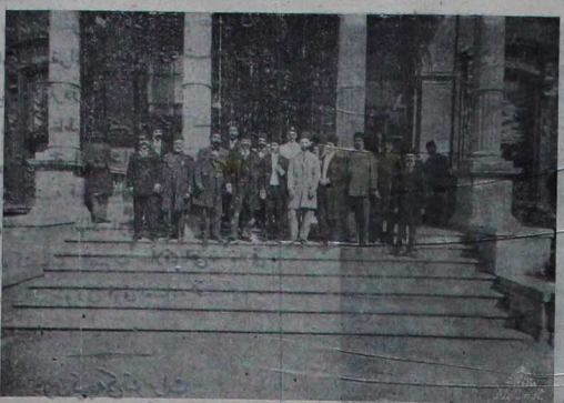
در سادات ایران سفارتخانه سنک بیوک قومی

شاه حضرتلی یلدز سرای هایون باغچه نده واقع قصر تالی به مواصلا نده ذات شوکنیات اقدی حضرتلیله ملاقات شرف و توفیق اولمشدر اوراده شاه شهنشاهت بنام حضرت تلی شوکنیات قدر تصاب اقدی حضرت تبریک ذات معالی بیوست ملاقات فریق بولمشدر .