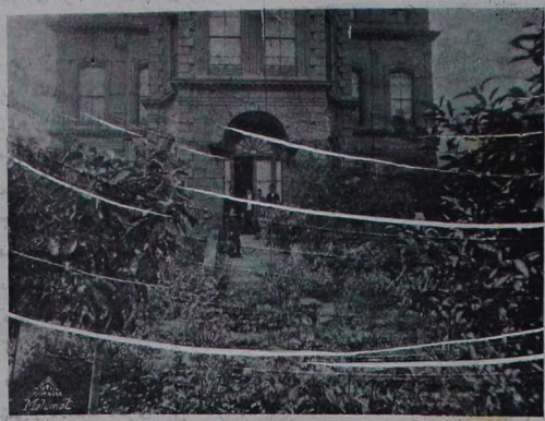
در سادات ایران سفارتخانه سنک باغچه ناظر اولان قومی

حسن خدمت لرینه مین بحریه نظارت جلیلهی محاسبه قلمی مهمه عمیزی منزلت خاله اقدی به ترینا معازز بولنسه فلندنه تمینیات مسکریه کاجی عبیدی اقدی به ترینا ثانیه وایمان دارومی فرمان قلمی عمیزی ورفتنورستم اقدی به اداره مخصوصه بحریه قلمی مسودی صاحبک ایل نظام دارومی کیتسندن مصطلق وسندوب آجنتسی عثمان وقرمهنا آجنتسی اسماعیل حق اقدیلرله ترینا و بحریه محاسبه قلمی غلظتندن جیل بک ایله حاجی ادم اقدی به ناله