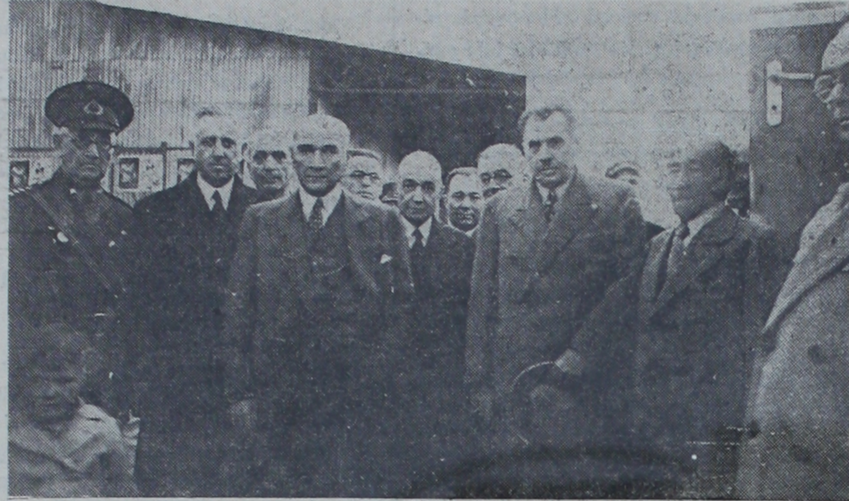
Atatürk Çiftlik istasyonunda kendisini karşılayanlar arasında

dir. Çukurhisarda bir tayyare filomuz tarafından selamlanan Ulu Önder Eskişehir İstasyonunda Vilayet Erkânı, Kolordu Kumandanı ve Karargâh Erkân ve Zabitanı, Belediye Reisi ve Heyeti, Cumhuriyet Halk Partisi Erkânı tarafından karşılanmıştır. Şehir baştanbaşa donanmıştır. Atatürk sokakları dolduran kesif bir halk tabakasının coşkun tezahürleri arasında geçerek Kumandanlık, Vilayet, Belediye ve Cumhuriyet