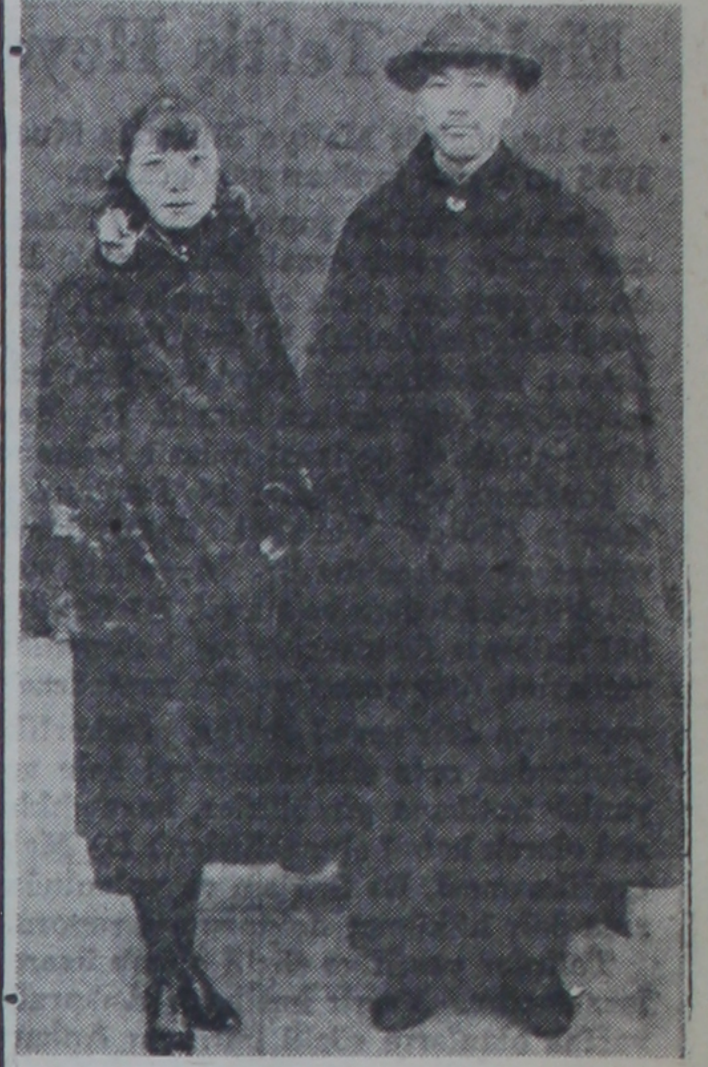
Mareşal Çan Kay Şek ve karısı

Nankin ile Kanton arasında anlaşmazlık olduğunu yalanlıyor