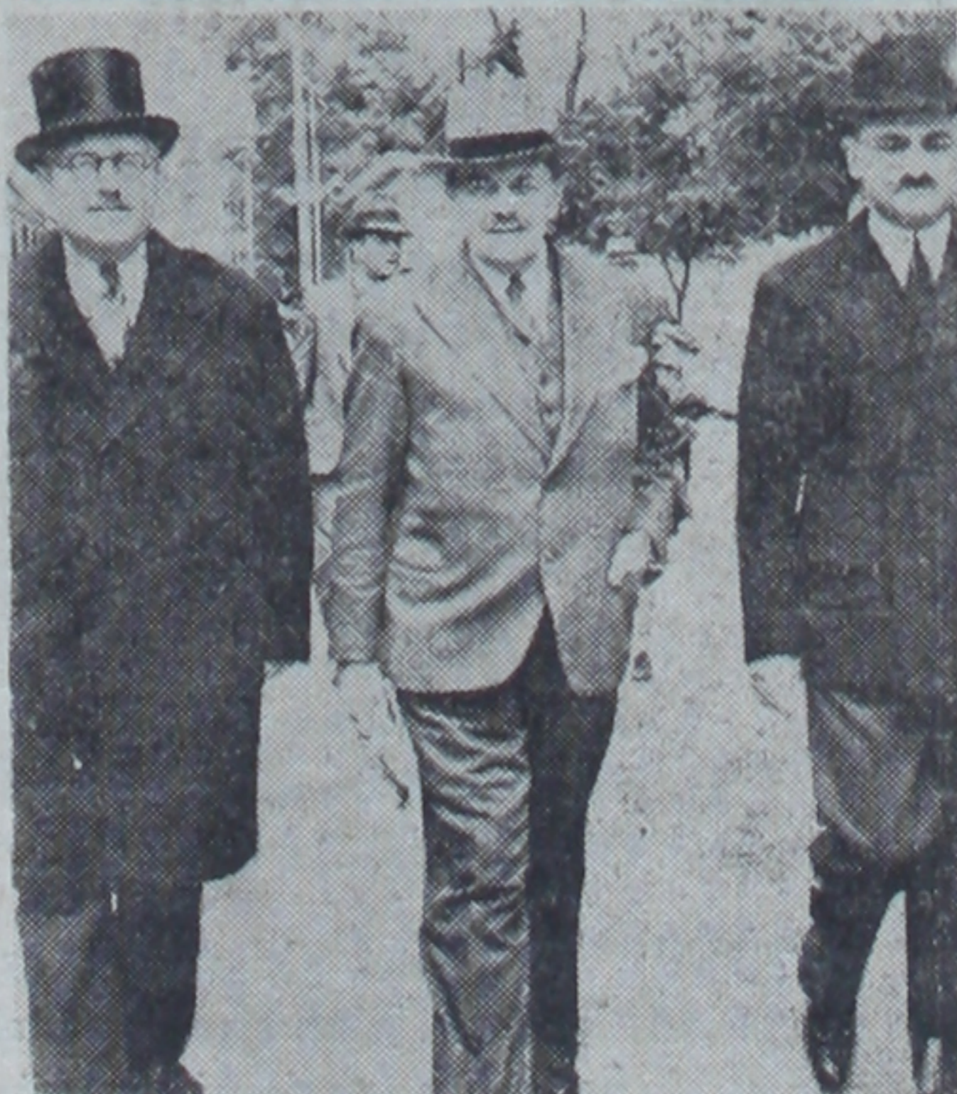
Polonyanın Ankara büyük elçiliğine tayin olunan doktor Mişel Sokolnicki dün sabahki ekspresle şehrimize gelmiştir. Resmimiz elçiyi garda ken-disini karşılayanlarla gösteriyor

kardığı kanun projeleri şunlardır: Satılan kinin bedellerinin sıhat ve içtimai muavenet vekâleti bütçesinde a- (Sonusu 5. inci sayfada)