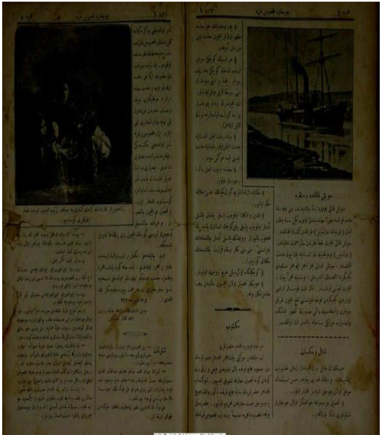
- Çocuklara Mahsus Gazete'den bir sayfa