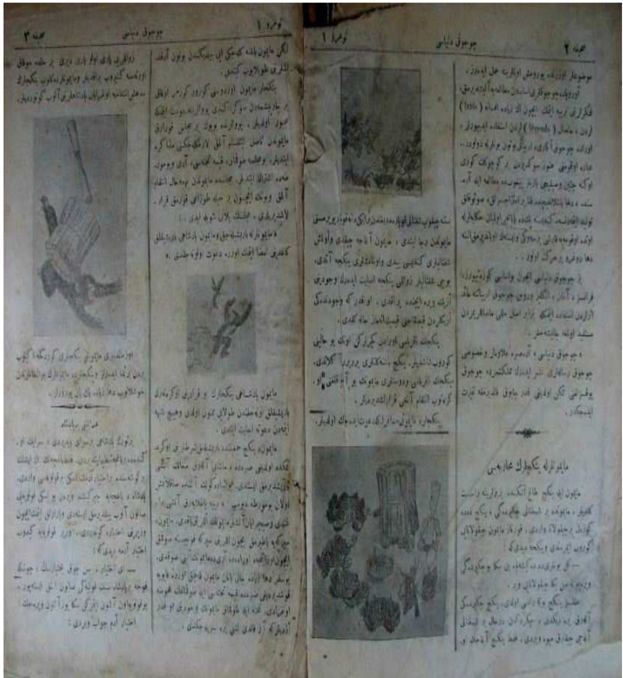
- Çocuk Dünyası'ndan bir sayfa