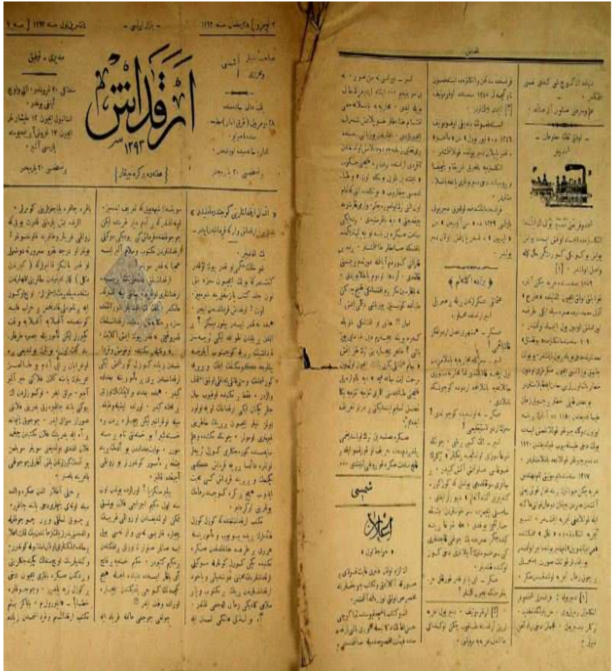
- Arkadaş dergisinden bir sayfa