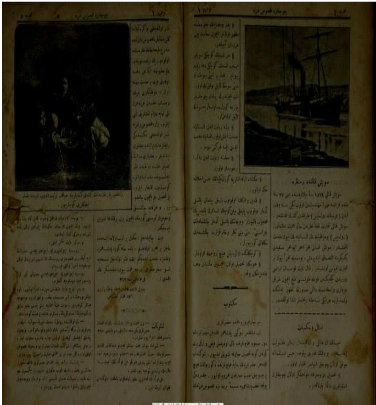
- Bizim Mecmua'dan bir sayfa