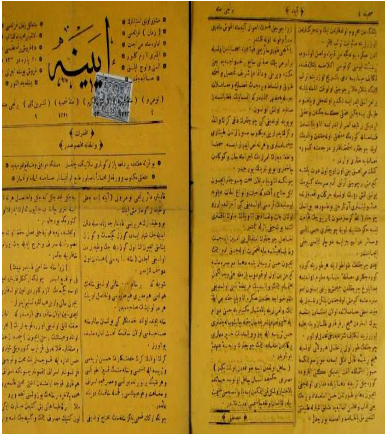
- Ayine dergisinden bir sayfa