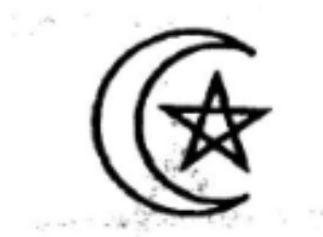
Şekil 3: MSTA'nın sembollerinden hilal ve yıldız. 248