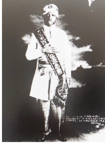
Şekil 1: Noble Drew Ali'nin bir görünümü. 237

Ali'nin genelde giydiği kıyafeti ile aynıyken Drew Ali'den sonra harekette genel kabul gören kıyafet kurallarından esinlenerek yeni bir üniforma oluşturulmuştur. 236