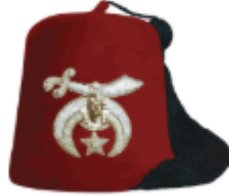
Şekil 6: Shriners grubunun fesi. 259

Amerikan Mason grubu olan Shriners tarafından da fes kullanılmaktadır. Shriners'ın fesinin üzerinde kendilerine has semboller olan bir hilal ve yıldızın üzerinde işlemeli bir kılıç bulunmaktadır. MSTA'nın taktığı fesin üzerinde ise herhangi bir işleme