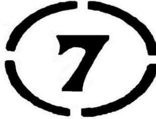
Şekil 4: MSTA'nın sembollerinden çember içerisindeki 7 sayısı. 253

Dört kesikli bir çemberin içerisinde yer alan “7 sayısı” sembolü, kutsal metinleri olan Holy Koran 'ın başında da yer almaktadır. Bu yedi sayısı, yaratılışın yedi günde