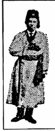
NOBLE DREW ALI