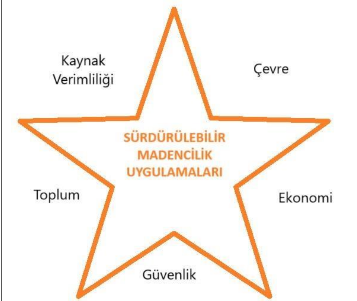
Şekil 1. Sürdürülebilir madencilik uygulamalarının beş boyutlu temsili

Yeşil madenciliğin temel ilkeleri, sürdürülebilir madenciliğin beş boyutlu diyagramıyla gösterilebilir. Ayrıca sürdürülebilir finans araçları da YM temel ilkeleri arasında gösterilir.