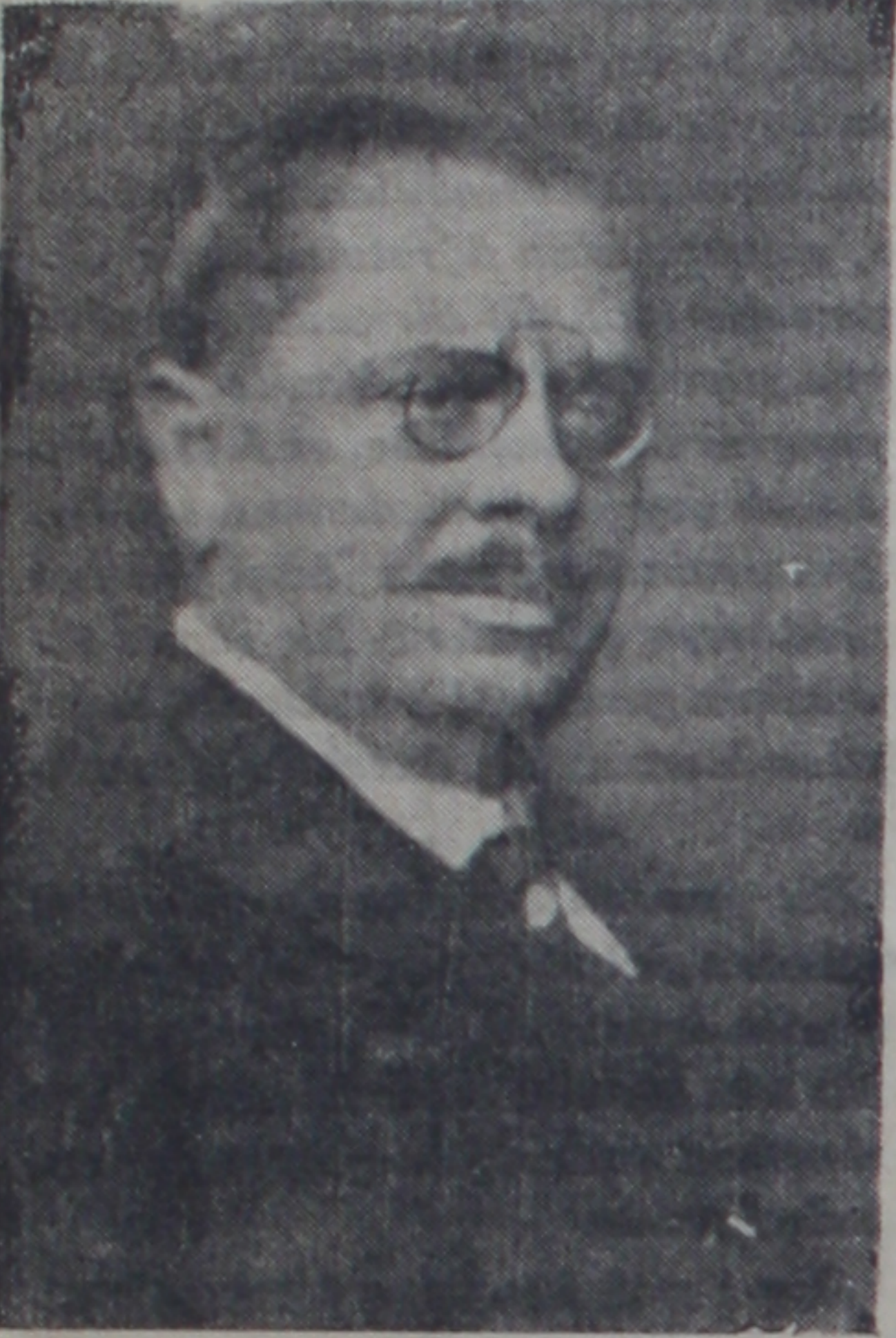
B. Jan Malipetr

Çekoslovakya Cumur Başkanı B. Mazarik'in bugünlerde sıhi sebeplerden dolayı istifa edeceği söylenmektedir. Birkaç zamandanberi bu işten, kapalı bir tarzda arsulusal mahfilerde bahs olunmakta idi. Londra gazetelerinin verdikleri haberler ise, bu hadisenin nerede ise vukua geleceğini göstermektedir. Eğer B. Mazarik bugünkü şartlar içinde işinden çekilirse bu çekiliş Çekoslovakya tarihinde bir hâdise olmakla kalmıy-