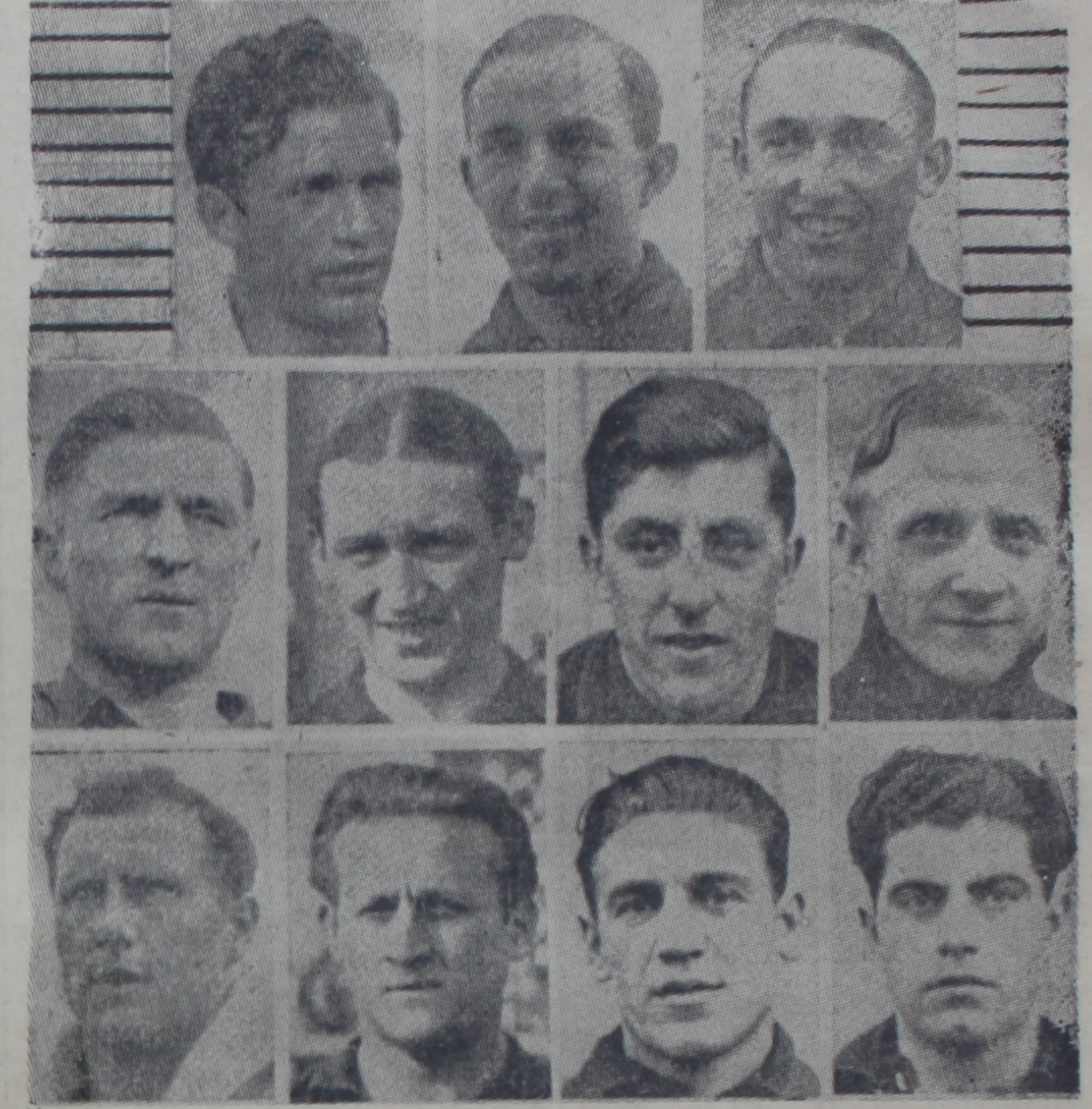
Londrada maç yapan Alman milli takımı