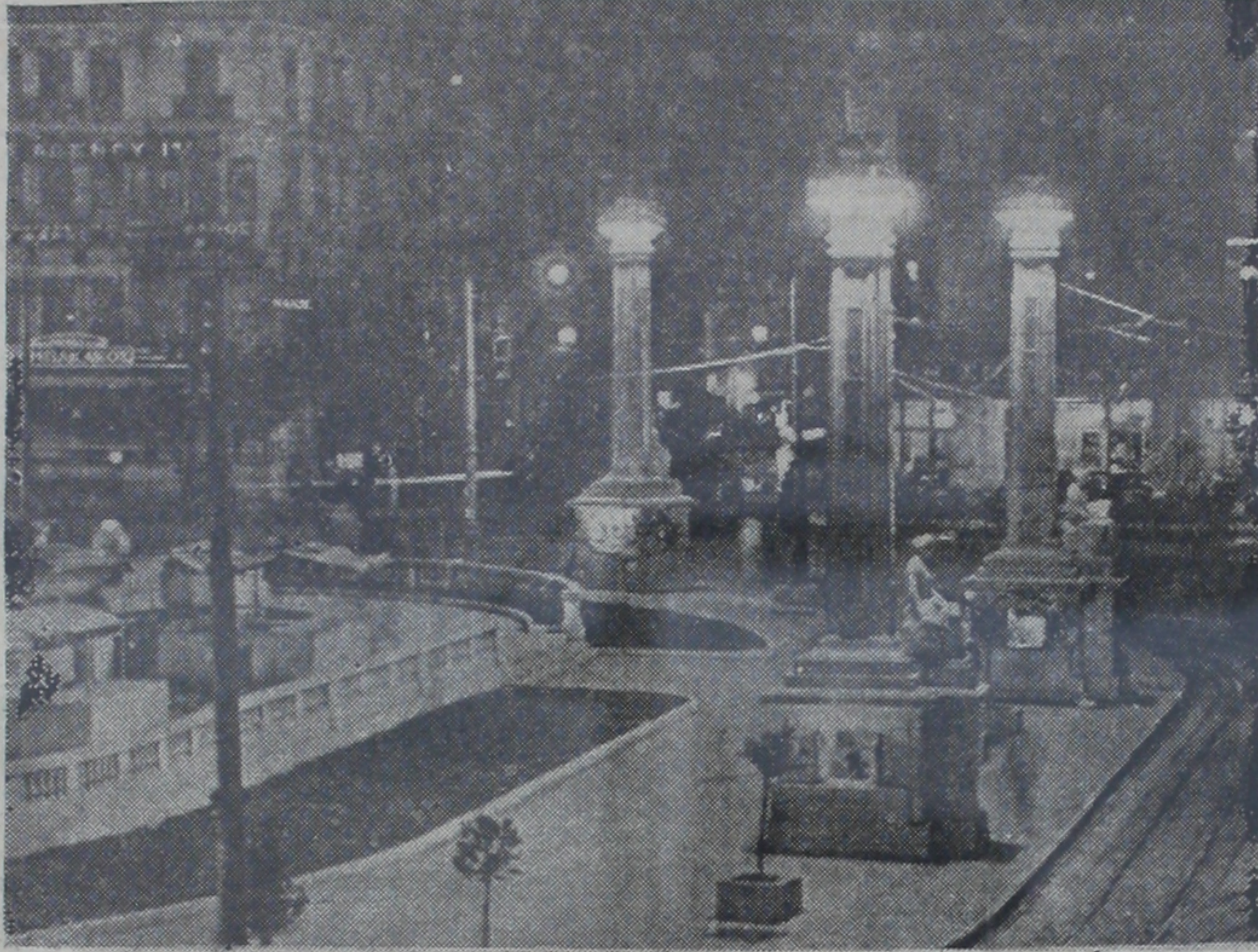
Atinada birlik meydanı

İyi haber alan siyasi mahfillerin tahminine göre, milli meclis yakında dağıtılacak ve son kanun (Sonu 6. ci sayıftada)