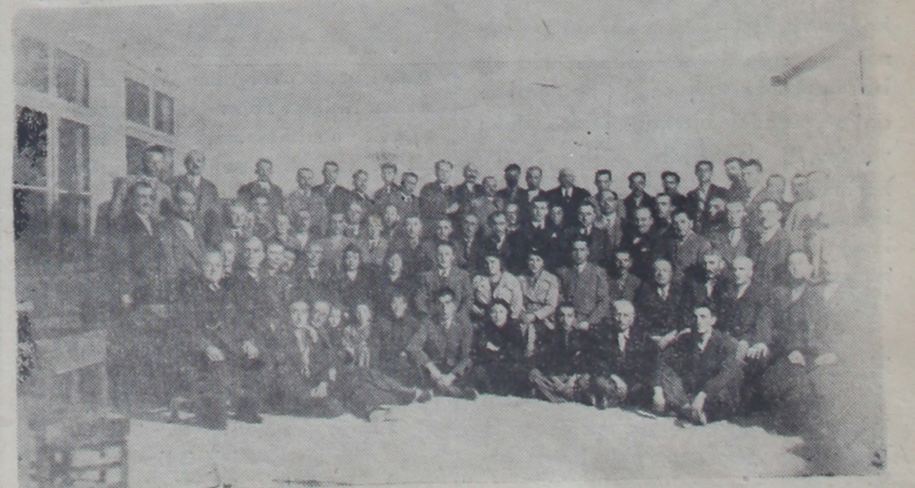
Hisar kamunu kongresi

(*) Köy öğretmenin anıları. Yazar: Ankara kültür yarıdirektörü M. Ferid Karşlı. 254 sayfa. Tarık Edip Kitabevi. Tanesi 100 kuruş.