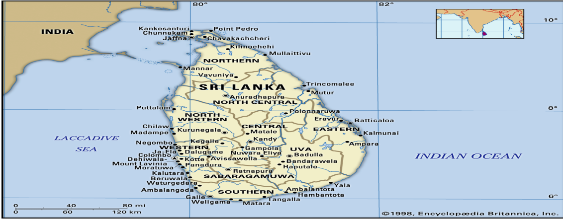
Şekil 3: Sri Lanka/ Seylan Haritası

Britannica, Sri Lanka, 1998, Encyclopædia Britannica, Erişim: 20 Ağustos 2024, https://www.britannica.com/place/Sri-Lanka/History#/media/1/561906/61820