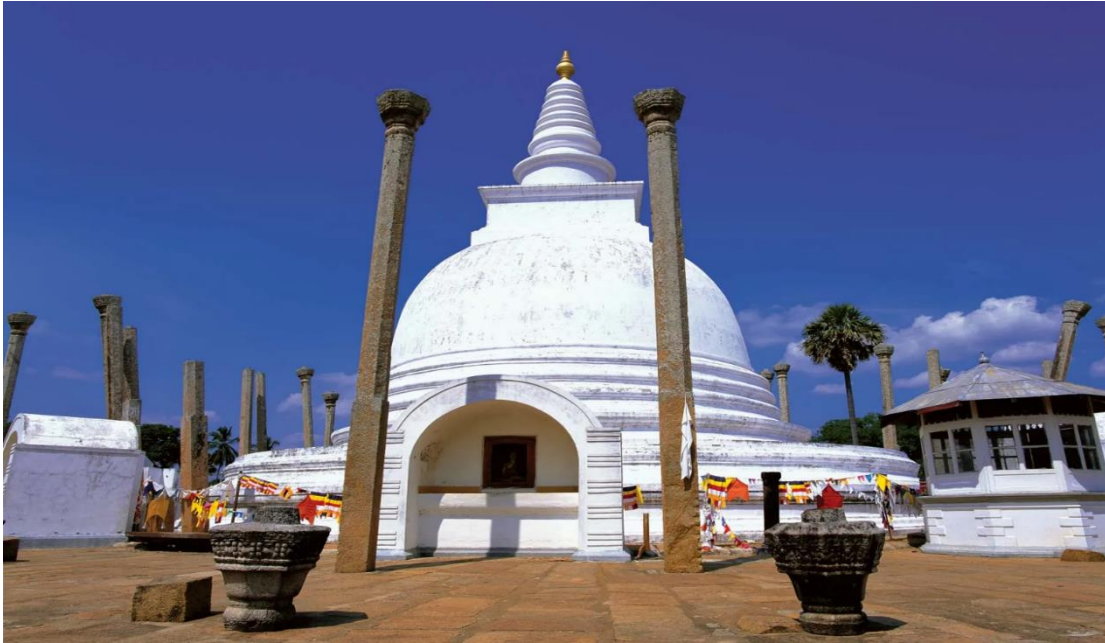
Şekil 5: Thurapama Dagoba, Sri Lanka Tarihindeki İlk Stupa, Anuradhapura Antik Kenti Anuradhapura: Thuparama dagoba, Encyclopædia Britannica, Erişim: 22 Ağustos 2024, https://www.britannica.com/place/Anuradhapura-Sri-Lanka#/media/1/29032/188793

manastır adadaki Theravada Budizm'inin de zamanla merkezi haline gelerek aynı zamanda bir ekol haline dönüşmüştür. 156 Bu manastırın olduğu bölgede Mahinda'nın isteği üzerine "sıma" adı verilen kutsal sınırlar belirlenmiştir. Mahinda'nın bu istekte bulunmasının nedeni kaynaklara göre bir bölgede sasananın yani Budist öğretinin tam anlamıyla yerleşmesi için sıma adı verilen kutsal manastır sınırlarının belirlenmiş olması gerekliliğidir. 157 Kral, anlatıya göre bu sınırları bizzat kendi çizmiştir. Kral Devampiya Tissa'nın bundan sonraki önemli olan bir diğer faaliyeti ise Mahinda'nın sözlerinden etkilenerek Buda'nın bazı kutsal emanetlerini ülkesine getirtmesidir. Buna göre Mahinda aralarında geçen bir konuşmada Kral'a: "Buda'nın emanetlerini görmek Buda'yı görmek gibidir." demiştir. 158 Bunun sonucunda Devanampiya Tissa, Maurya Kralı Asoka'dan da destek alarak Buda'nın sağ köprücük kemiğini ülkesine getirmiş ve bu kutsal emanetin üzerine adanın ilk stupası olan Thuparama Dagoba'yı inşa etmiştir.