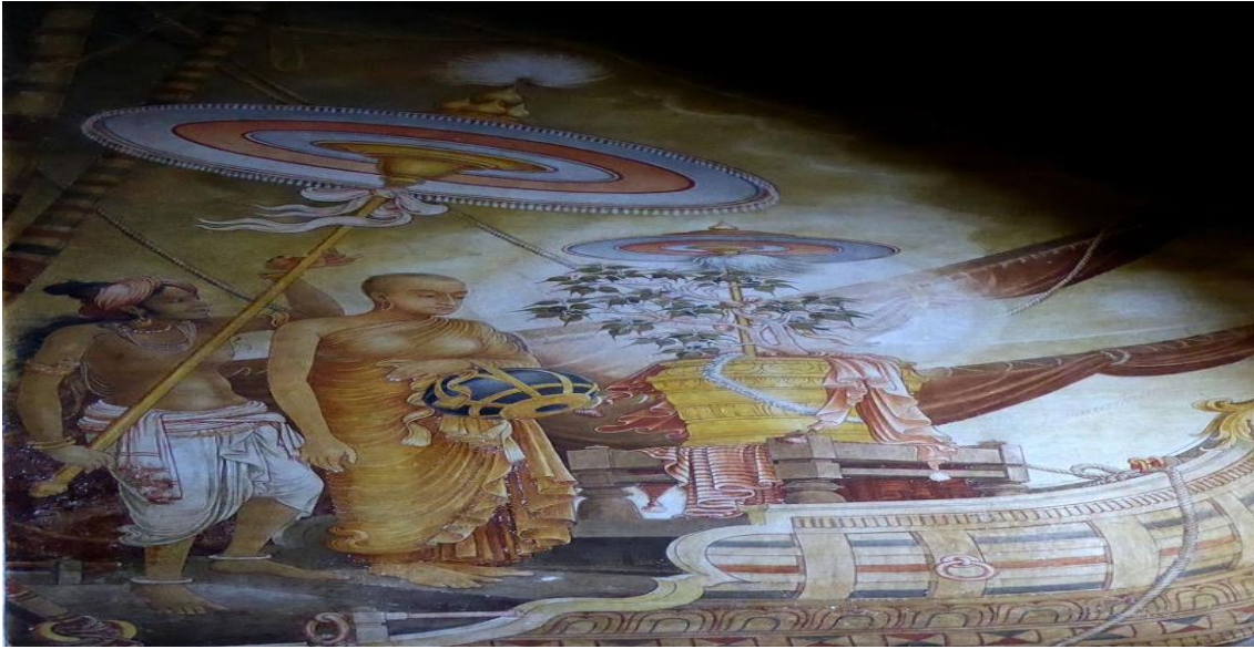
Şekil 6: Sanghamitta'nın Mahaviharaya bodhi ağacının dalını getirişinin temsili resmedilişi