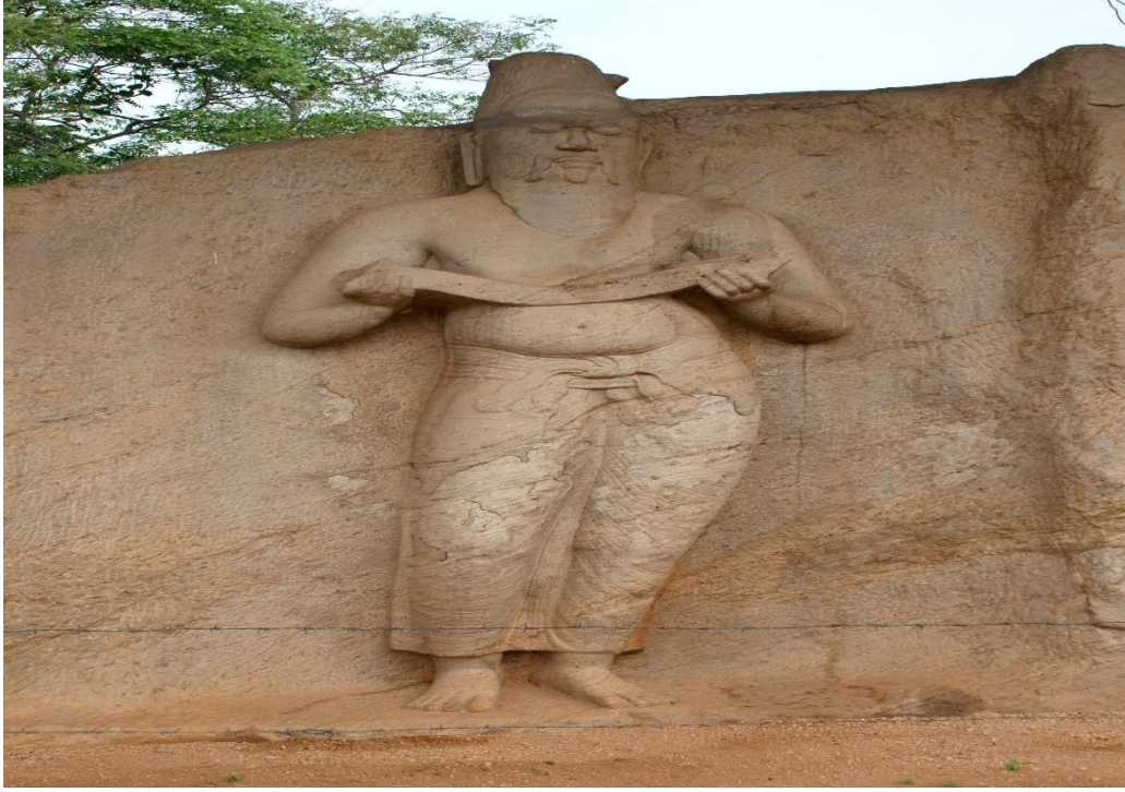
Şekil 4: I. Parakramabahu Heykeli, Polonnaruwa Antik Kenti

Kral Vijayabahu'dan sonra onun döneminde de ufak ufak ortaya çıkan iç karışıklar 1153 yılında Kral Parakramabahu tahta çıkana kadar devam etmiştir. 133 “Büyük Parakramabahu” olarak da anılan Kral, öncelikle ülkesindeki iç karışıkları harikulade bir siyaset güderek bitme noktasına getirmiş ve bu durum Vijayabahu'dan sonraki uzun yılların ardından tahtta meşru bir şekilde oturmasını sağlamıştır. Parakramabahu bunun ardından güneyde önemli bir tehdit haline gelen Ruhuna Krallığı tehlikesini, ülkesine Buda'nın dişi gibi kutsal emanetleri getirerek dini bir meşruiyet sağlama yoluyla bertaraf etmiştir. 134 I.Parakramabahu, ülkesindeki siyasi bütünlüğü sağlayıp adanın bütününe hâkim olduktan sonra başta tarım ve kültür-sanat olmak üzere pek çok gelişime öncülük etmiş ve bunun sonucunda Polonnaruwa dönemin önemli merkezlerinden biri haline gelmiştir. 135 Kral Parakramabahu'nun dönemindeki (1153-1186) başarıları ve kişiliğine Culavamsa'da büyük bir yer verilmektedir. Bu durum, onun Sri Lanka geleneksel anlatılarındaki önemini ve yerini göstermektedir.