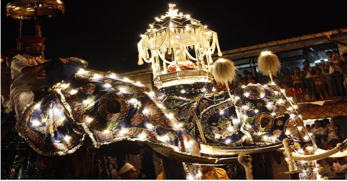
Şekil 12: Geçit töreninde fil üzerinde sergilenen kutsal kutu

ve filler eşlik eder. 217 Esala Perahera festivali ve geçit töreni Kandy şehrinde düzenlenmektedir. Asya kıtasının en büyük ve görkemli kutlamalarının yaşandığı bu festival Sri Lanka Budizm’inde reliklere gösterilen hürmet ve önemi de göstermektedir. Esala Perahera geçit töreni yaklaşık on gün boyunca devam etmektedir. Onuncu günün sonunda ise Buda’nın Kutsal Dişi, Sri Dalada Malagawa tapınağına iade edilir. Törenin sonuncu gecesi olan bu geceye “Randoli Perahera” denilmektedir.