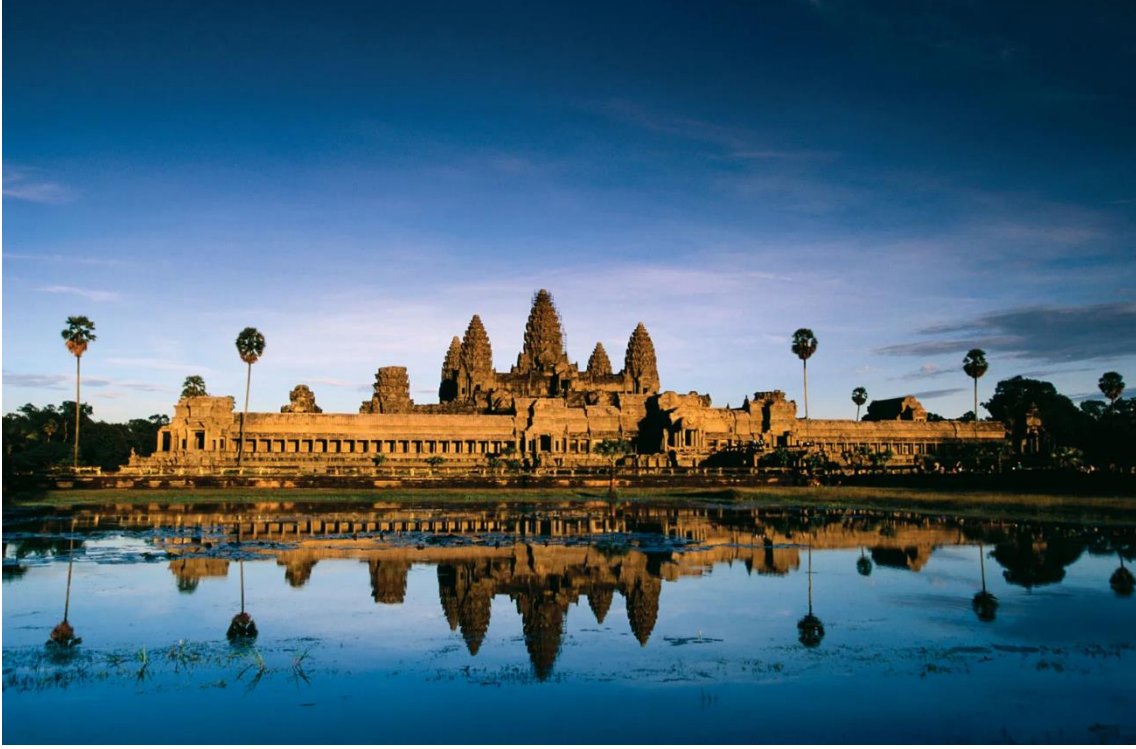
Şekil 1: Angkor Vat Tapınak Şehri

konaklama yerleri, manastır ve tapınaklar inşa ettirmiştir. 80 Adanmış bir Mahayana Budist'i olan VII. Jayavarman ülkesinin o dönemki merkezi olan Angkor yakınlarında bulunan Angkor Wat tapınak şehrini yeniden inşa etmiş ve yakınlarına da buna benzer yeni bir tapınak merkezi olan Angkor Thom'u kurmuştur. 81 Bu kompleks tapınak merkezinde Kamboçya'nın dini hayatından izler taşıyan pek çok dini yapı bulunmaktadır.