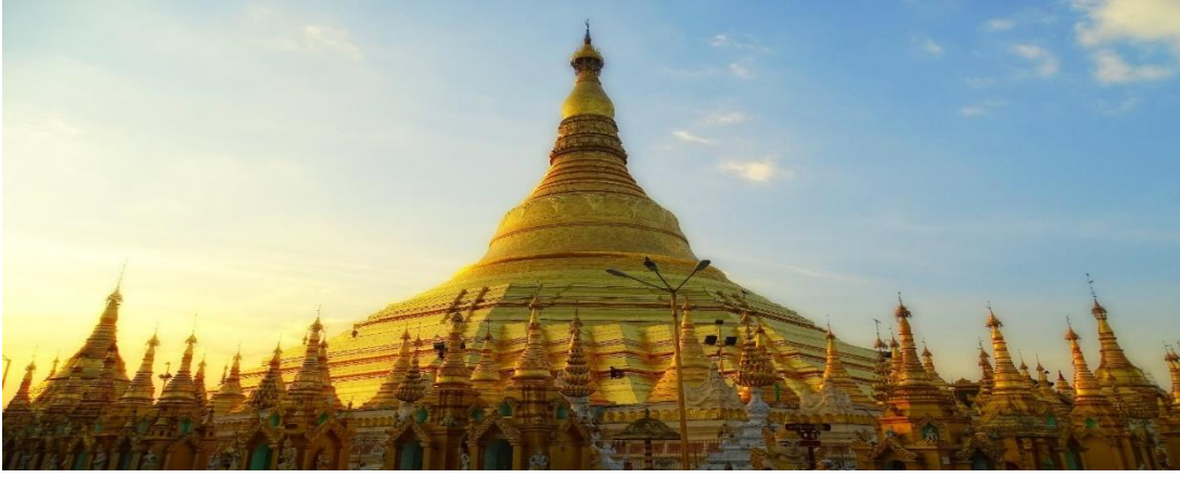
Şekil 2: Shwedagon Pagodası