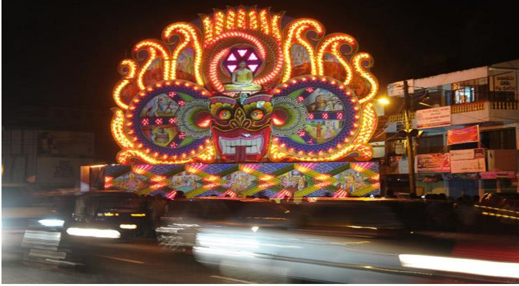
Şekil 10: Vesak Festivali Sırasında Sri Lanka Sokaklarından Bir Görüntü

sağlamıştır. Olcott ve çeşitli liderler öncülüğünde adada etkili bir çalışma yürüten Budist topluluk, Vesak Bayramı'nın İngilizler tarafından resmi bir tatil olarak tanınmasını sağlamıştır. Bu anlamda söz konusu dönemde Vesak Bayramı, adada git gide artan batılılaşma ve İngiliz misyonerlerin faaliyetlerine tepki olarak Sinhala Budist kimliğinin bir uyanışı kabul edilmiştir.