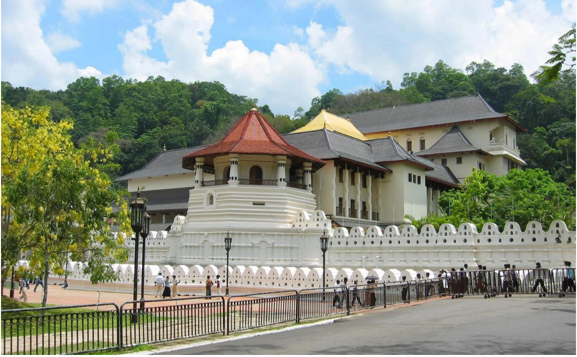
Şekil 8: Sri Dalada Maligawa Tapınağı, Kandy