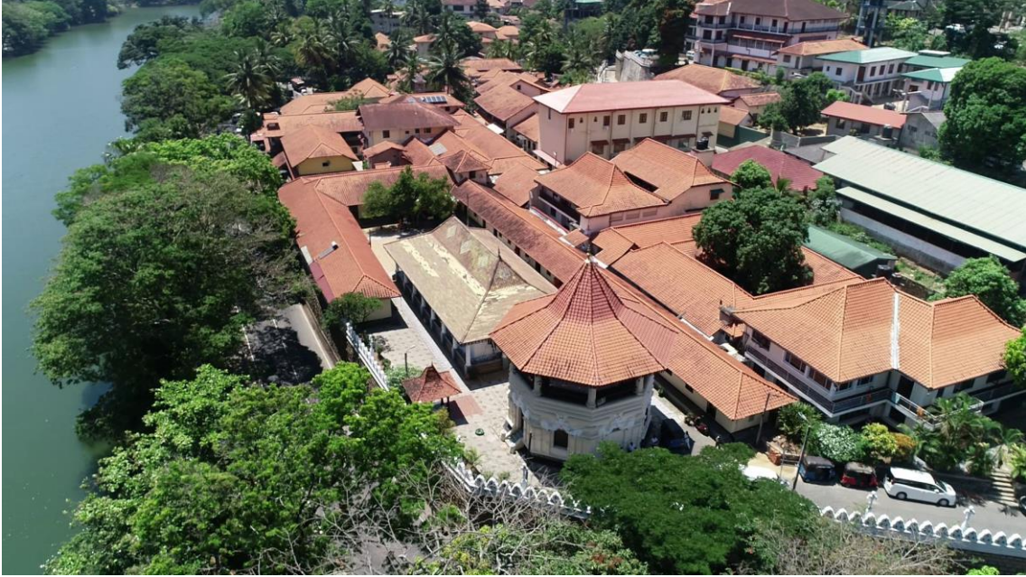
Şekil 7. Malwathu Maha Vihara'nın kuş bakışı görünümü.

merkezlerinden biridir. Dolayısıyla manastırın kökeninin Tayland (Siam) ile güçlü bağları bulunmaktadır. Manastır, Buda'nın Kutsal Dişi'nin muhafaza edildiği tapınak olan Sri Dalada Maligawa Tapınağı'na oldukça yakındır ve kutsal diş ile alakalı olarak yapılan tören ve ritüellerin icrasında bu manastırdaki keşişler büyük rol oynamaktadır. Malwathu manastırı günümüzde de faaliyetlerini devam ettirmektedir ve Theravada Budizm'i açısından önemli merkezlerden biridir.