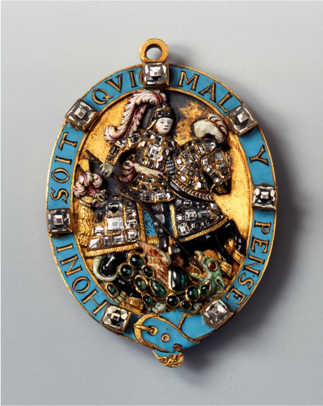
Fig.21 Yeşil Tonoz'daki Küçük George.