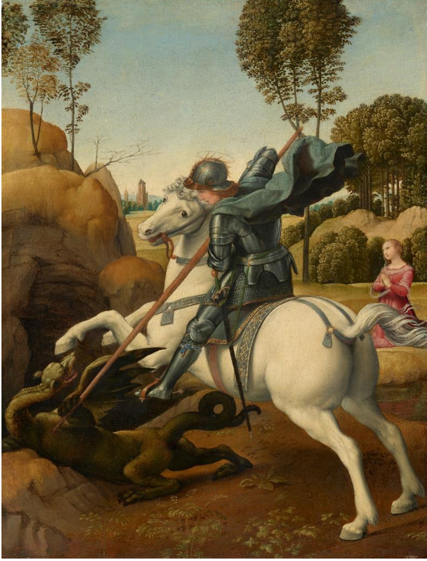
Fig.1 Raphael, Saint George and the Dragon , c. 1506.

Öte yandan, Raffaello'nun 1520 civarı tamamladığı ve günümüzde İtalya'daki Ulusal Antik Sanat Galerisi (Galleria Nazionale d'Arte Antica) koleksiyonunda yer alan La Fornarina adlı portredeki kadının sol kolunda, üzerine altın Raphael Vrbinas yazısının