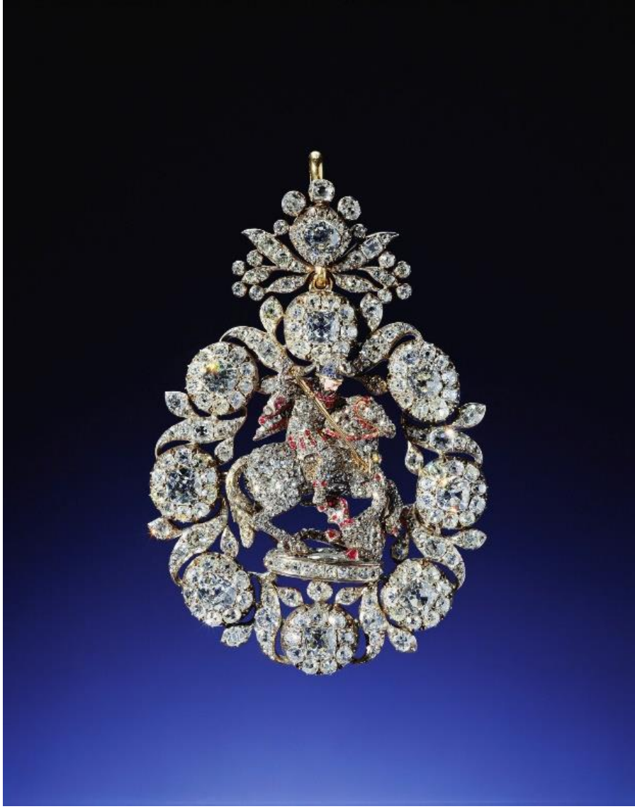
Fig.25 R & S Garrard, Lesser George, before 1750?.

Değınilecek son Kçük George, 1760-1829 yılları arasına tarihlenen bir rozettir. Bu rozet, 8 Şubat 1840 tarihinde Kralie Victoria tarafından Prens Albert'e dğnlerinden 2 gn nce hediye edilmiřtir. Bu rozetin iki olağnst zelliđi vardır. Bunlardan ilki bu rozetin bir tarafında sardoniks oyma Aziz George ve Ejderha yer alırken arka tarafında Aziz Andrew'un haını tuttuđu sardonisk oyma yer almaktadır. Yani bu rozet hem Dizbađı Niřanı'nın iřareti hem de Devedikeni Niřanı'nın iřareti olarak kullanılabilir.