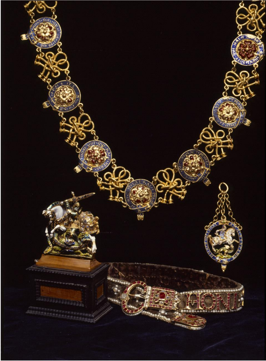
Fig.9 IV. Christian'a ait; üstte Kolye, solda Büyük George, altta Dizbağı, 1603. Sağda II. Frederik'e ait Küçük George, 1582.