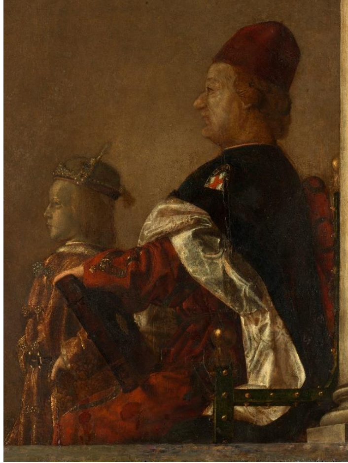
Fig.3 Joos van Wassenhove (active 1460-80), Federico da Montefeltro, Duke of Urbino (1422-1482), his son Guidobaldo (1472-1508), and others listening to a discourse, c. 1480

iki boyutlu dizbağları ile bezeli kan kırmızı bir surkota yer verilmiştir. 1480 gibi geç bir tarihte üzeri dizbağları ile bezeli surkota yer verilmesi tablonun dikkat çekici bir elementi olmuştur.