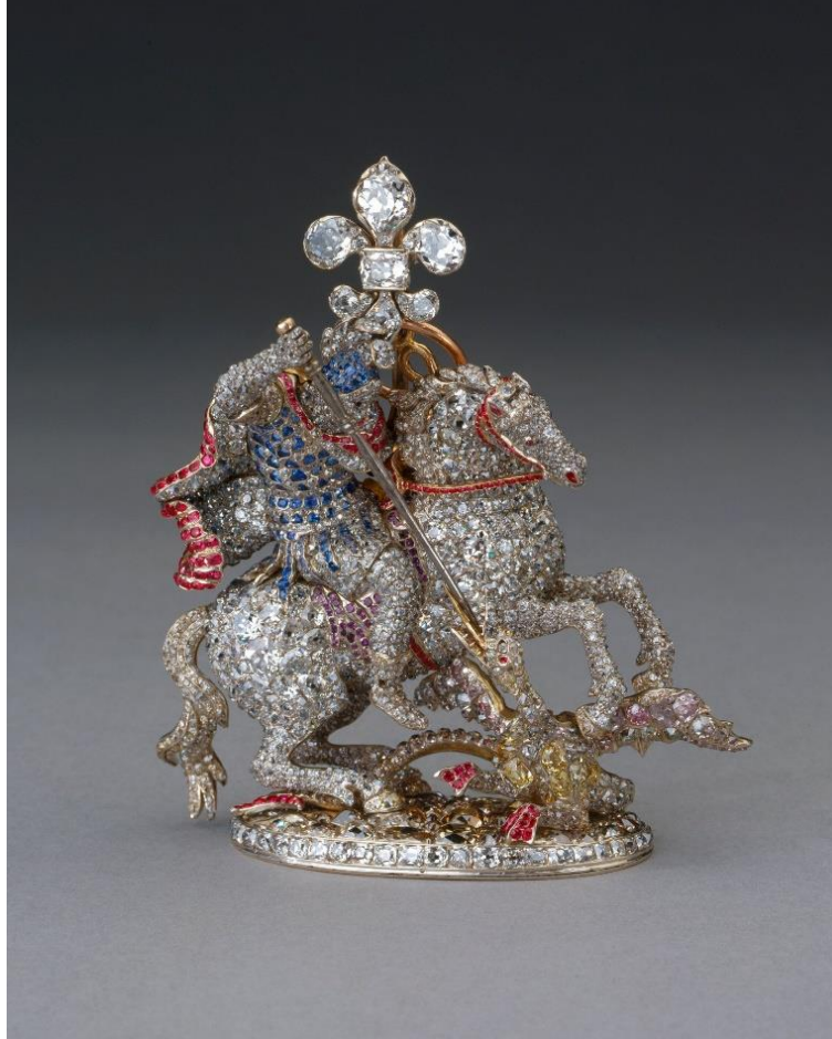
Fig.17 Great George, last quarter 18th century.

hükümdarlar daha hafif rozetleri tercih ettikleri için ilerleyen dönemde çok az giyilmiştir (Fig.17). 583