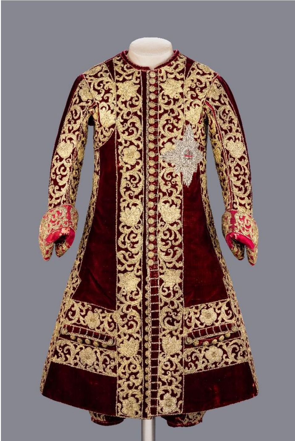
Fig.31 Devlet kıyafeti üzerinde yer alan yıldız.