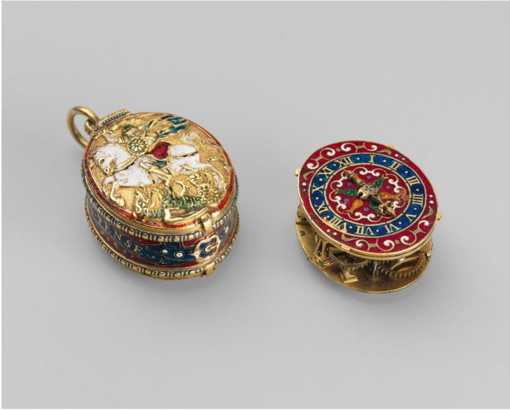
Fig.19 Movement by Nicholas Vallin, Watch in the form of a badge of the Order of the Garter, ca. 1600, Case and dial: gold, partly enameled; movement: gilded brass and steel, 1 7/16 x 15/16 in. (3.7 x 2.4 cm), The Metropolitan Museum of Art, New York, Gift of J. Pierpont Morgan, 1917, Eriřim Tarihi: 29 Ađustos 2024, https://www.metmuseum.org/art/collection/search/194067

İngiltere'deki en eski olduđu dűřtűnűlen Kűçük George ise The British Museum'da yer alan 1. Northampton Earlű'ne ait sette bulunan rozettir (Fig.20). İki taraflı olan bu Kűçük George'da arka plan boř bırakılmıř ve figűrleri dizbađının sarmaladıđı bir tasvir oluřturulmuřtur. Altından yapılan bu rozet minenin yanı sıra 4 elmas ve 14 yakut