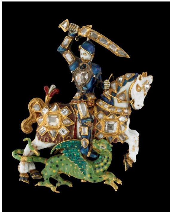
Fig.14 Great George of the Order of the Garter, 1628-1629.