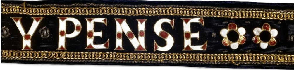
Fig.10 Garter of the Order of the Garter, 1628-1629.

zincirler ile çevrelenmiştir. Kötü Düşünen Utansın (Honi soit qui mal y pense) mottosunu oluşturan harfler ise altından yapılmıştır. Bu harfler, beyaz mine üzerine üçgen ve oval kırmızı mineli desenler ile süslenmiştir. Sözcüklerin kenarlarında yer alan güller ise benzer şekilde altından yapılmış ve kırmızı, beyaz mine ile süslenmiştir. Toka ve ağız kısmında ise elmaslar yer almaktadır (Fig.10). 544