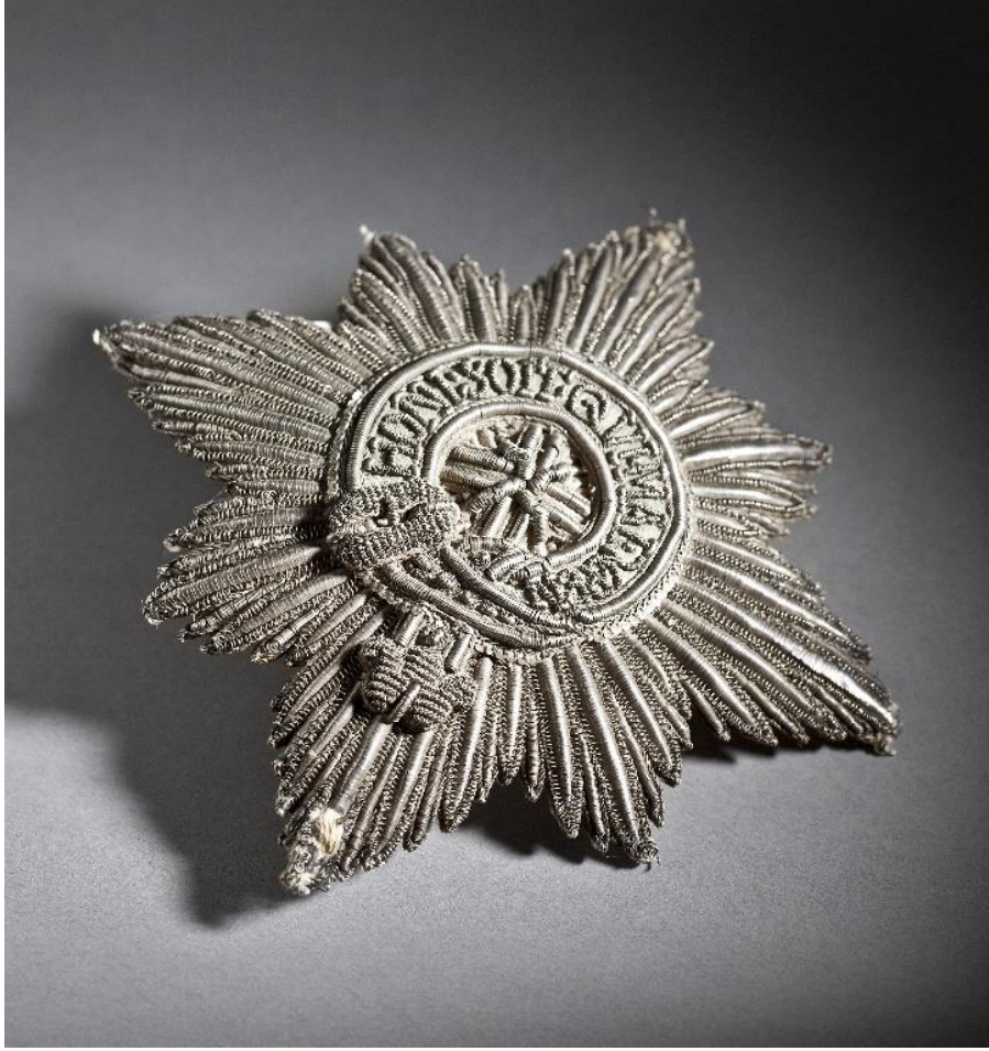
Fig.29 İsveç Kralı XI. Karl'ın yıldızı, 1668 (kırılmış).

Victoria ve Albert Müzesi'nde ise 1627-1700 arasına tarihlenen gümüş ipten işleme olarak yapılan ve 28.5 cm yüksekliğinde olan bir yıldız bulunmaktadır. Bu büyük yıldızda Kötü Düşünen Utansın (Honi soit qui mal y pense) mottosunu içeren dizbağı mavi ipekten yapılmışken Aziz George'un haçı kırmızı ipekten yapılmıştır. 627 Victoria ve Albert Müzesi'ndeki bir diğer yıldız ise II. James'in 1763 tarihli düğün kıyafeti üzerinde