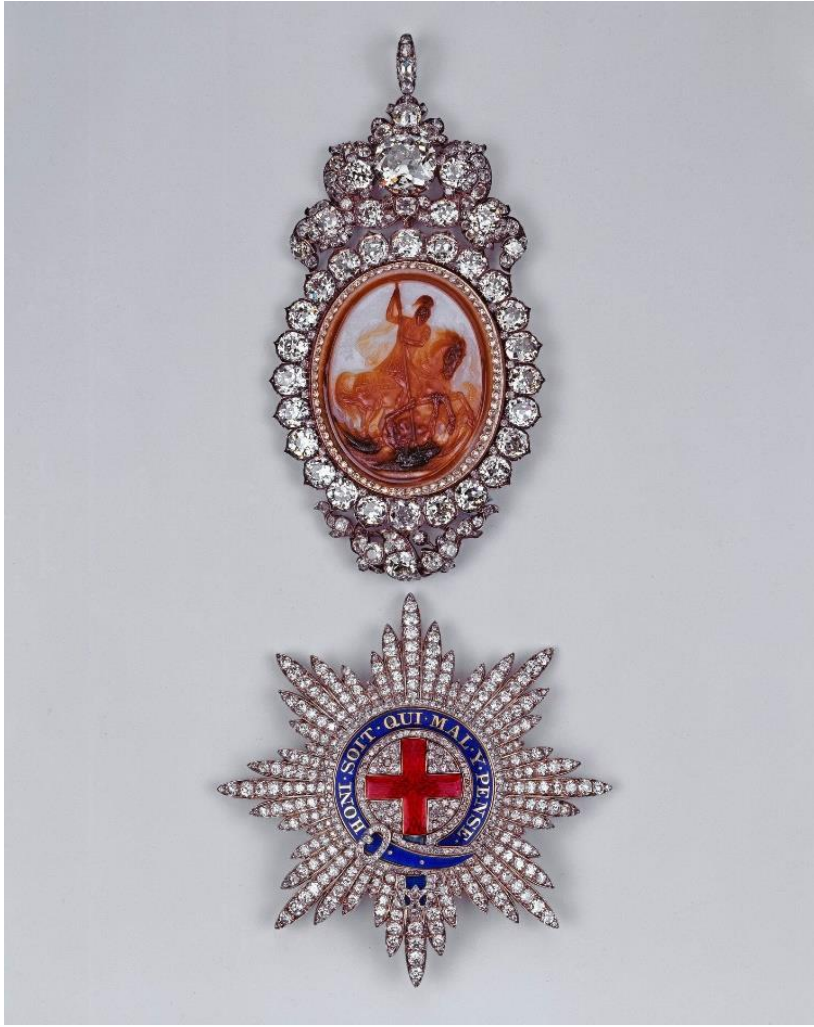
Fig.26 Rundell, Bridge & Co, Lesser George, c. 1760-1829.

Son olarak, Aziz George'un ejderhayı öldürmesini tasvir eden değerli metallere yapılmış değerli taşlar ve süslemeler içeren mücevherler, Dizbağı Nişanı'nın işareti Büyük George ve Küçük George ile karıştırılmamalıdır. Bunlara: The British Museum'daki Waddesdon Mirası (Waddesdon Bequest) adlı koleksiyonda yer alan ve Ortaçağ mücevher sanatının en önemli örnekleri arasında yer alan, XVI. yüzyıldan değerli