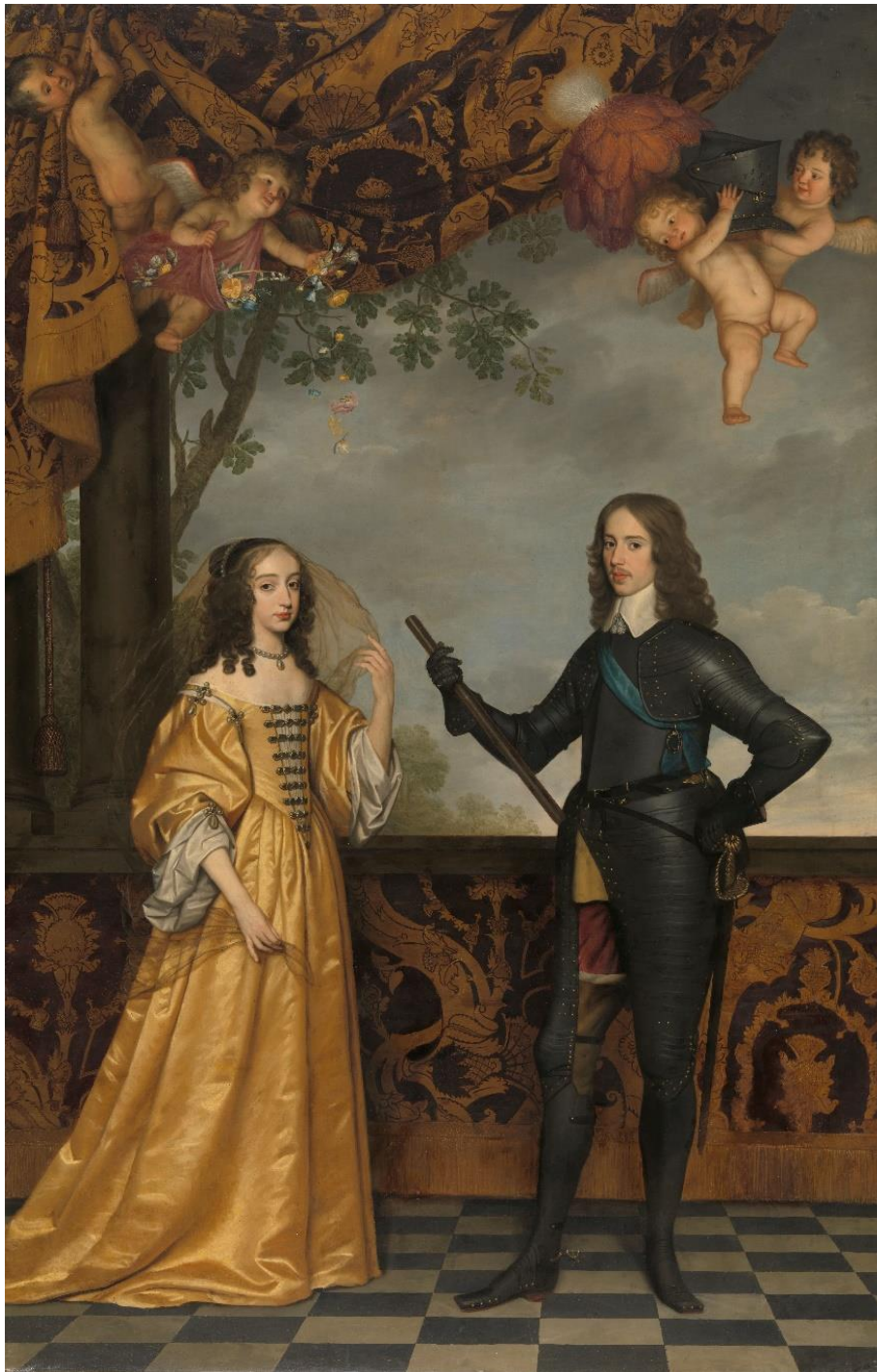
Fig.28 Gerard van Honthorst, Portrait of Willem II (1626-1650), Prince of Orange, and his Wife Mary Stuart (1631-1660), 1647.