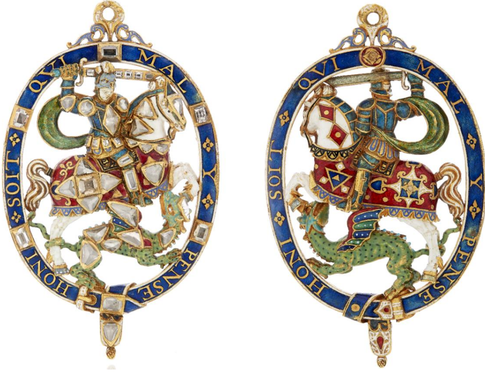
Fig.18 IV. Christian'a ait Küçük George'un önü ve arkası, 1603.

Küçük George'lar arasında muhtemelen en ilginç olanı Metropolitan Sanat Müzesi'nde yer alan cep saati formundaki bir Küçük George'dur (Fig.19). 1600 yılı civarına tarihlenen saatin mekanizmasında Nicholas Vallin'in adı vardır. Kasası altın kaplama pirinçten olan bu saatin arka kapağında Aziz George ve Ejderha mine süslemeleri ile tasvir edilmiştir. Saatin kenar kısmını ise üzerinde Kötü Düşünen Utansın (Honi soit qui mal y pense) mottosunun yer aldığı mavi mineli bir dizbağı sarmalamaktadır. 591