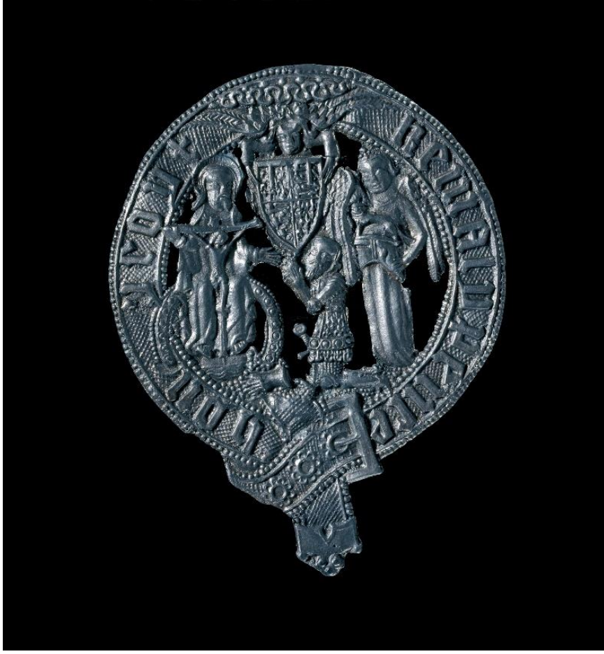
Fig.2 Black Prince, late 14th century.

Başlangıçta bu iki boyutlu dizbağı tasarımı şövalyeler resmi kıyafetlerinin üzerine işlenmiş olarak kullanılmaktayken daha sonra şövalyeler üç boyutlu tokalı dizbağını sol dizlerinin altına takmaya başladılar. Sol dizin altına takılan ve nişanın mottosunu taşıyan üç boyutlu dizbağına en eski örnek Dizbağı Şövalyesi Sör Simon de Felbrigge'e ait 1416 tarihli anıtsal pirinç levhada yer almaktadır. 211 Sör Simon, II. Richard'ın sancağını taşımış ve Agincourt Muharebesi'nde savaşmıştır. Günümüze Sör Simon dahil sadece 6 Dizbağı