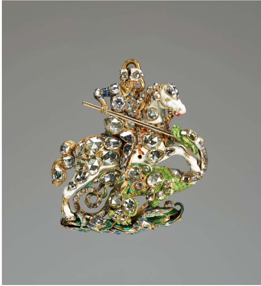
Fig.15 Sir Robert Vyner (1631-88), Garter Collar and Great George, George 1661; collar c. 1685.

Bir diğerk Büyük George, Dresden Devlet Sanat Koleksiyonları (Staatliche Kunstsammlungen Dresden- SKD) içerisinde yer almaktadır ve Dresden Kalesi'ndeki Yeşil Tonoz (Grünes Gewölbe) adı verilen müzede bulunmaktadır. 1692/3 579 yılında