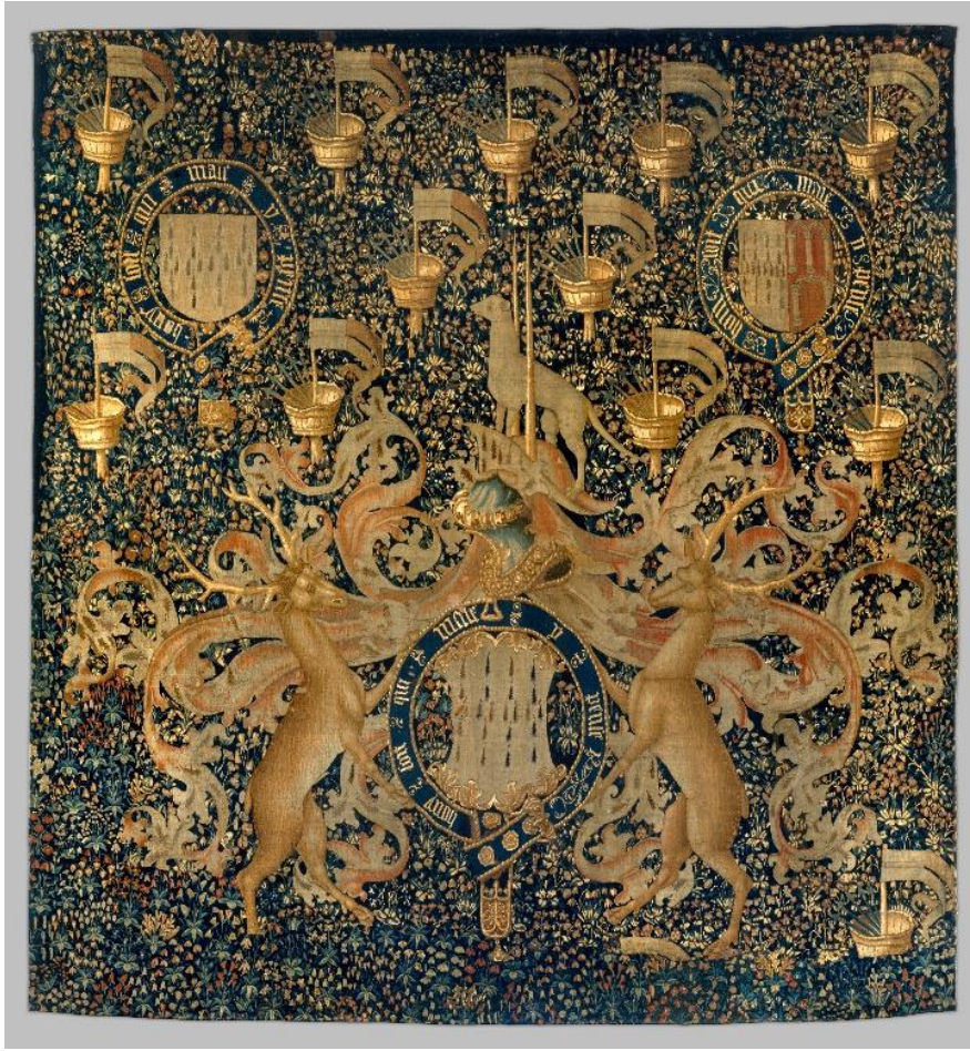
Fig.4 South Netherlandish, Tapestry with Armorial Bearings and Badges of John, Lord Dynham, ca. 1488–1501, Wool warp; wool wefts with a few silk wefts, 152 x 145 in. (386.1 x 368.3 cm), The Metropolitan Museum of Art, New York, The Cloisters Collection, 1960, Eriřim Tarihi: 27 Ağustos 2024, https://www.metmuseum.org/art/collection/search/468561

Geçtiğimiz kısımda halihazırda iki tabloda karşımıza çıkan Urbino Düğü Federico da Montefeltro tarafından yaptırılan ve günümüzde New York'taki Metropolitan Sanat Müzesi'nde bulunan Gubbio'daki Düğlük Sarayı'ndan Studiolo (Studiolo from the Ducal Palace in Gubbio) adlı esere değinilecektir (Fig.5). Studiolo, İtalyancada küçük stüdyo anlamına gelmektedir ve genellikle fazlasıyla dekore edilmiş okumaya, çalışmaya ve