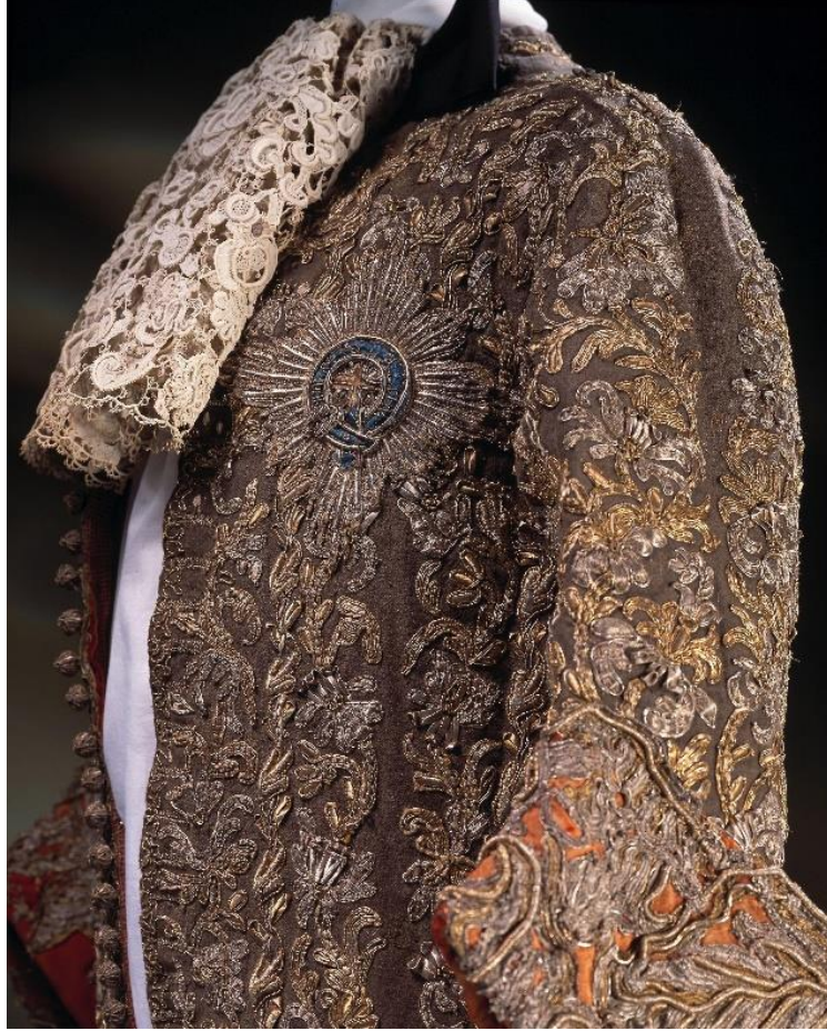
Fig.30 Wedding Suit, 1673.

yer alan yıldızdır (Fig.30). 628 Kıyafetin ceketinin sol göğüs tarafında yer alan bu yıldız ilk bahsedilen yıldız tasarım olarak benzerdir ancak boyutu küçüktür. Ceketin 93 cm olan uzunluğu göz önüne alındığında, yıldızın yüksekliğinin yaklaşık olarak 12 cm kadar olduğu anlaşılmaktadır.