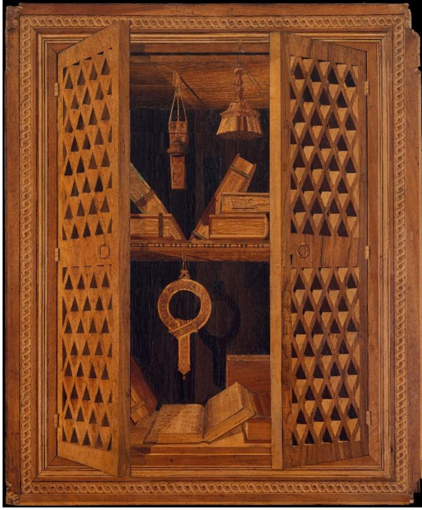
Fig.5 Various artists/makers, Studiolo from the Ducal Palace in Gubbio, ca. 1478–82, Walnut, beech, rosewood, oak and fruitwoods in walnut base, H. 15 ft. 10 15/16 in. (485 cm), W. 16 ft. 11 15/16 in. (518 cm), D. 12 ft. 7 3/16 in. (384 cm), The Metropolitan Museum of Art, New York, Rogers Fund, 1939, Eriřim Tarihi: 25 Haziran 2024, https://www.metmuseum.org/art/collection/search/198556

Arma üzerinde yer alan iki boyutlu bir dizbađına da deđinilecek olunursa, III. Edward'ın heraldik etkisi Dizbađı Niřanı ile sınırlı kalmamıřtı ve Kral, kraliyet armasında da deđiřiklikler yapmıřtı. 1350'li yıllarda III. Edward, dizbađının armayı sarması