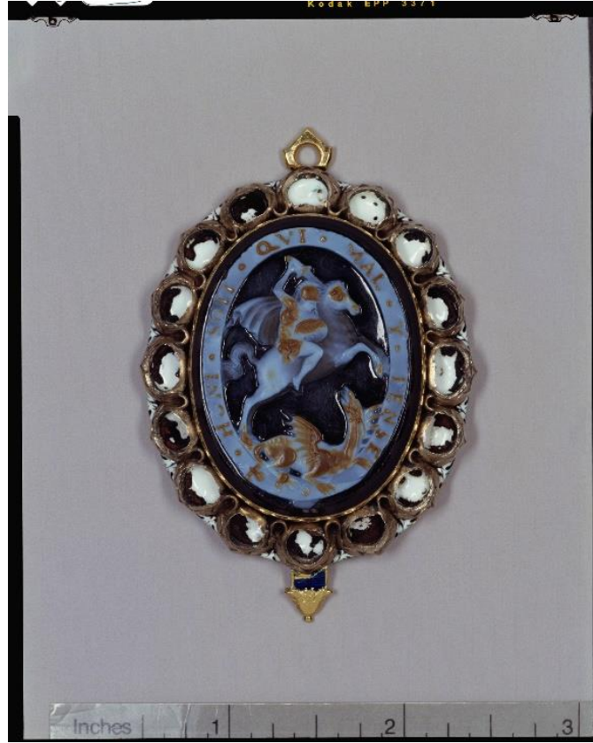
Fig.22 The Juxon George, second half 17th century.

XVII. yüzyıldan diğer bir Küçük George, “Stuart George” olarak adlandırılan ve 1661 civarına tarihlenen rozettir (Fig.23). Altın bu rozette oniks oyma kameo figürleri mineli dizbağı sarmaktadır. Rozetin arkasında ise mineli Aziz George ve Ejderha figürleri ile çevrelerinde çok dikkat çekici mineli çiçek tasvirlerine yer verilmiştir. 599