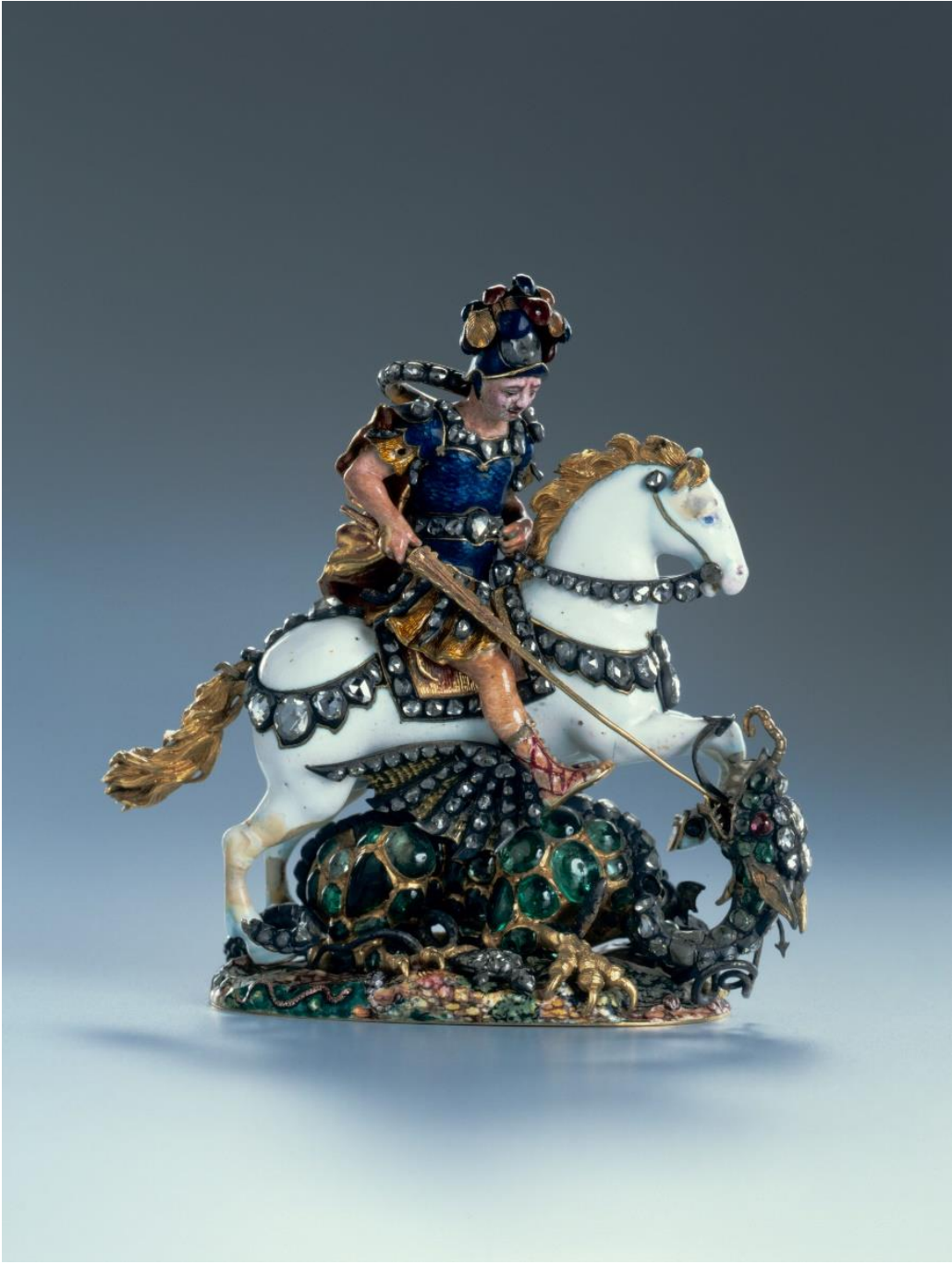
Fig.16 Johann Melchior Dinglinger, Büyük George, 1692-1694 arası.