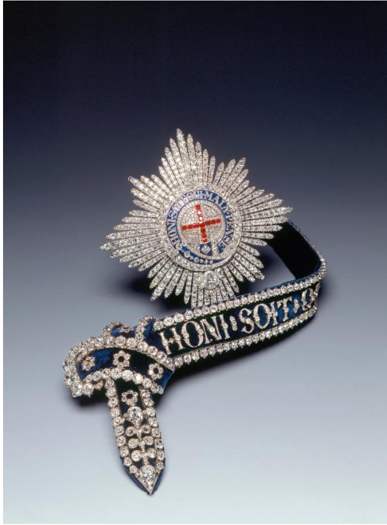
Fig.32 Garter star, second half 18th century.