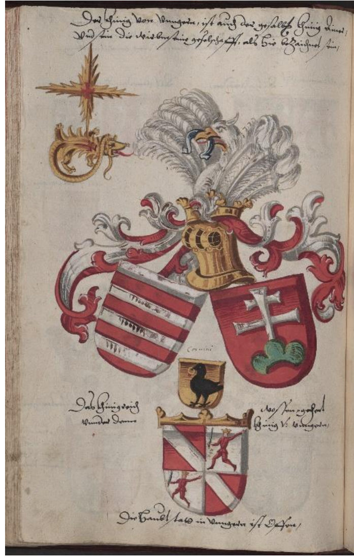
Fig.8 Macaristan Kralı'nın arması ve krestin sol tarafında yer alan Ejderha Nişanı'nın sembolü. Grünenberg Arma Kitabı , Cgm 9210

Dizbağı Nişanı'nın erken dönem fiziki işaretinden ise çok azı günümüze kalabilmiştir. Öncelikle, günümüze kalan en eski bilinen fiziki dizbağı, VII. Henry döneminde 1489 yılında nişana seçilen Kutsal Roma İmparatoru I. Maximilian'a verilen dizbağıdır. 535 Günümüzde İngiltere'de Cambridgeshire'daki Anglesey Abbey'de bulunan