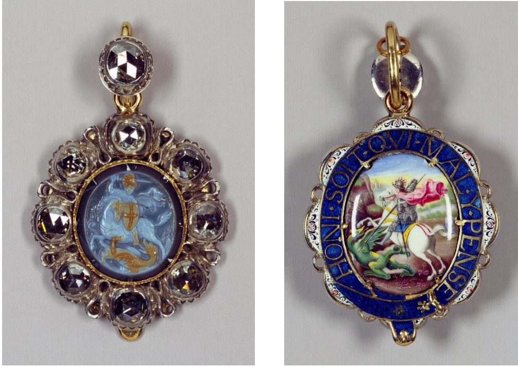
Fig.24 After Raphael (1483-1520), Lesser George known as 'The Stafford George', last quarter 17th century.

Kraliyet Koleksiyonu'ndan son olarak 2 adet Küçük George örneğine yer verilecektir. Bu 2 rozet de oldukça zengin bir şekilde değerli değerli taşlarla süslenmiştir ve Küçük George'lar arasında en dikkat çekici örneklerden bazıları olmuşlardır. İlk olarak, muhtemelen 1750 öncesinde II. George için yapılan rozet tamamen elmas ve değerli taşlarla kaplanmıştır. Aziz George'un ejderhanın ağzına mızrakla saldırırken ki ifadesi oldukça gerçekçi tasvir edilmiştir. Aziz George'un yüz kısmı hariç figürler neredeyse tamamen elmasla kaplanmışken, Aziz George'un miğferi safir; pelerininin bir kısmı, kıyafetinin etek kısmının şeritleri ve atın koşum takımı ile ejderhanın bazı parçaları