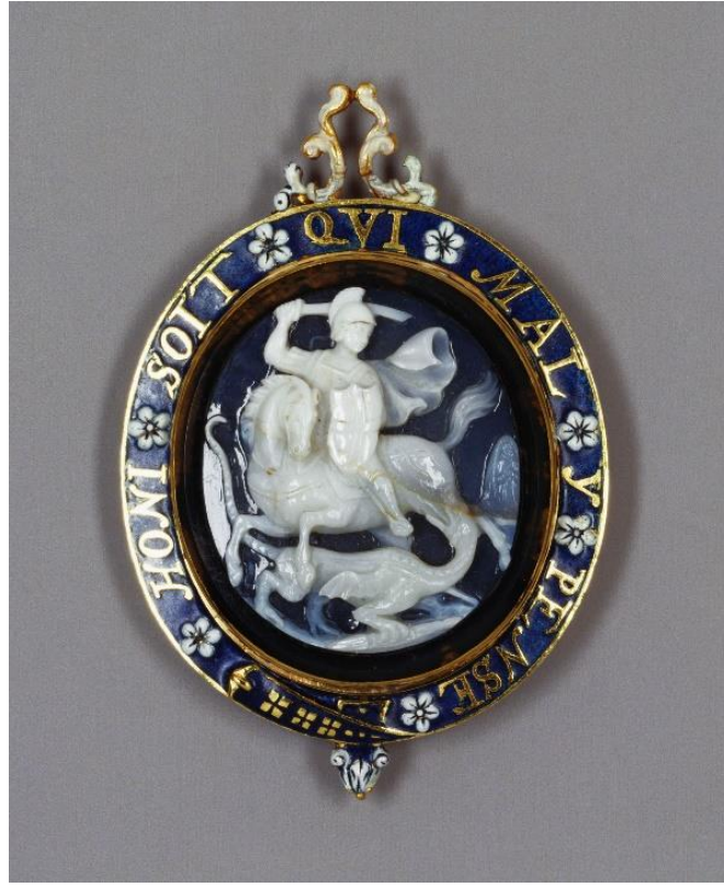
Fig.23 The Stuart George, c. 1661.

“Strafford George” olarak adlandırılan ve XVII. yüzyılın son çeyreğinden kalan Küçük George ise süsleme bakımından çok zengindir. Altın ve gümüşten bu rozetin bir tarafındaki oniks oyma cameo figürlerin olduğu kısmı büyük elmaslar sarmaktadır. Rozetin diğer tarafında ise Aziz George kısmında değinilen Raffaello’nun 1505 yılı civarına tarihlenen Aziz George tablosunun bir mineli minyatürü yer almaktadır. Bu minyatürü yine mineli bir dizbağı sarmaktadır (Fig.24). 600