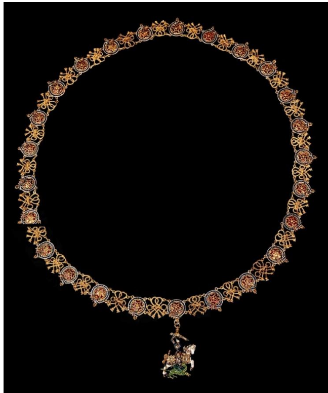
Fig.13 Collar of the Order of the Garter, 1628-1629.