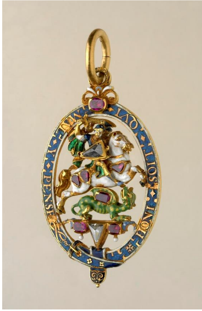
Fig.20 Order of the Garter Badge, ca. 1640.

Dresden Kalesi'ndeki Yeşil Tonoz'daki daha önceki bölümde işlenen Büyük George'un yanında hem Dizbağı Nişanı'nı Wettin Hanedanı'ndan 594 1669 yılında alan ilk