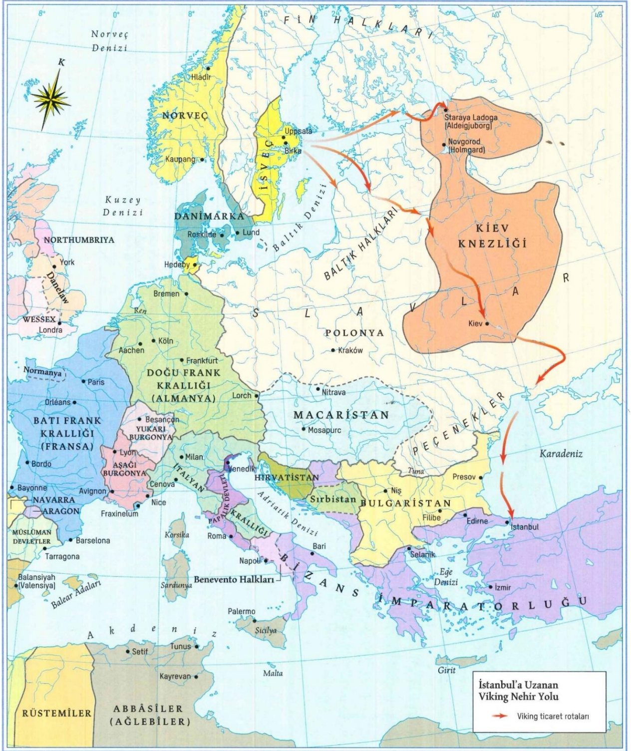
Harita 1. Viking ve Slavların İstanbula Uzanan Nehir Yolu 528