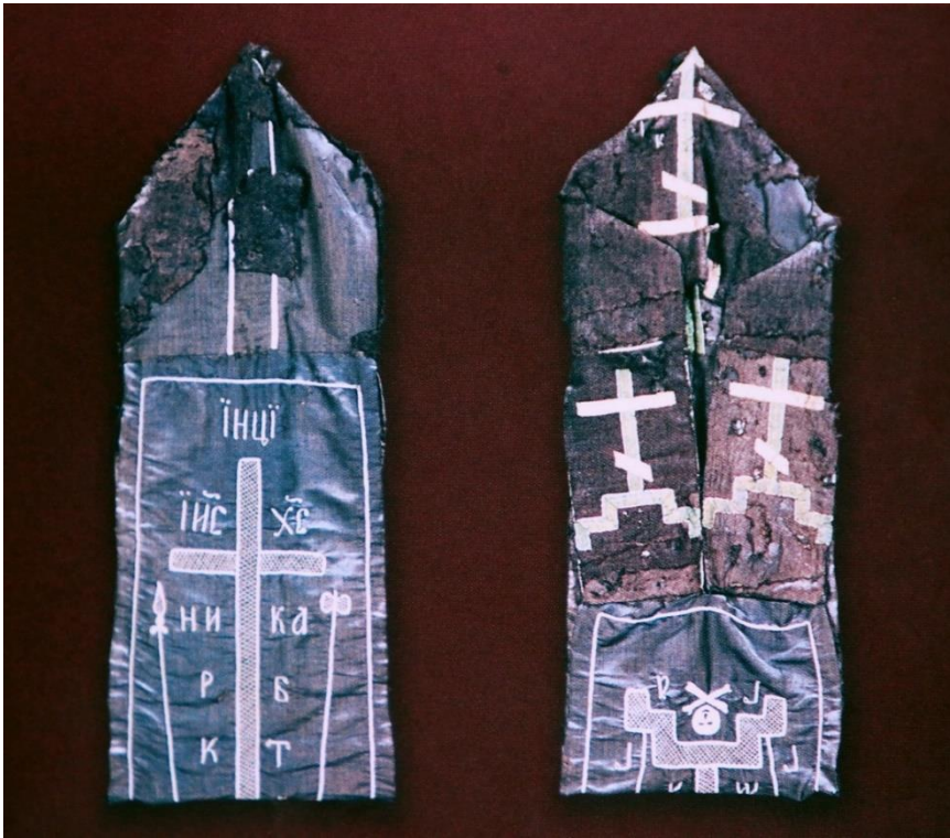
Sergiy Radonejskiy'nin Büyük Shiması 534