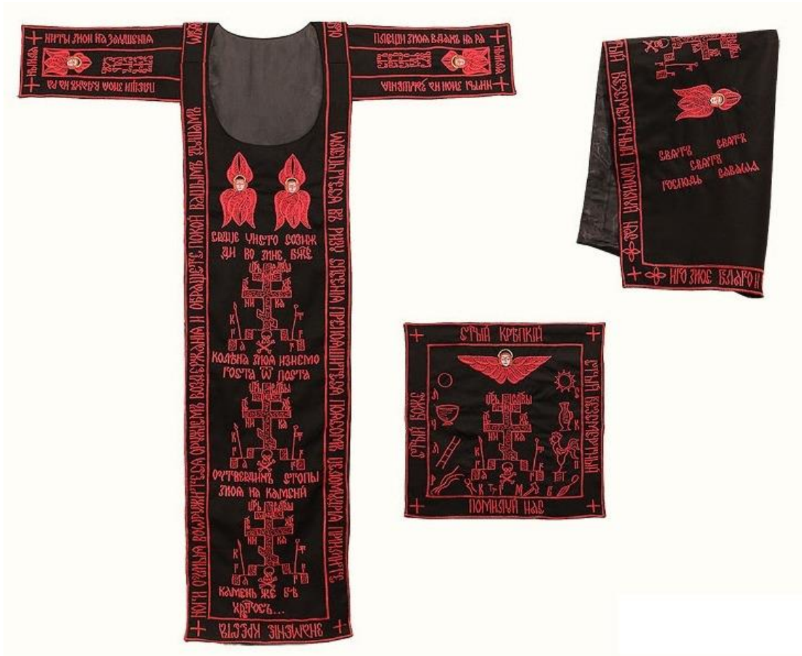
Resim 7,8,9,10. Büyük Shima Elbiseleri