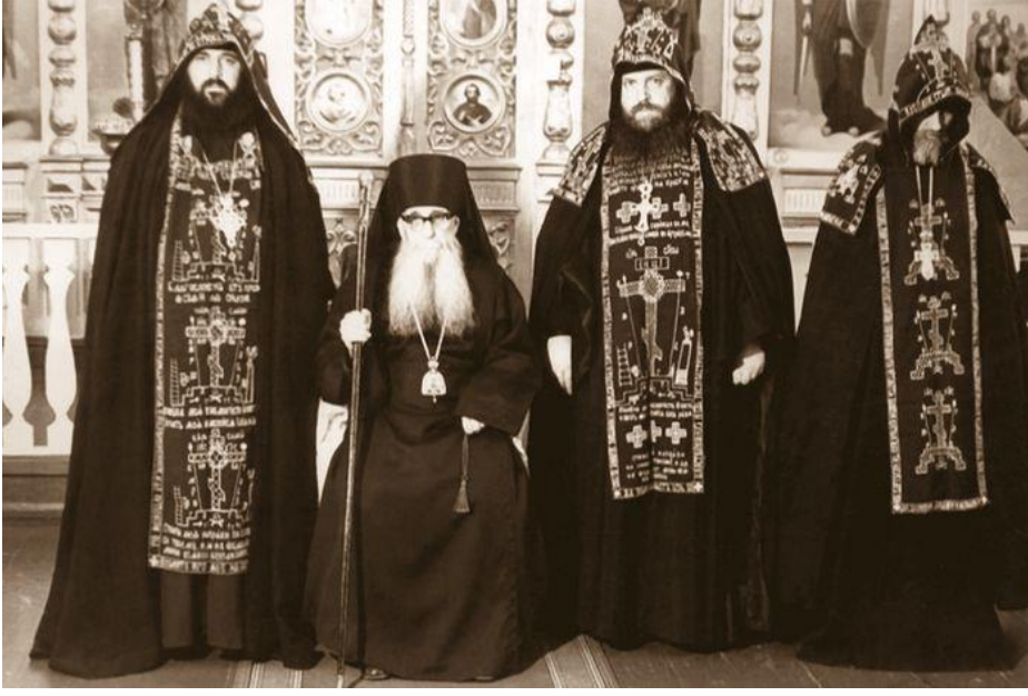
Resim 11,12,13,14,15. Büyük Shima Giymiş Keşişler