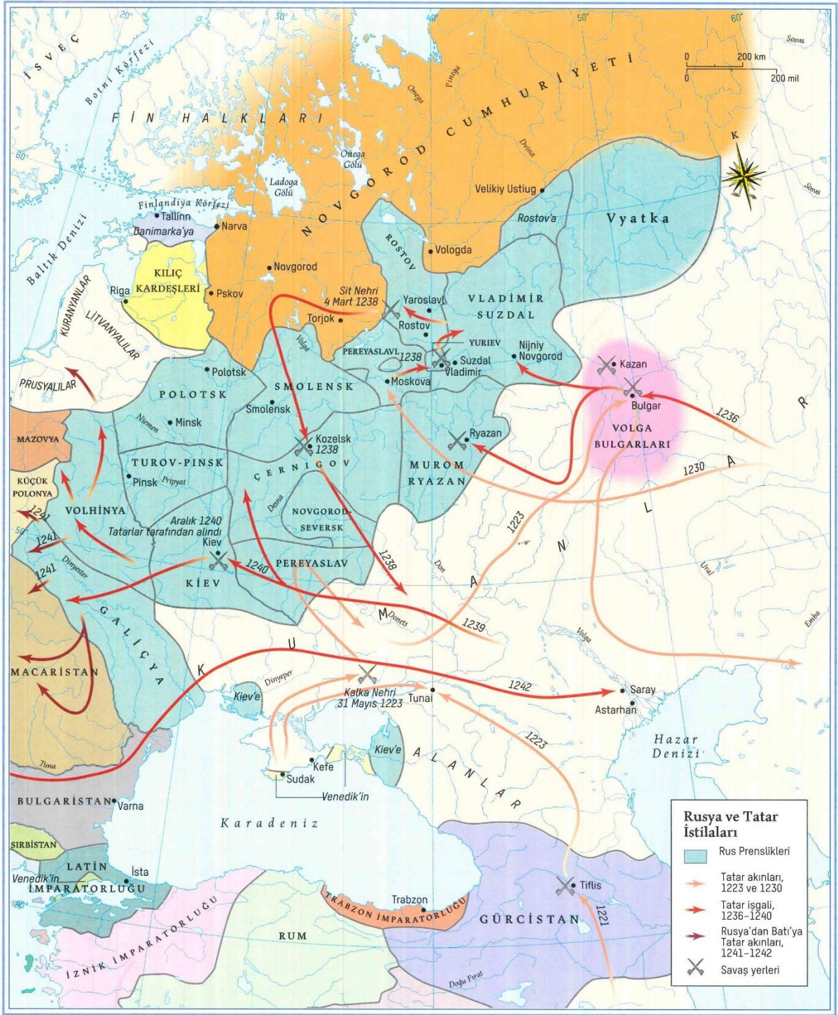
Harita 3. Rusya ve Tatar İstilaları 530