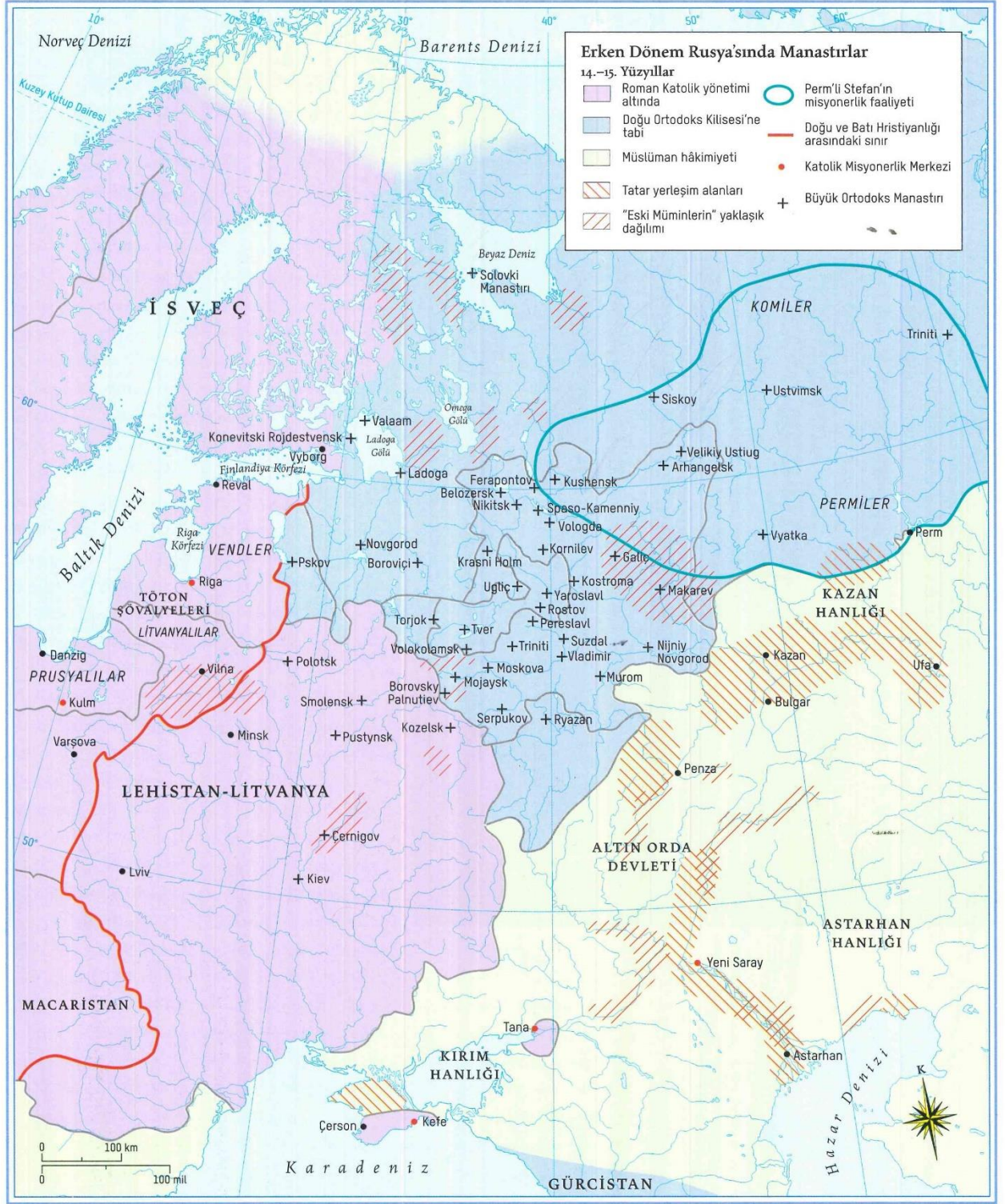
Harita 5. Erken Dönem Rus Ortodoks Manastırları. 532