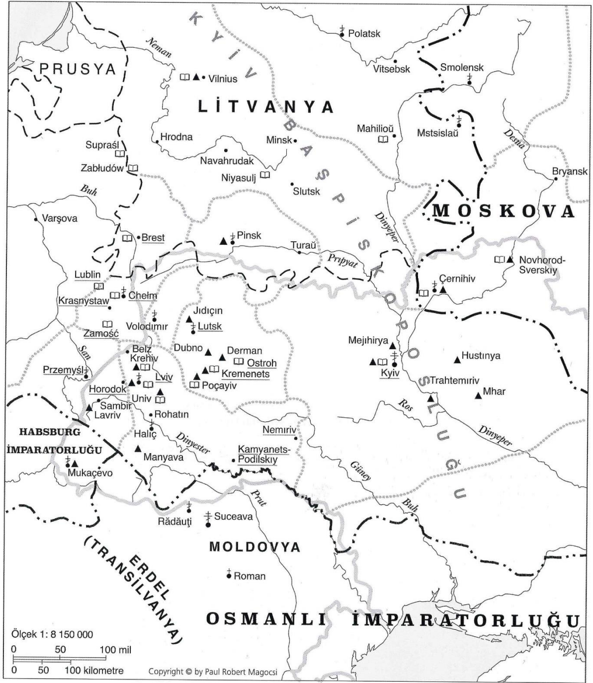
Harita 6. 16. Yüzyılda Rus Ortodoks Kiliseleri ve Manastırları 533