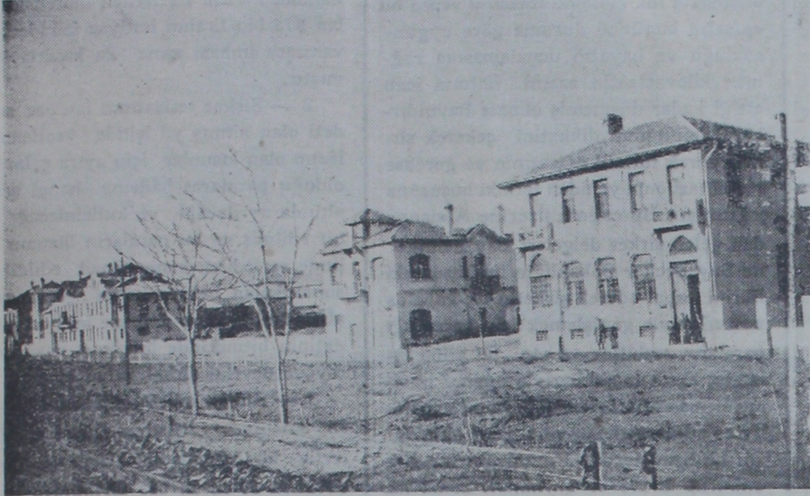
Polatlı'da Bankalar caddesi

(5) sınıfa çıkarılmıştır. Geçen yıl (360) okuru bulunan okulda bu yıl (400) okulu vardır. Talebe sayısı aşağı yukarı her yıl (50) kadar fazlalaşmakta olduğundan okula bugünkü ihtiyacı bile karşılamamaktadır. Aynı zamanda da Maarif memurluğu vazifesini yap-