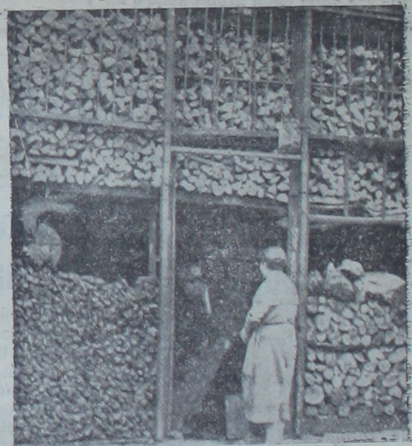
Bir odun ve kömür dükkanı

Kömüre gelince: bu sene mangal kömürü çok pahalıdır. Şimendifer kömürü toptan 7 kuruşla verilmektedir. Bu kömürün şimdiden bu kadar pahalı olmasına sebep sahillere yakın ormanların gittikçe azalmasıdır. Bunun için nakliyat ve amele parası çok tutmaktadır. Bundan