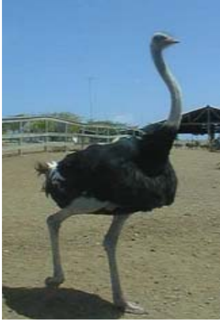
Şekil 1. Erkek Devekuşu

Afrika'nın batısında ve güneyinde yaşayan yerli bir ırktır. Erkek devekuşlarının bacak, but ve boyun derileri mavi-gri renktedir. Sadece çiftleşme döneminde bacakların ön tarafları kırmızı renk almaktadır. Ergin erkeklerin tüyleri siyah- beyaz iken dişilerinin tüyleri açık gri den kahverengi griye kadar değişmektedir (Jefferey, 2005).