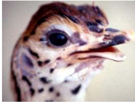
řekil 3. Folik asit yetersizliđinde grlen alt ene geliřim bozukluđu (Anonim, 2005d).

Vitamin B yetersizliđi; bu vitamin eksikliđinde epitelyal dokularda hasar ve tylerde geriye dođru bklmeler, ađız ve gagada hiperkeratozis geliřmiřtir. Riboflavin yetersizliđinde tm evcil kanatlılarda grlen ‘ayak parmaklarının geriye paralizi’ geliřmektedir. Ayrıca devekuřlarında alt bacaklarda ki karakteristik neural paralizinde nedenleri arasındadır. Yine biotin eksikliđinde bacaklarda gçszlk, tendolarda kayma řekillenmiřtir. Pantotenik asit yetersizliđinde gaga, gz ve kanat derilerinde yangı meydana gelmektedir. Niacin eksikliđinde, dřk kalitede yumurtadan ıkma, civcivlerde yetersiz byme meydana gelmiřtir. Folik asit yetersizliđinde, tibio-tarsal kemiklerde eđilme, alt enede geliřim bozukluđu ve kısa ene geliřmektedir (řekil 3). Ayrıca ayak parmaklarının yapıřık olması, dřk yumurtadan ıkım folikasit eksikliđi sonucu oluřan bozukluklardır (Cooper ve Horbanczuk, 2005).