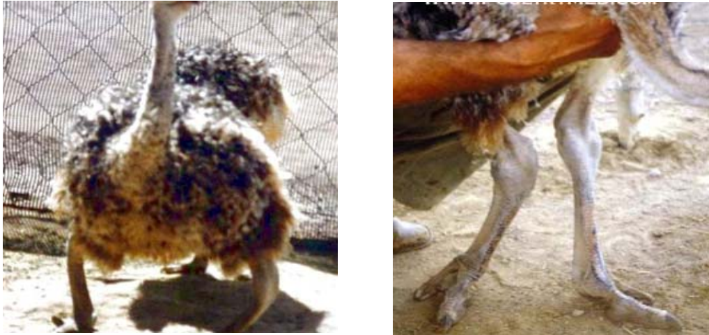
Şekil 4. Vitamin D 3 noksanlığına bağlı kemiklerde deformite ve raşitizm (Anonim 2005d).

Jensen ve ark. (1992) devekuşu rasyonlarında kalsiyumun % 2-2.5, fosforun da %1.0-1.5 oranında bulunması halinde bu elemente bağlı eksikliğin giderileceğini belirtmişlerdir.