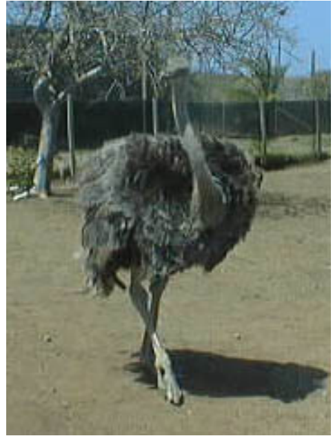
Şekil 2. Dişi Devekuşu