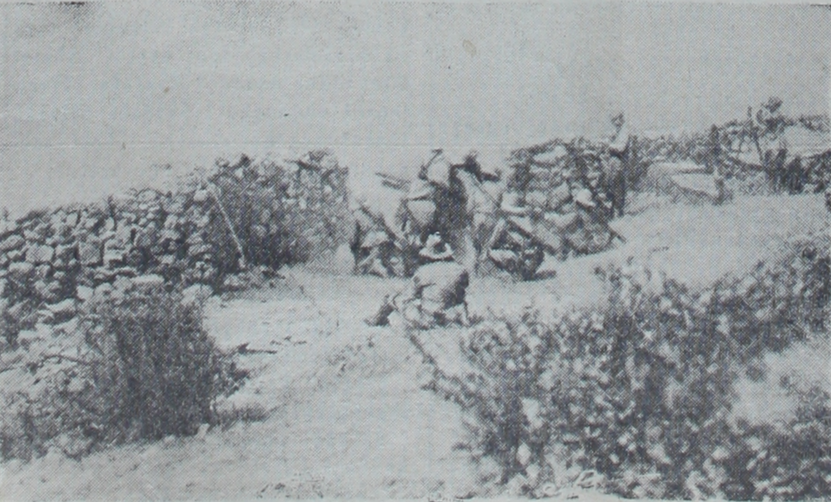
Amba - Alagi surlarında italyan topları

muharip cüzütam olmaktan çıkmış addedilebilir. Adisababa yolu şim-di ancak Dessie'de toplanmakta olan kuvvetler ve Dessie karargâ-hından şimalde doğru gönderilen kıtalar tarafından korunmaktadır. Söylendiğine göre imparator, en mümtaz habes kıtalarının ve im-paratorluk muhafaza kuvvetlerinin (Sonu 6. inci sayfada)