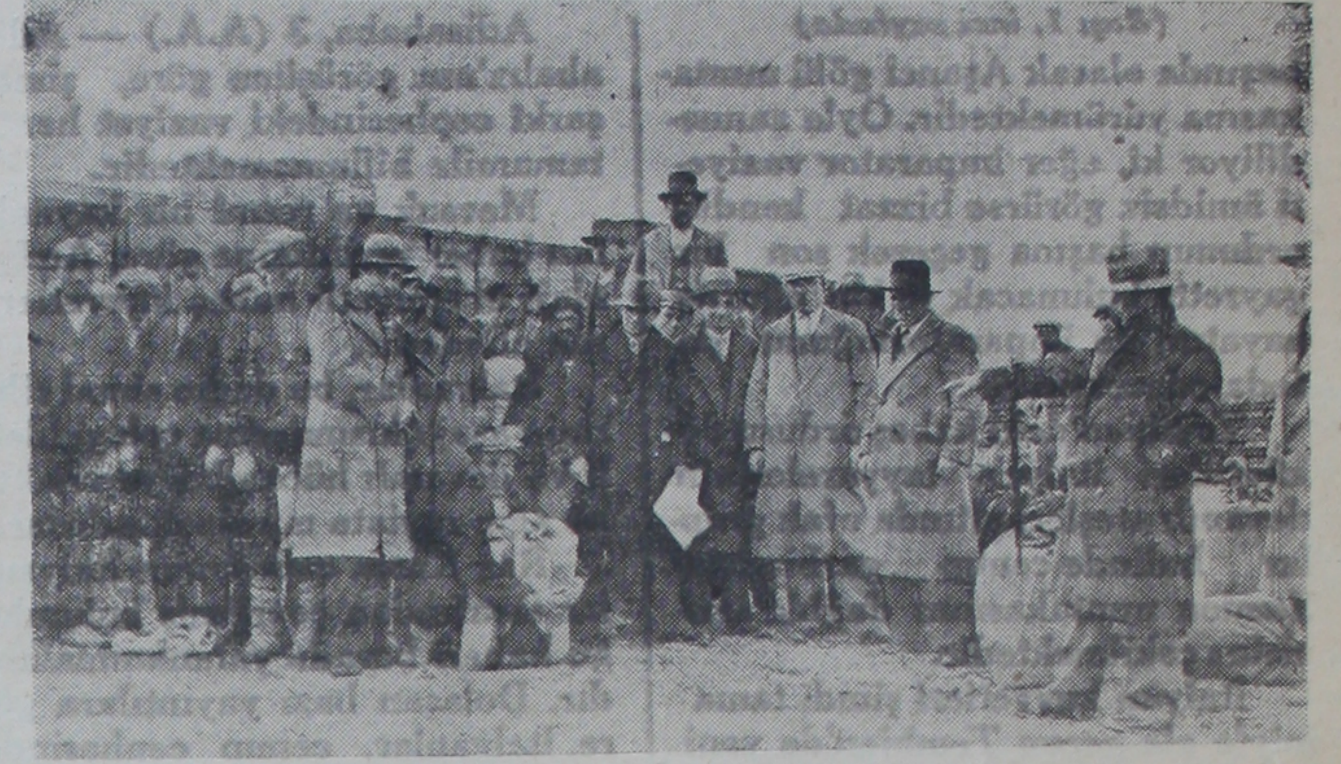
Köylülerimiz buğdaylarını aldıktan sonra