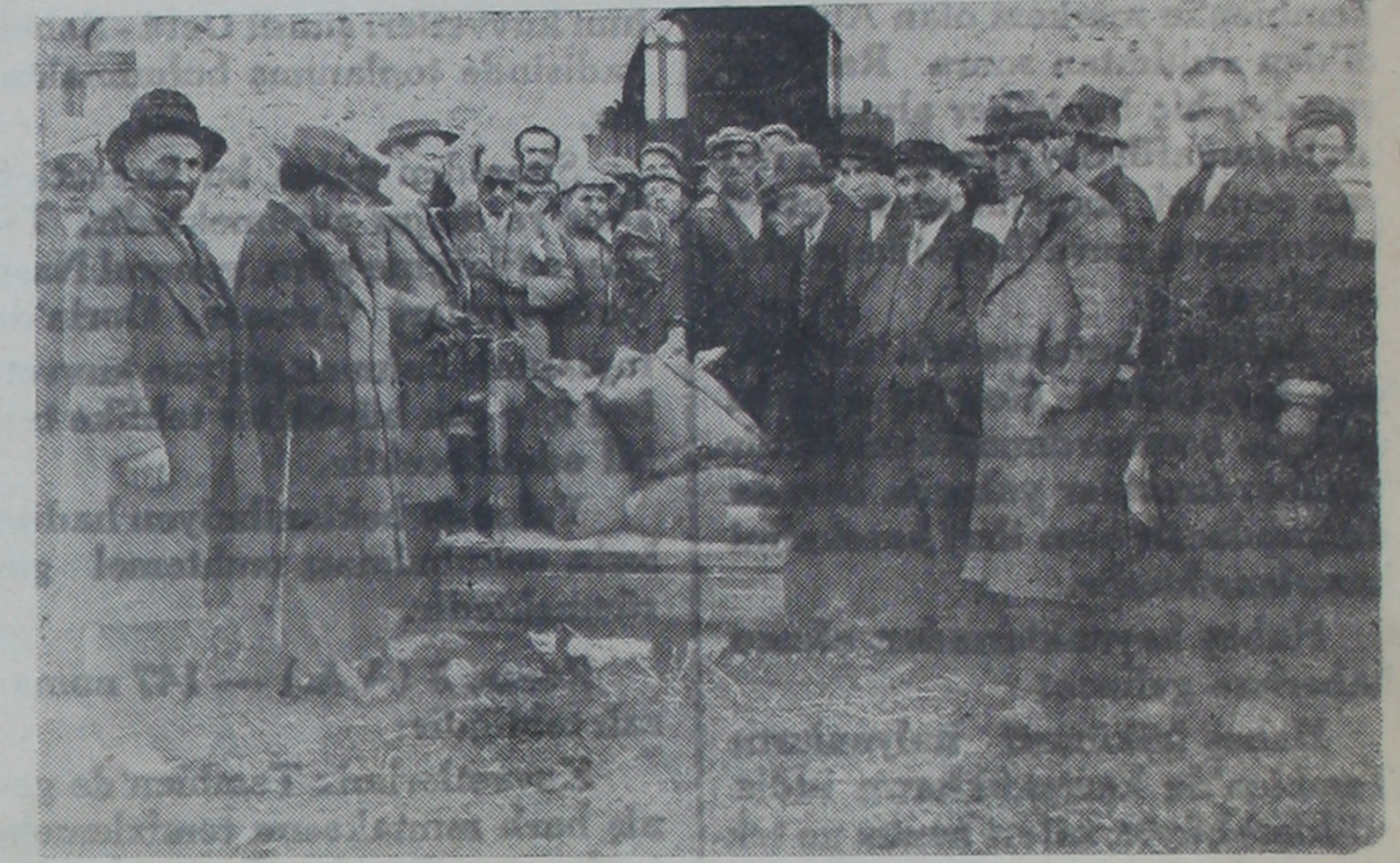
Çerkeşte köylülere dağıtılan buğdaylar tartılırken

Çerkeş kazası Çankırı valiliğine bağlı İrmak-Filyos hattı üzerine düşen şirin bir kasabadır. 935 ürünlerinin azlığı yüzünden sıkıntıya düşen bu muhitteki vatandaşların hiç hatırlarından bile geçmemiş iken kavuşmuş oldukları ve 935 yılının mutlu sayılan son teşrin ayında işletmeye açılan İrmak-Filyos tirenini (700) ton buğdayı ulaştırmakla cumuriyetin elindeki bereketten faydalanmış ve 180 köyde (4676) çiftçi ailesi sıkıntıdan kurtulmuşlardır. Başta kaymakam, ziraat memuru olduğu halde Ziraat Bankasının çalışkan memurları; başvuran köylünün işini aynı günde başararak o gün köyüne memnuniyetle ulaştırıya muvaffak olmuşlardır. Dağıtma işinde bir günde 25 köyhalkının işi bitirilmiştir. Çerkeş istasyonunda vağonlardan buğday boşaltılırken ve çiftçinin senetleri yazılırken ve anbar itihaz edilen caminin içinde kapısının önünde buğday dağıtılırken alınan fotoğrafları aşağıya koyuyoruz.