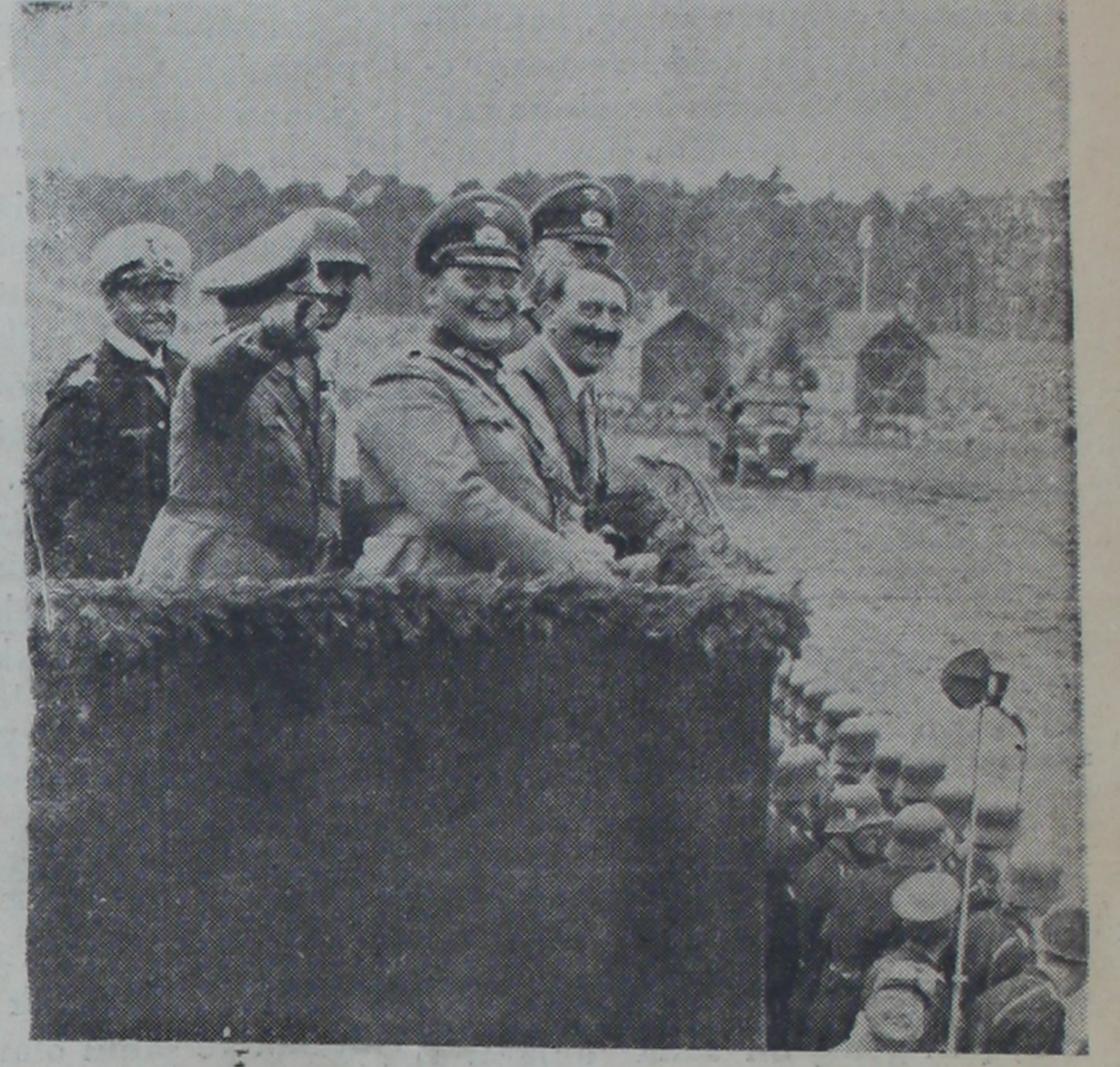
İngiliz - alman deniz anlaşmasını görüşen alman devlet şefleri

İyi bir yer-den haber alın-dığına göre, B Hitler, bilhassa İngiltere ile