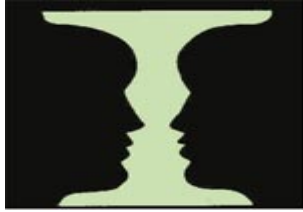
Őekil 3- Őekil-Zemin İliřkisi

İnsanın günlük yařamı, kiřinin kendi algılaması içinde yer alır. Cüceloęlu Őekil-zemin iliřkisini řu resimle aıklar: (Cüceloęlu, 2008:28- 29)