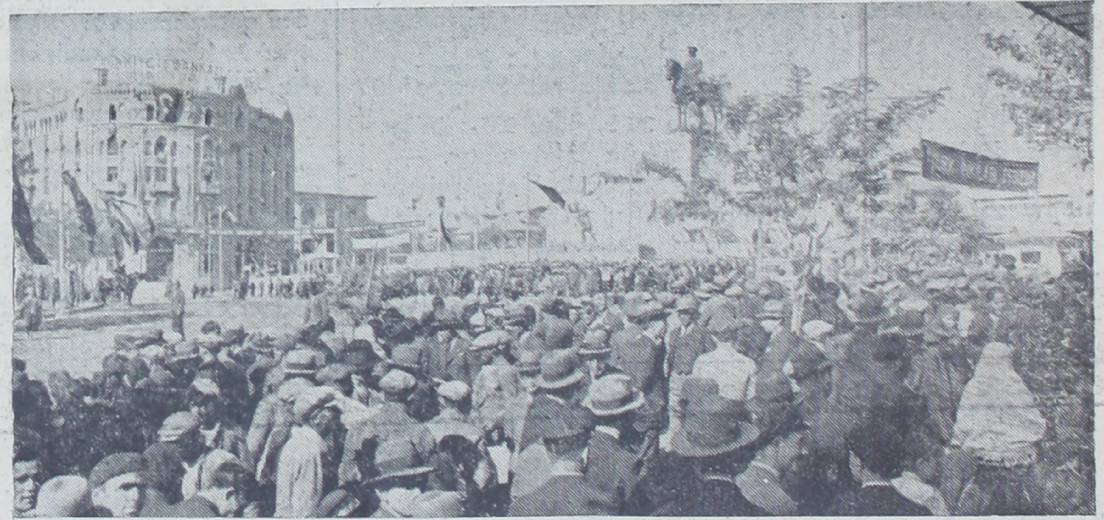
Atatürk'ü dinleyen binler...