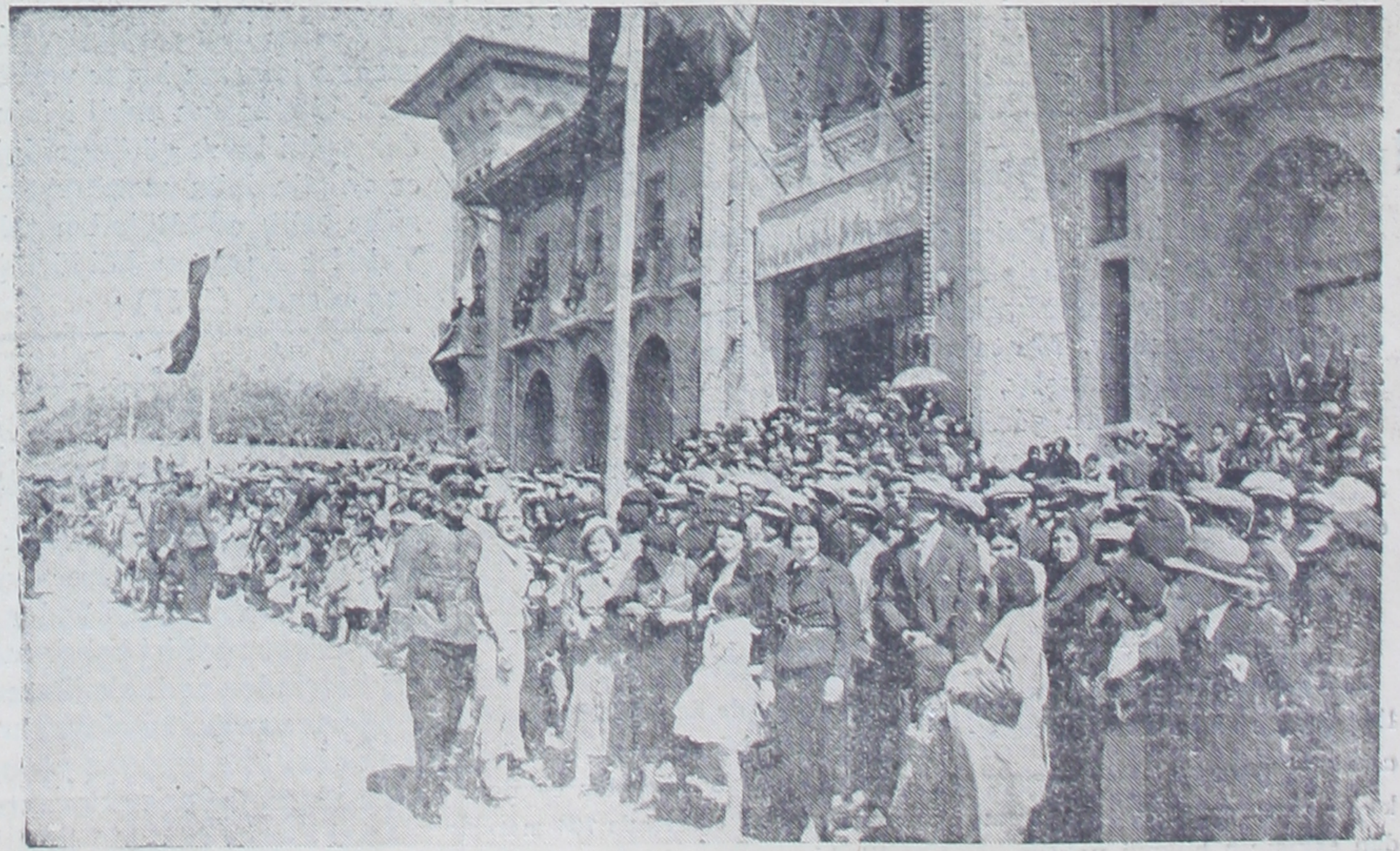
Kurultay üyeleri Kamutay kurağından çıkarırken (sağda kurultay münasebe ile yaptırılan heykel) ve kamutay kurağının önünde dün halkın canlı ilgisi