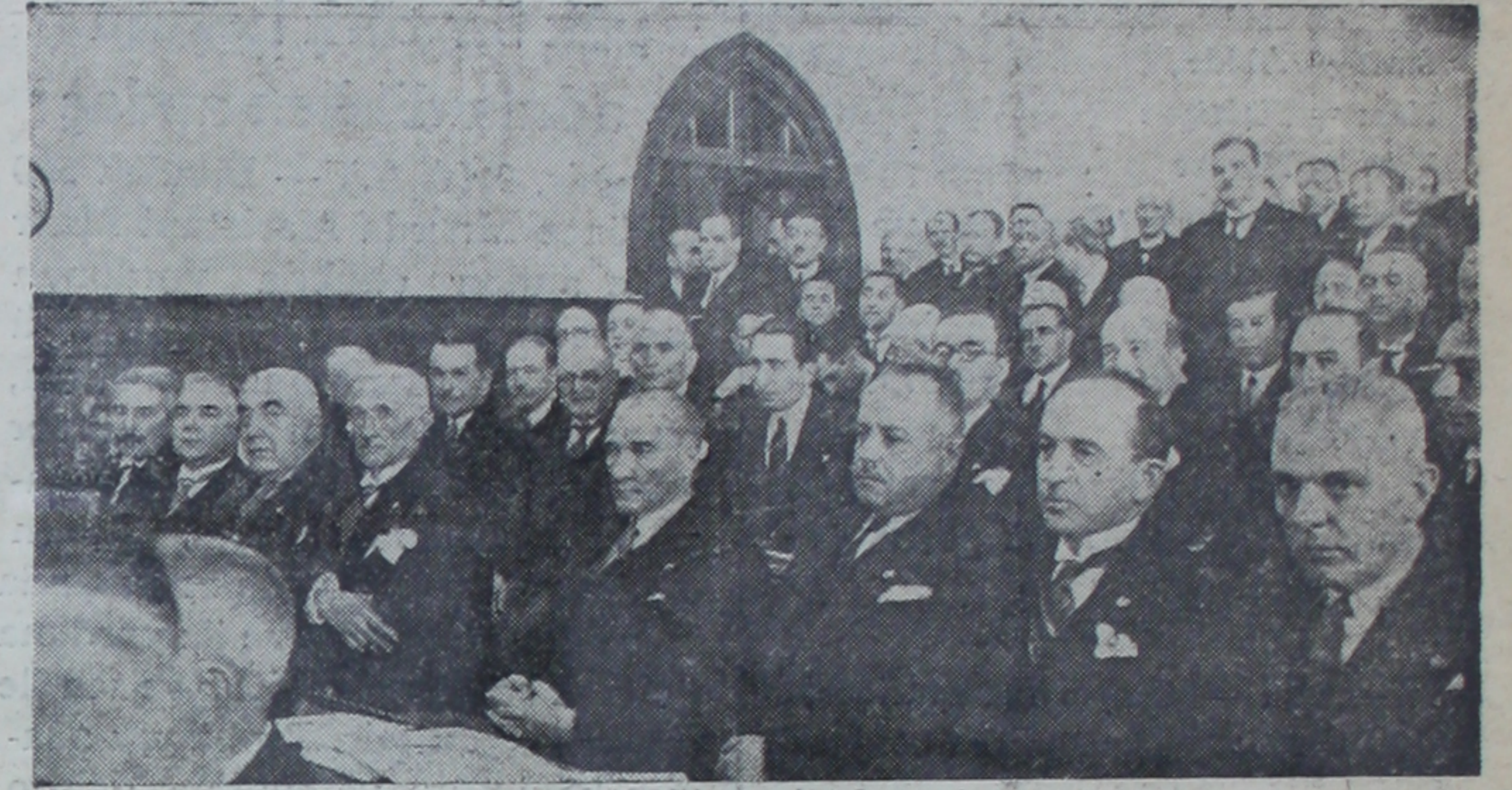
Atatürk Kurultay salonunda arka sıralardan birinde.