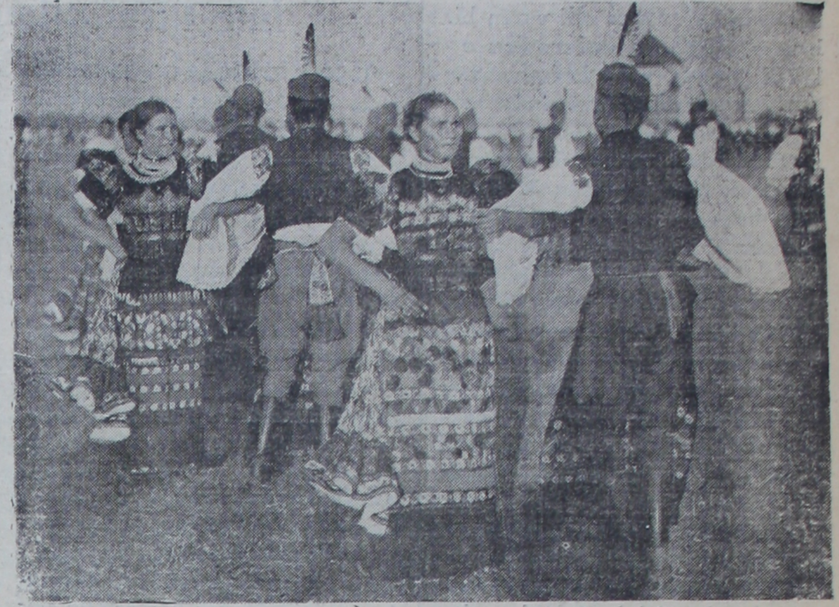
Bir macar köyünde ulusal dans..

Bu yazıdaki kılavuz kelimeleri: Natür = tabiat, kuzey = şimal, güney = cenub, uçak = tayyare, kudsal = kudsî, çıkart = ihracat, artırmak = daha iyi leştirmek, normal = normal, endüstri = sanayi, tecim = ticaret, meâğden = maden, tahıl = hububat, kotarılmak = halledilmek.