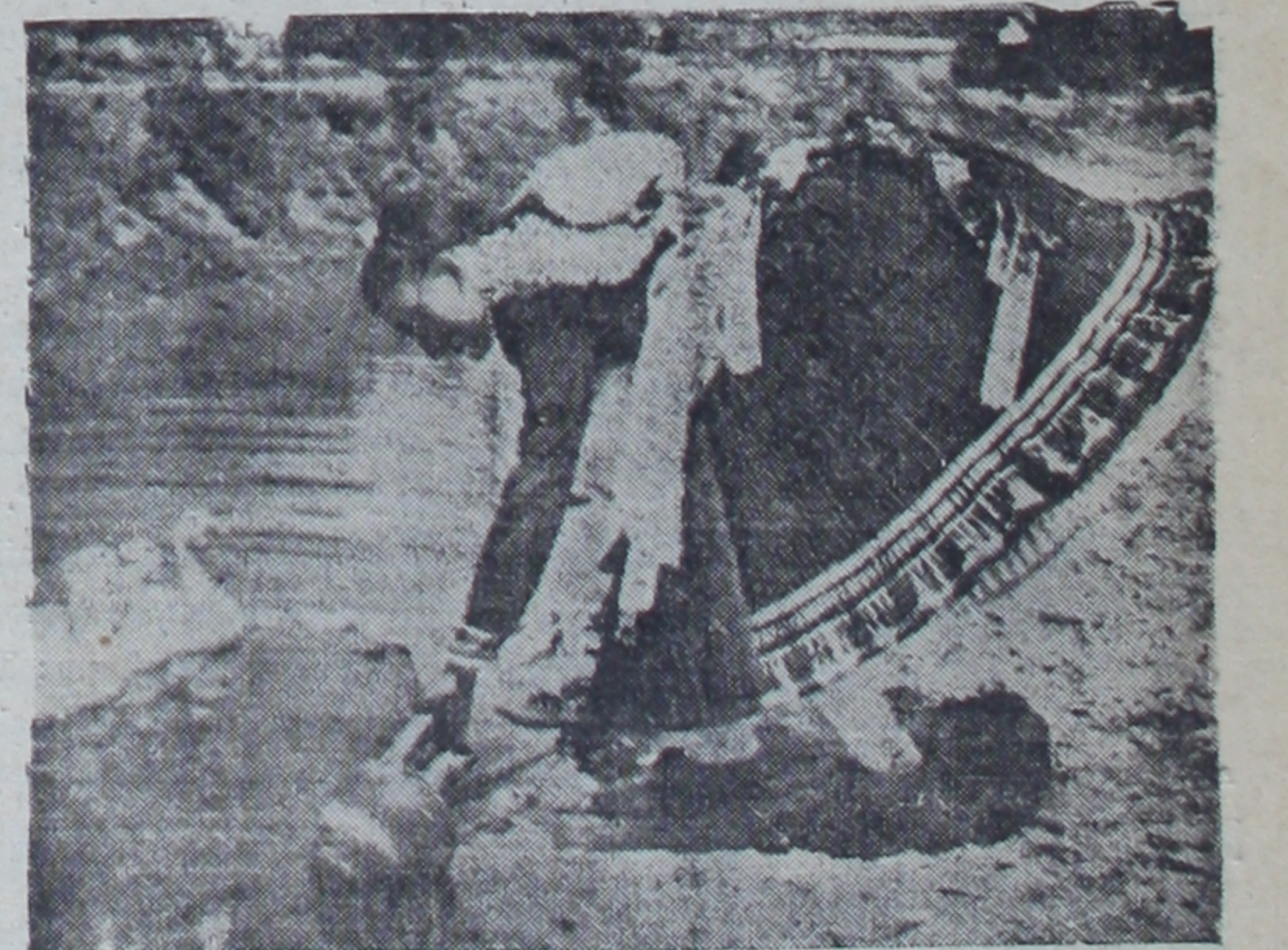
Bir macar köylüsü ulusal kıyafeti ile

Beş yüzlük bir sürüyü, çok zaman bir tek çikoş, uzun deri kaza-