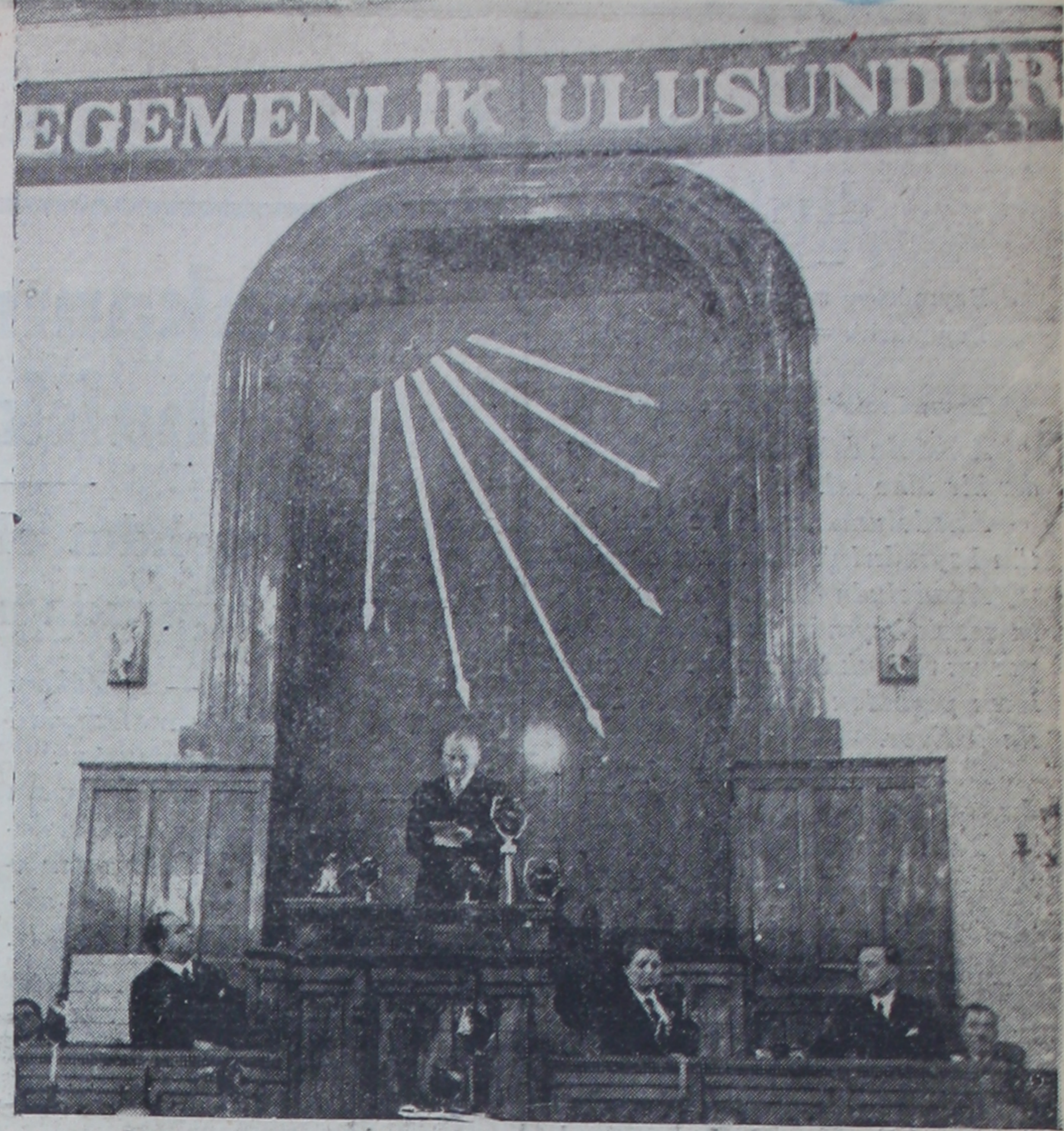
Büyük Önder Dördüncü Kurultay da söylevini verirken