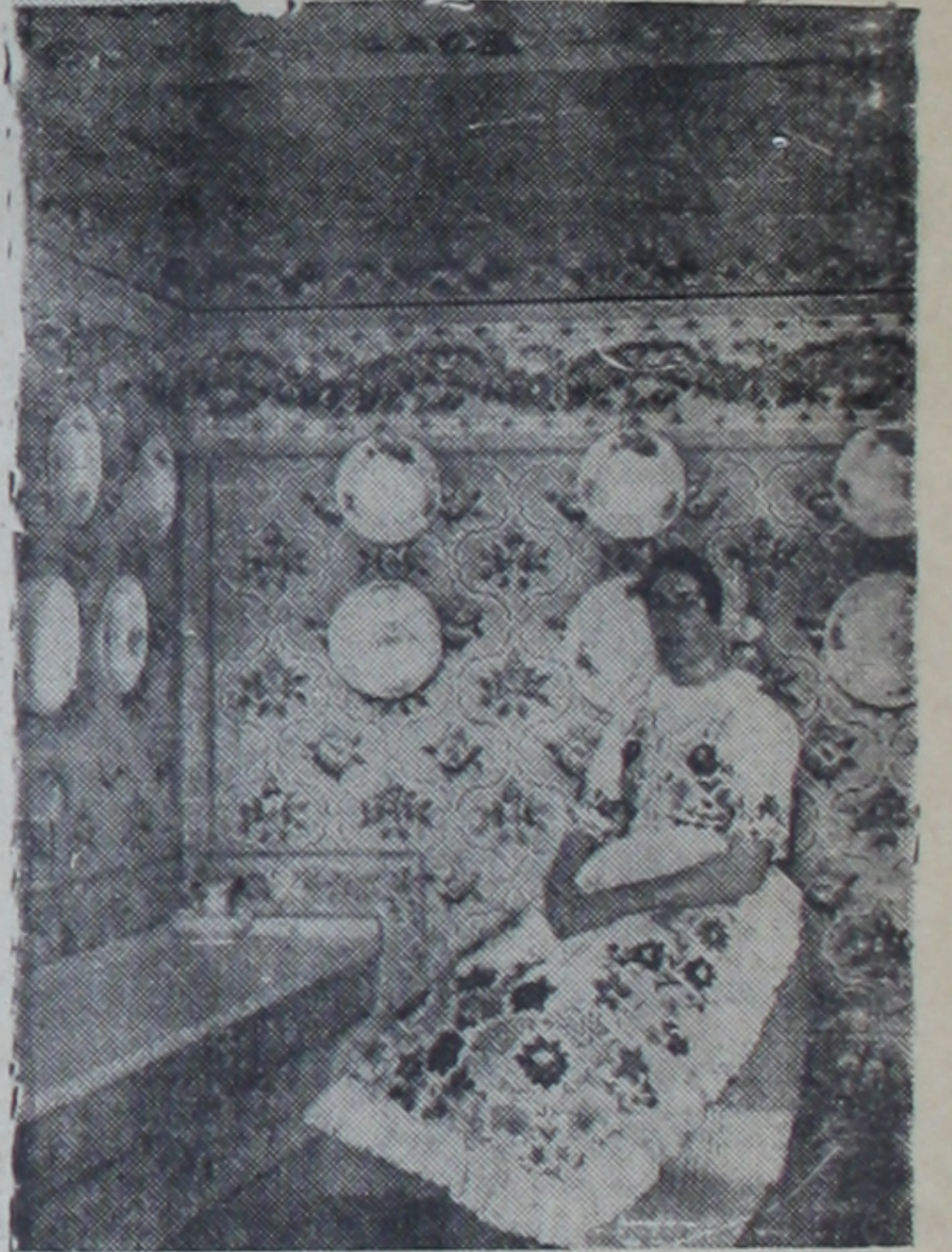
Macaristanda bir köy evinde süslü bir oda

Çikoş (at çobanı) macar ovasının efesidir. Kaz tüyleri ile süslü geniş siyah şapkasını başına geçirmiş, uzun etekli siyah elbi-