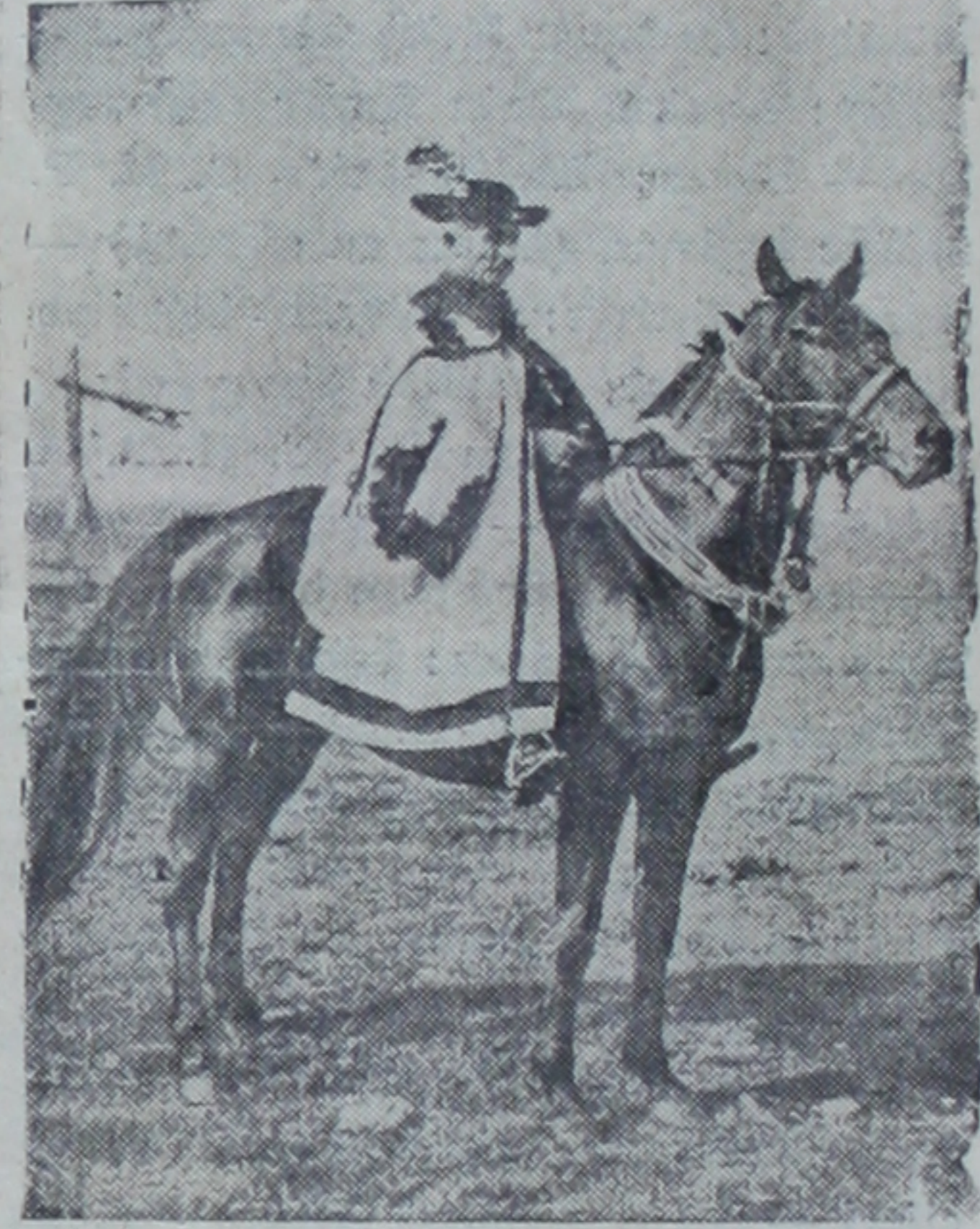
Bir macar at çobanı (Çikoş)

Tuna ve Tiza'nın nemlendirip beslediği geniş ova, macar ulusunun yüreğine en üstün sevgi olan