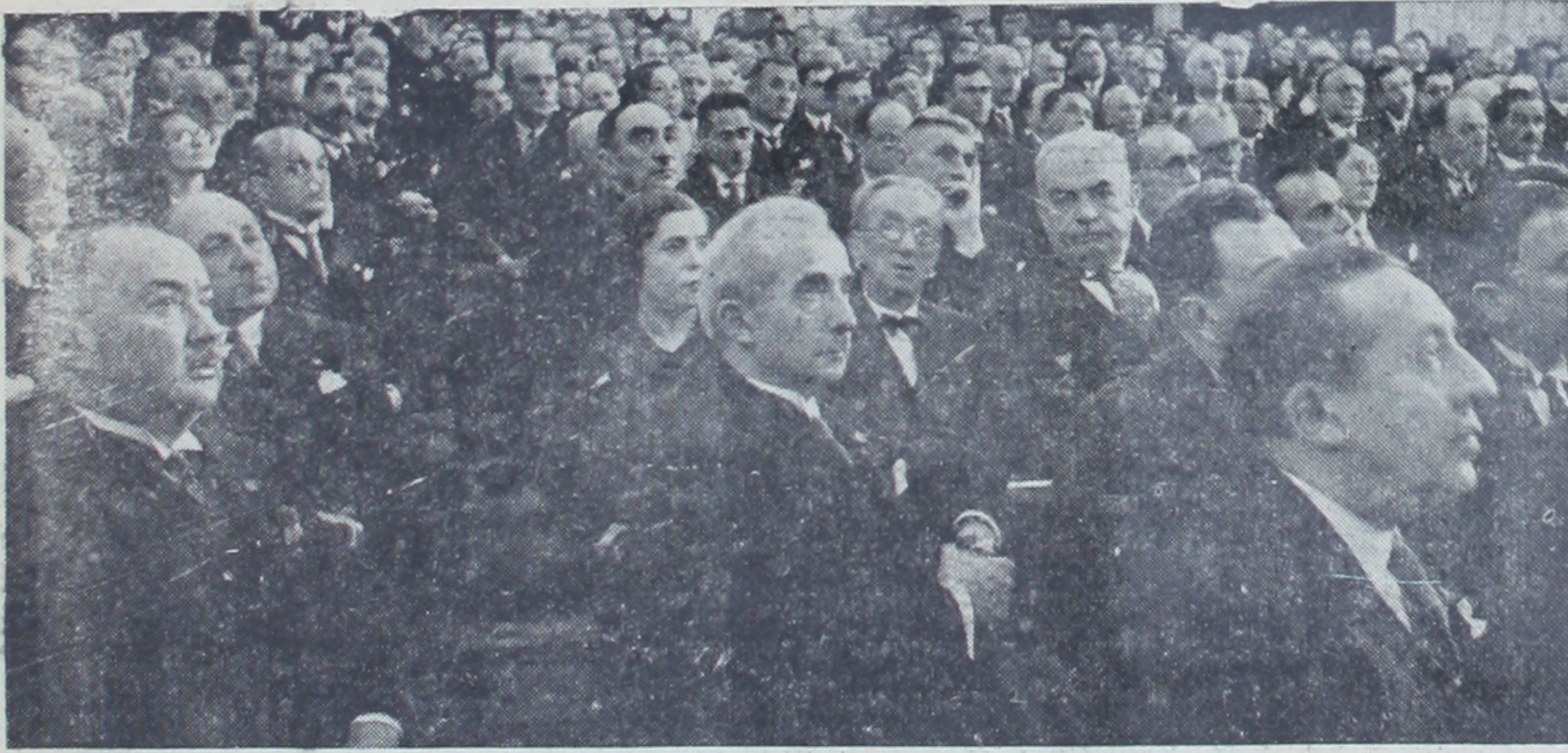
İnönü ve Kurultay Atatürk'ü dinliyor.