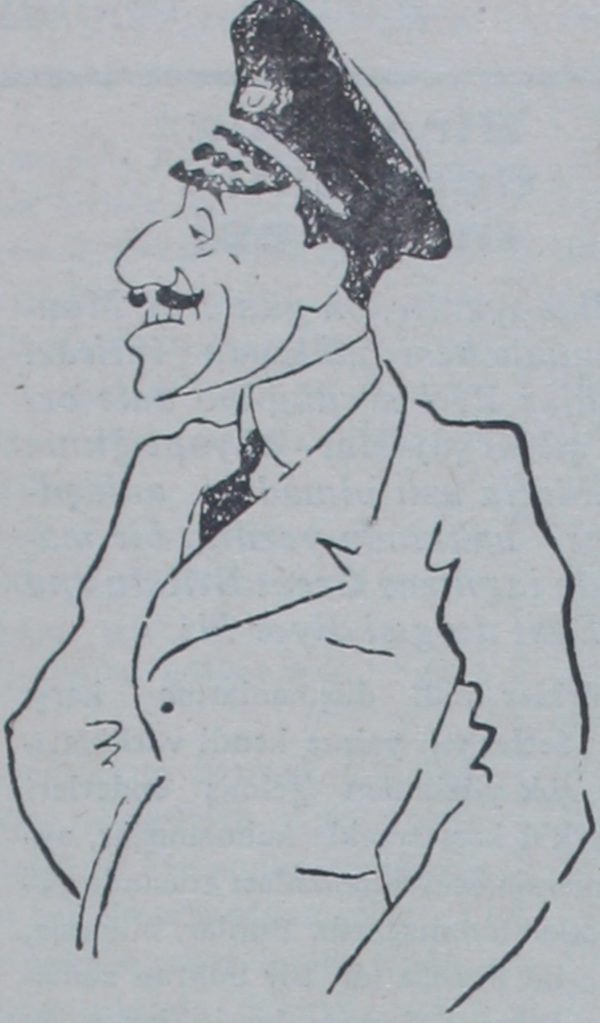
Sabrık İspanya kralı Onüçüncü Alfons

Paris, 9 (A.A.) — Buranın krallık taraftarları olan mahfillerinde söylendiğine göre, krallık taraftarları olan nüfuzlu şahsiyetlerin eski İspanya kralı B. Alfons'a müracaat ederek oğlu Asturi prensi don Juan lehinde tahttan çekilmesini istemişlerdir. Bu mahfiller eski kralın oğlu lehinde tahttan vazgeçmesinin İspanyada saltanatın dönmelerini kolaylaştıracağını iddia etmektedir.