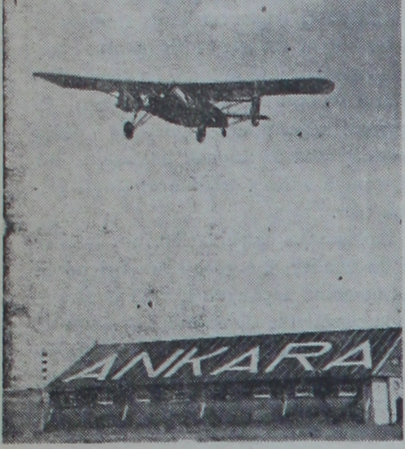
Türkkuşuna mensub bir tayyare kalkarken

Pazara İstanbulda Büyük hava tezahürleri yapılacak