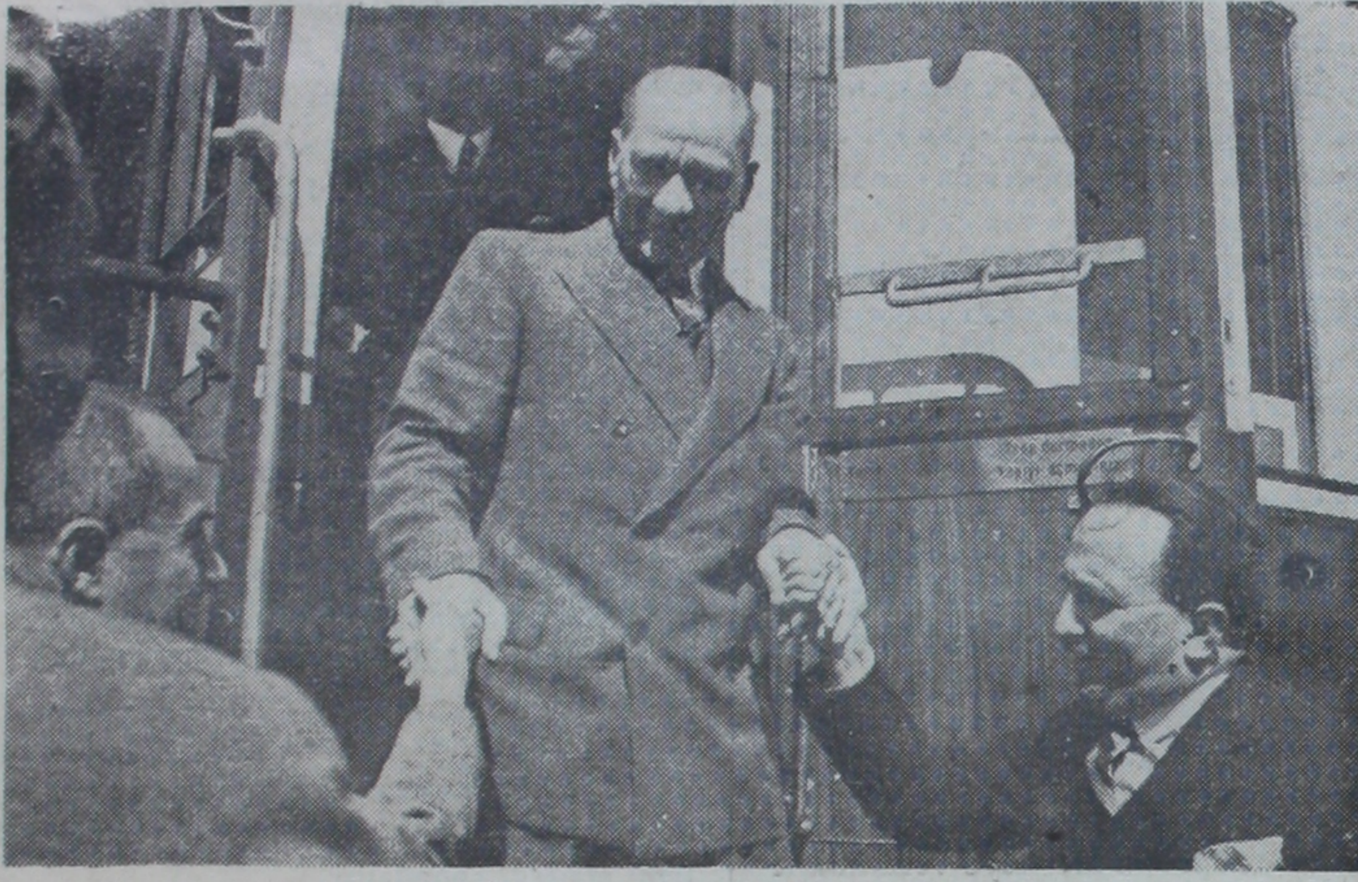
Atatürkün trenden inerlerken alınmış bir resimleri

Istanbul, 9 (A.A.) — Cumhuriyet Reisi Atatürk, bugün 15.15 de hususi trenleriyle Haydarpaşa'dan Ankara'ya hareket buyurmuşlardır.