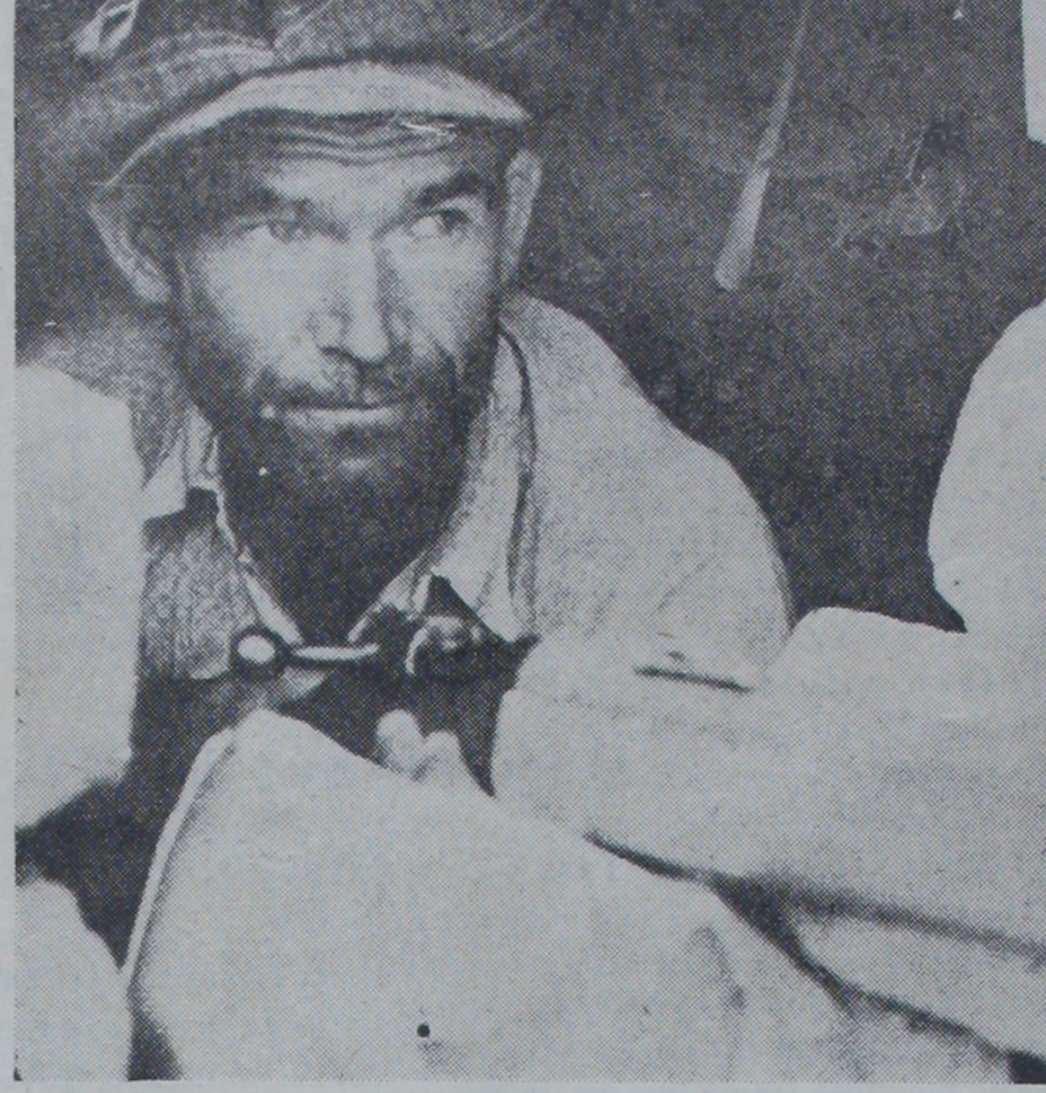
Franko ordusu siperlerinde bir âsi nefer

Salâhiyetli mahfiller birkaç gün önce başvekilin söylediklerini tekrar eder. Başvekil bu söylediklerinde, memleketin nizam ve sükûnunu hiç bir tehlikenin tehdid etmediğini ve hükümetin bu ni-