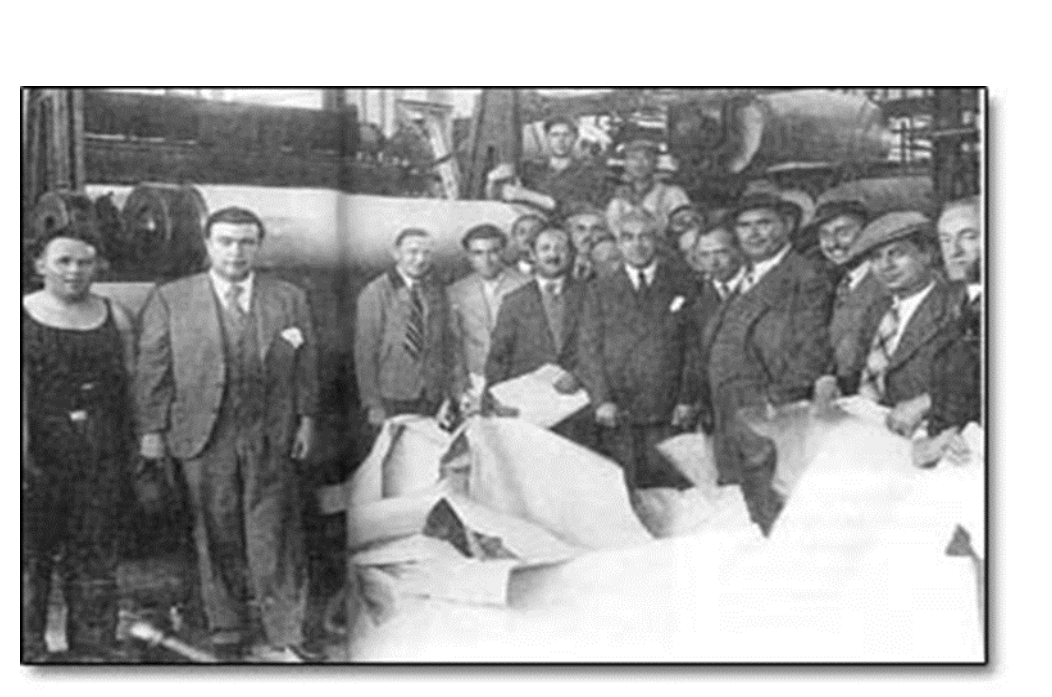
Ulus Gazetesi, 20 Nisan 1936.

'Pek' kelimesinin dilimizde iki kullanımı vardır... 'Pek' kelimesinin dilimizde iki kullanımı vardır.