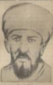
İmam Yahya'nın öldüğü rivayeti dolaşıyor.

İsmâil Hakkî Bey teklifi kabul edilmiş, teklif kâğıdı hazır.