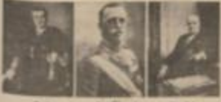
Bu fotoğraf, İtalya Krah Peşteye gidiyor. İktisat Vekili, Afrika ve Asya üzerinden bir seyahat...