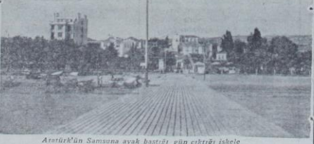
Atatürk'ün Samsuna ayak bastığı gün çıktığı işlele