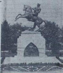
Samsun'da Atatürk heykeli

Atatürk; bundan 17 yıl önce ve bu- gün Samsuna çıkmıştır. Bugünkü me- sud ve örnek Türkiyeyi yaratan en bü-