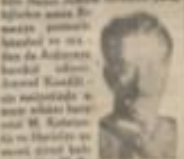
General Kondilis yarın Ankara'ya geliyor.

KONGRE, 2 (MİLLİYET) — Yunan Harbiye nazırı General Kondilis yarın Ankara'ya geliyor. General Kondilis Ankara'da kongre meclisleri görüşecek.