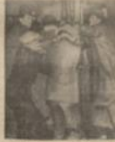
Paris'te sükûta tene edililebildi... (Caption for the Paris illustration.)