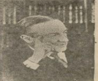
Yakın zamanda bir nutuk veren İngiliz başbakanı B. Baldwin

Londra, 19 (A.A.) B. Baldwin, Vercorlar müzakereinde pozitif birliğinde dım... Baldwin'in de ayrılmış hâlede... Baldwin'in de ayrılmış hâlede.