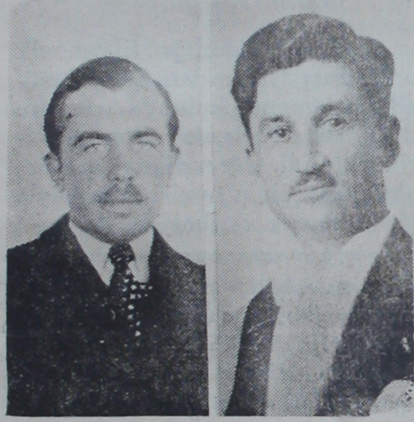
Eseri türkçeye çevirenler: Dr. Ömer Rüstü Tarman ve Dr. Vamık Tayş

Kitabın “Önsöz” başlıklı sayfasının ilk satırında ise profesör (Anadolu çiftçisi Türkiye devletinin kalbi) olduğunu söyledikten sonra (yalnız başına her çiftçi halinin iyileştirilmesiyle bütün Türkiye çiftçiliğinin eko-