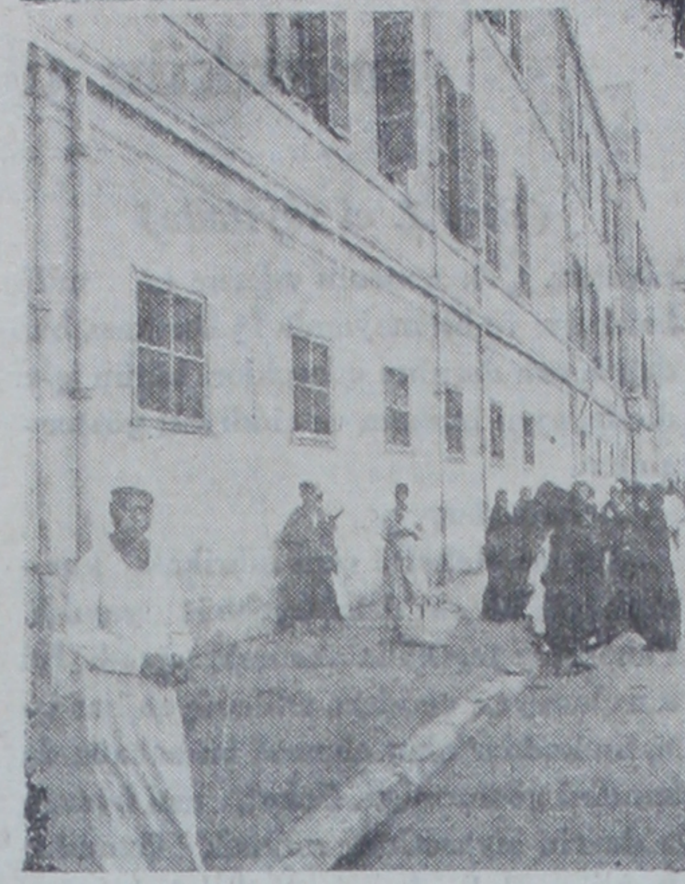
Hastanede yaralıları görmeğe gelenler

Şu halde İngiltere ne için 923 kanununun iadesini hoş gözle görmüyor? Bunu Nahas paşanın diyevi şöyle anlatıyor: İngiltere Mısır'ın iç işle-