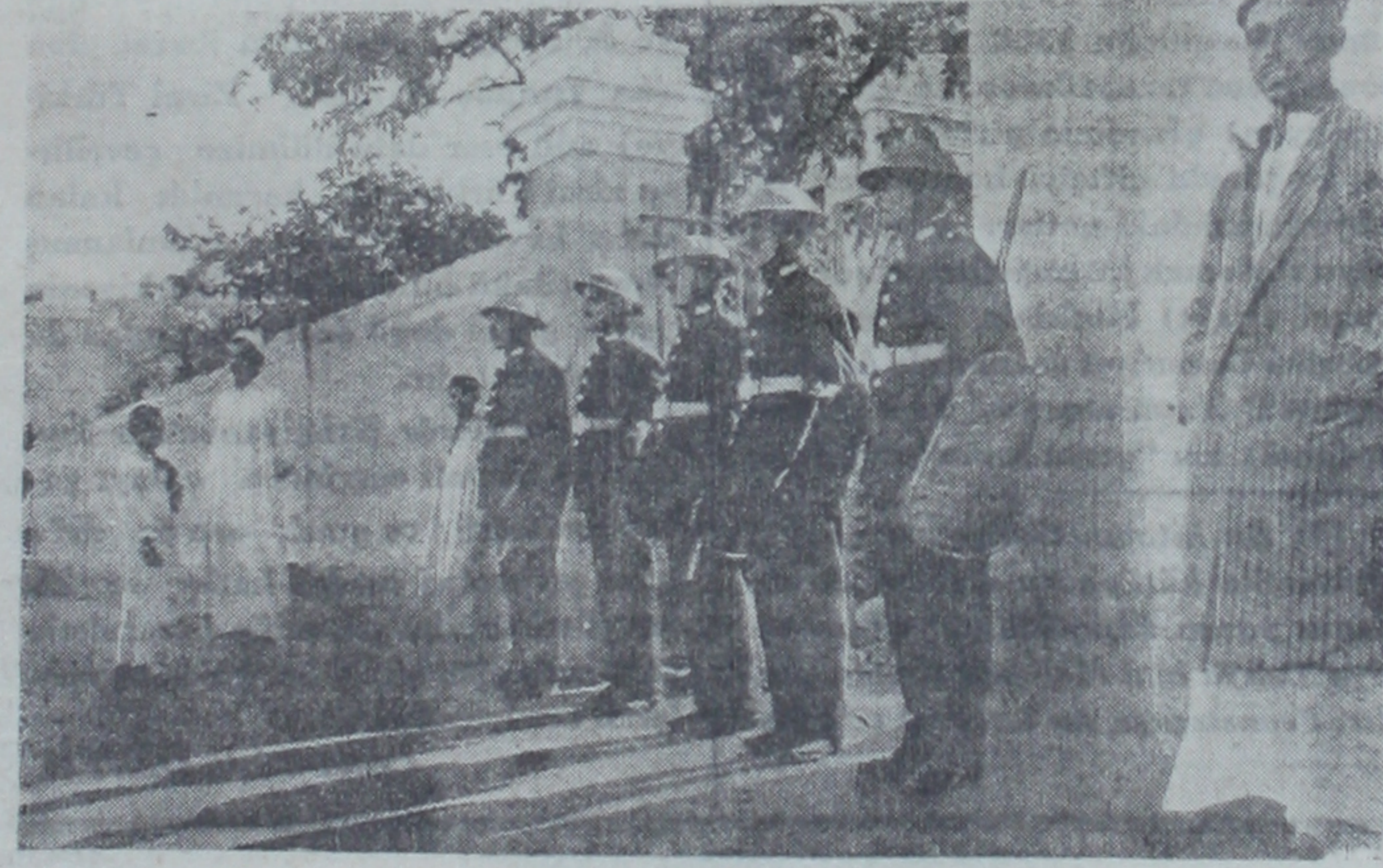
Kahirede hastane önünde nöbetçiler

Vafd partisi başkanı Mustafa Nahas paşanın diyevinde dediğine göre 923 kanununun Mısır milletini temsil eden bir parlamento kaldırmış değildir. Ziver paşanın, biraz orfi olan hükümeti zamanında, meriyete iadesi caiz olup olamayacağı üç yıl sonra tekrar tetkik edilmek üzere kanunun hepsi değil; yalnız bazı maddeleri muvakkaten kaldırılmıştır. Nihayet (930) tarihinde Sıdkı paşa bunu bütün kaldırarak yerine kendisinden ve milleti temsilden fersah fersah u-