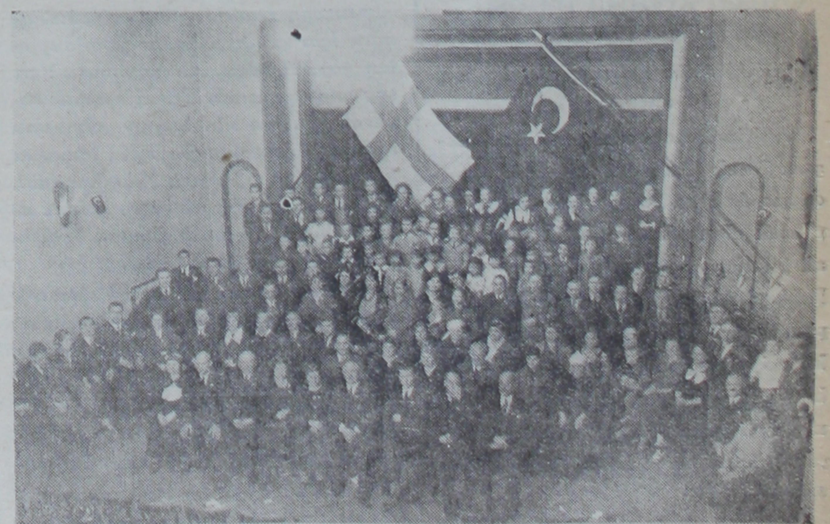
Finlandiya'da, Helsingfors'taki yurddaşlarımız cumuriyetin on ikinci yıldönümünü kendi aralarında yaptıkları bir toplantı ile kutlemişler ve anavatandaki yurddaşlarını saygı ve sevgi ile anmışlardır. Resmimiz yurd dışında yaşayan bu yurddaşların yaptıkları toplantıyı göstermektedir.