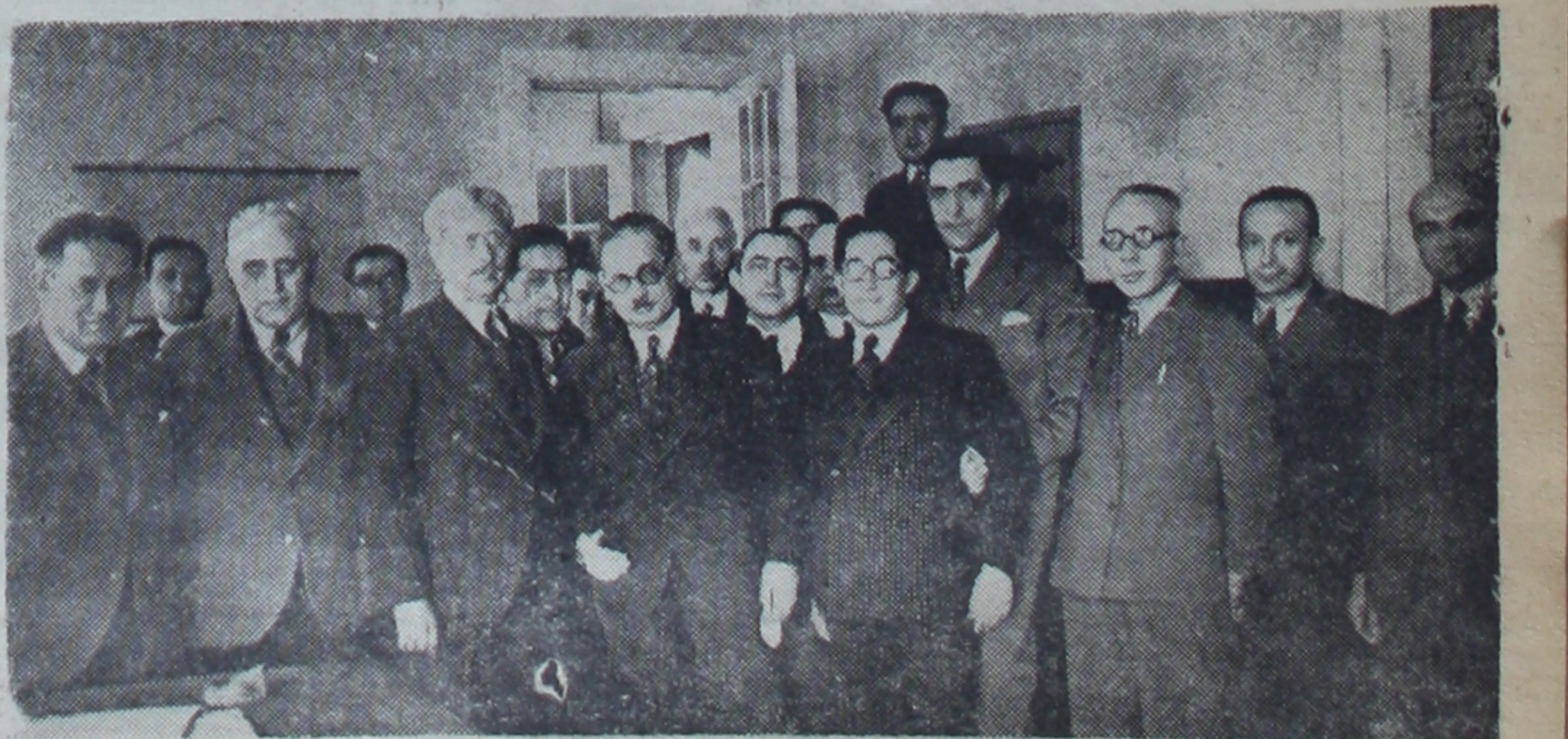
Adapazarı Türk Ticaret Bankasının dünkü umumi toplantısında bulunanlar