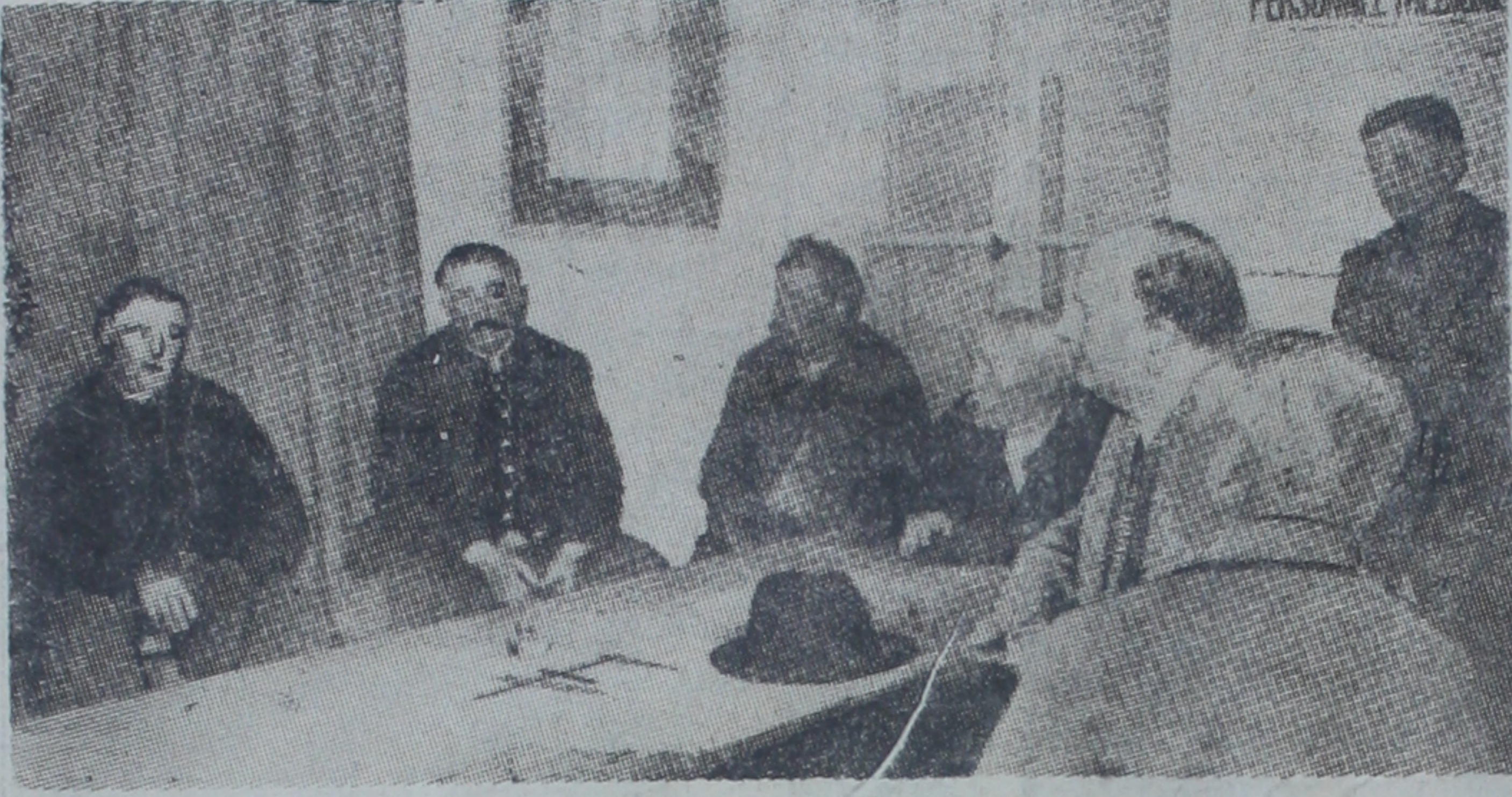
Fransız Dış Bakanı B. Flanden kendi seçmenleriyle yaptığı bir konuşmada

mevzuu bahsettiğini hatırlatmış ve sözüne devamla demiştir ki: