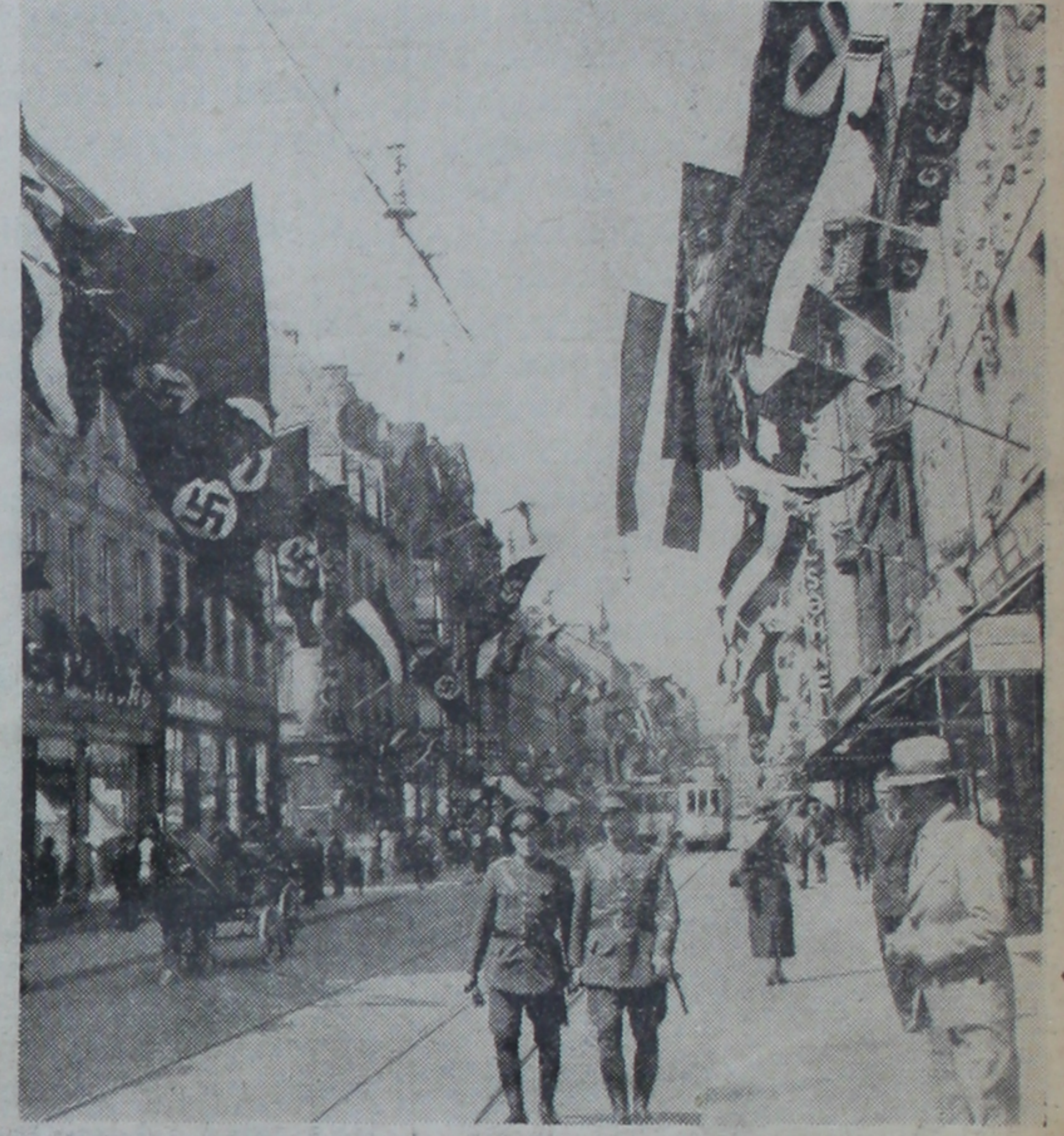
Geçen seçimde donanmış bir alman şehri.

Başbakanlık dairesinin önüne yığılan binlerce halk, alkışlamak için, B. Hitler'in balkona çıkmasını bekliyorlar.