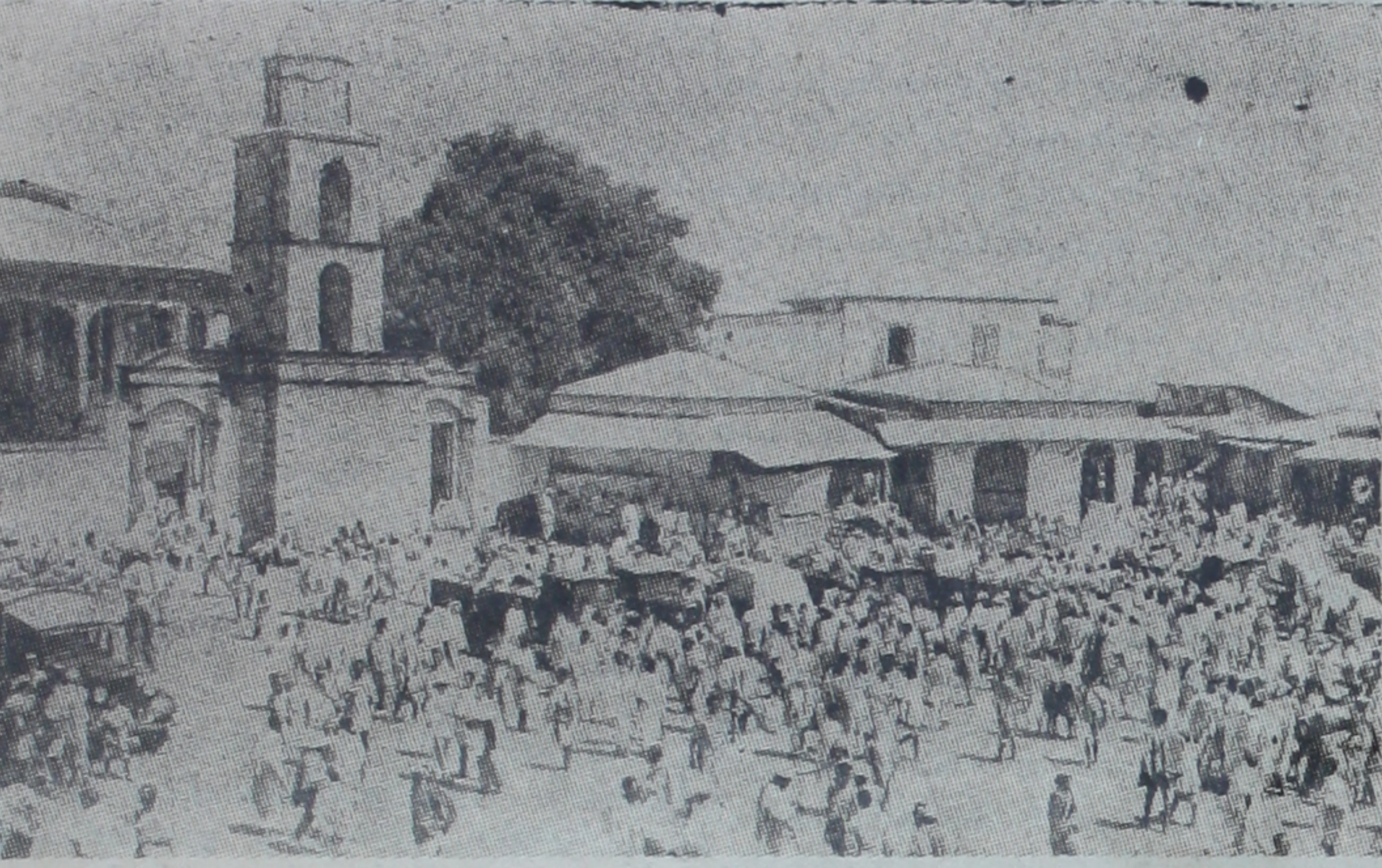
İtalyan tayyarelerinin bombardımanlarından tamamen harap olan Harrar

Londra, 30 A.A.) — Harrar'ın İtalyan tayyareleri tarafından bombardıman edilmesi dolayısıyla "Deyli Herald" gazetesi İtalya aleyhinde, Milletler Cemiyeti nizamnamesinin 16 ıncı maddesinin