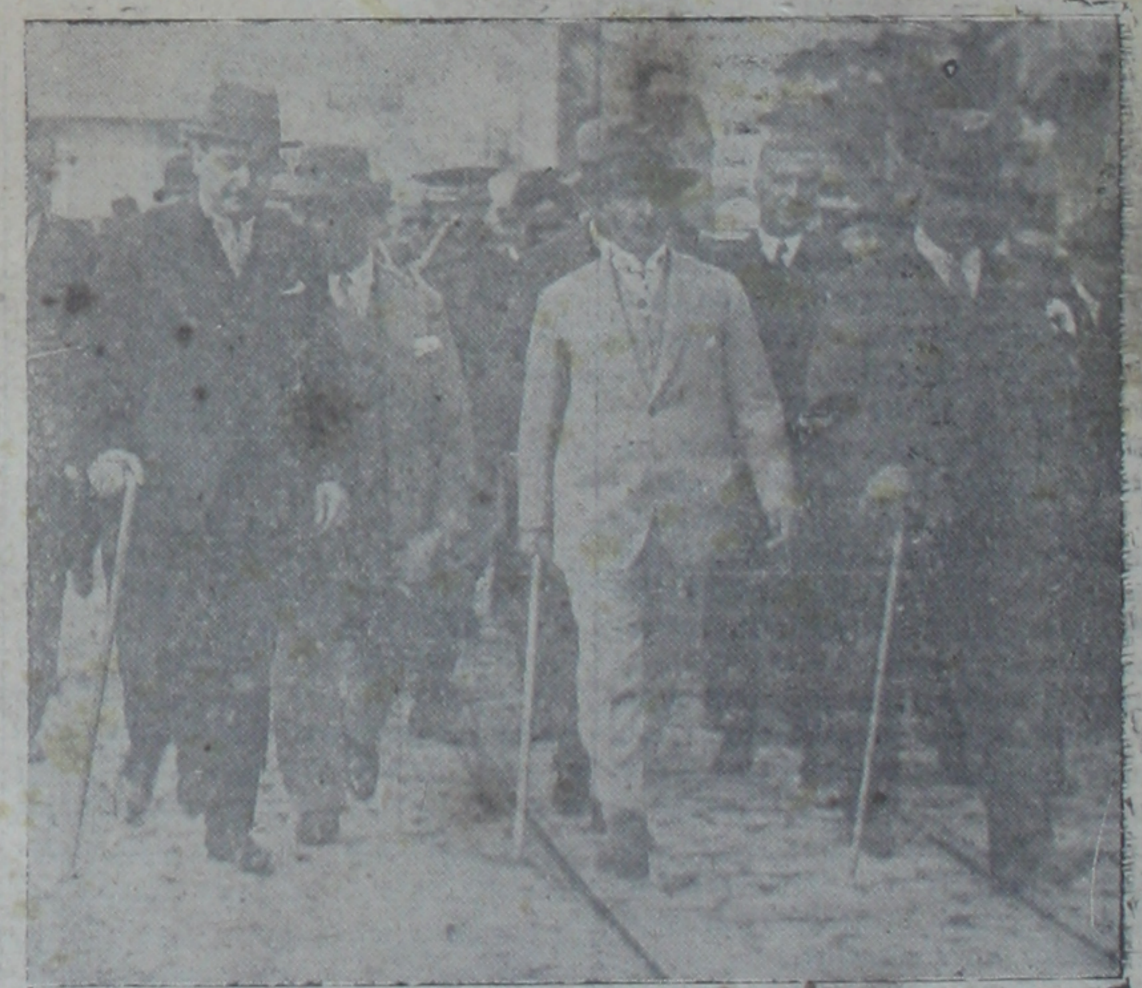
Dünkü vaz'ı esas resminden bir intiba

Vaz'ı esas resmi dün Başvekil İsmet Paşa Hz. tarafından yapıldı Yeni hat 63 gün sonra işliyecek