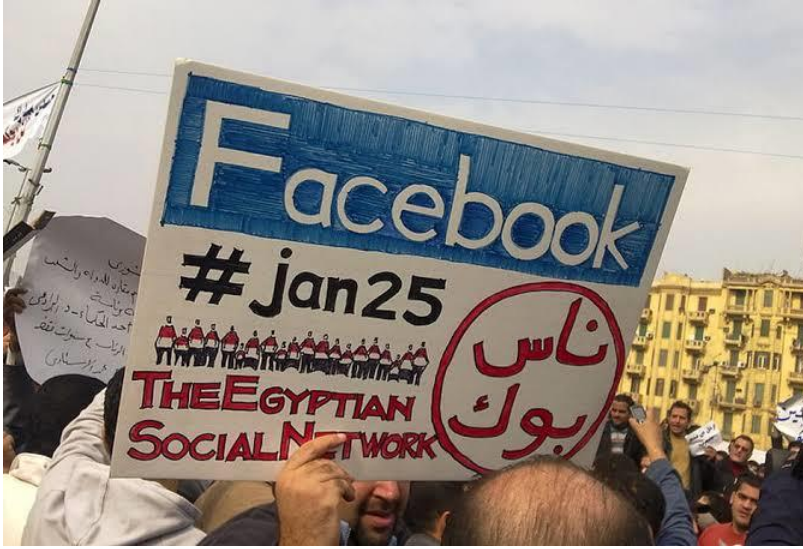
Resim 1 Arap Baharı eylemleri sırasında yeni medya araçlarından Facebook oldukça gündemde olan bir uygulamaydı.

Tunuslu Muhammed Buazizi'nin 17 Aralık 2010'da kendini yakmasıyla başlayan eylemler, kısa sürede ülkeye yayıldı. Buazizi, ülkesinde seyyar satıcılık yaparak ailesini geçindirmeye