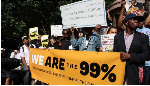
Resim 4 "We Are The %99" (%99 biziz) İşgal et! hareketinin simgesel etiketlerinden biri.

Arap Baharı'ndan ve İspanya'nın öfkeli hareketinden feyz alan AdBusters isimli aktivist grubun toplanma çağrısıyla 17 Eylül 2011'de başlayan eylemler kısa sürede sosyal medyanın da desteğini alarak, dünya