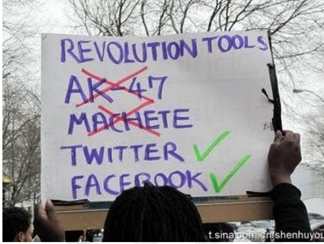
Resim 2 Washington Üniversitesi'nin Arap Baharı hakkında yaptığı bir araştırmaya göre, hareketler başlamadan önce Ortadoğu coğrafyasında yeni medya ağlarında "devrim" kelimesi sıkça kullanılır olmuştur.

Tunus'tan sonra Mısır'a sıçrayan olayların ise, iktidarın yürüttüğü baskıcı politikalara karşı duran 6 Nisan Hareketi'nin siyasi içerikli bloglarından yayınladıkları Tahrir Meydanı'na toplanma çağrısıyla başladığı bilinmektedir.