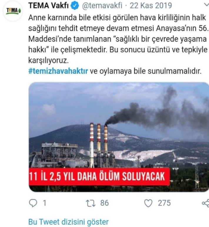
Resim 12 TEMA Vakfı'nın katıldığı "bilgilendirme" çalışmalarından biri. Konuyla ilgili #temizhavahaktır etiketinde, TEMA gibi sivil toplum kuruluşlarının bilgilendirme amaçlı paylaşımlar ile oluşturulan ideolojik ortam, yurttaşların bireysel katılımıyla destek görmüştür.

Anayasanın 56. Maddesi “Sağlıklı Çevrede Yaşama Hakkı” 61 ile çelişen ve geçtiğimiz yıl Türkiye sosyal ağlarının gündeminde yer alan “Termik santral bacalarına filtre takılmasının 2,5 yıl daha ertelenmesine” ilişkin kamuoyunda yaşanan tartışmalar, kanun