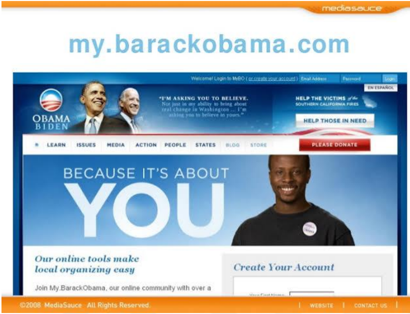
Resim 3 Obama'nın yeni medyada yürütülen seçim kampanyasının adresi mybarackobama.com adlı internet sitesi

Geçmiş siyahilere karşı yürütülen ırkçılık faaliyetleri ile dolu ABD'nin ilk ve tek siyahi başkanı Obama'nın 2008'de kazandığı başkanlık seçimi, yeni medyanın siyasete katılım aracı olarak