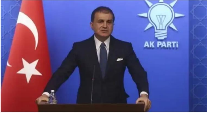
Resim 14 Cumhurbaşkanı Erdoğan'ın 27 Kasım'da veto ettiği yasa hakkındaki açıklamaları AK Parti Sözcüsü Çelik 2 Aralık 2019'da açıkladı. Ardından veto edilen yasa, tekrar Meclis'e gönderilerek, Termik Santrallerle ilgili maddenin çıkartılmış halivle onavlandı.

Cumhurbaşkanı yasayı veto ederken, “(...) Çünkü 7 yılda yapılmayan bir işlemin bu yeni süre verilmesiyle de yapılacağı konusunda bir kanaat oluşmamıştır” sözlerini kullandı. Bu sözler, filtre takılmasını erteleyen yasanın çıkmasına itiraz eden yurttaşların sesinin yürütme erkine ulaştığını gösteriyordu. Yurttaşlar, yürütmenin kararını etkileyerek siyasete katılımı, “çevre bilinci” ve “sağlıklı yaşama” hakları için kullanmışlardı.