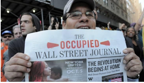
Resim 5 Eylemler başladıktan yaklaşık 3 hafta sonra, Wall Street Journal gazetesi "Occupied" başlığıyla yayın yapmaya başladı. Sosyal ağlarda başlayıp Wall Street'e taşan eylemlere, analog medya da dahil olmuştu.

olan, sosyal medya üzerinden toplumsal hareketlere dönüşen bu eylemlerin neden katılımı arttırdığının kanıtıdır.