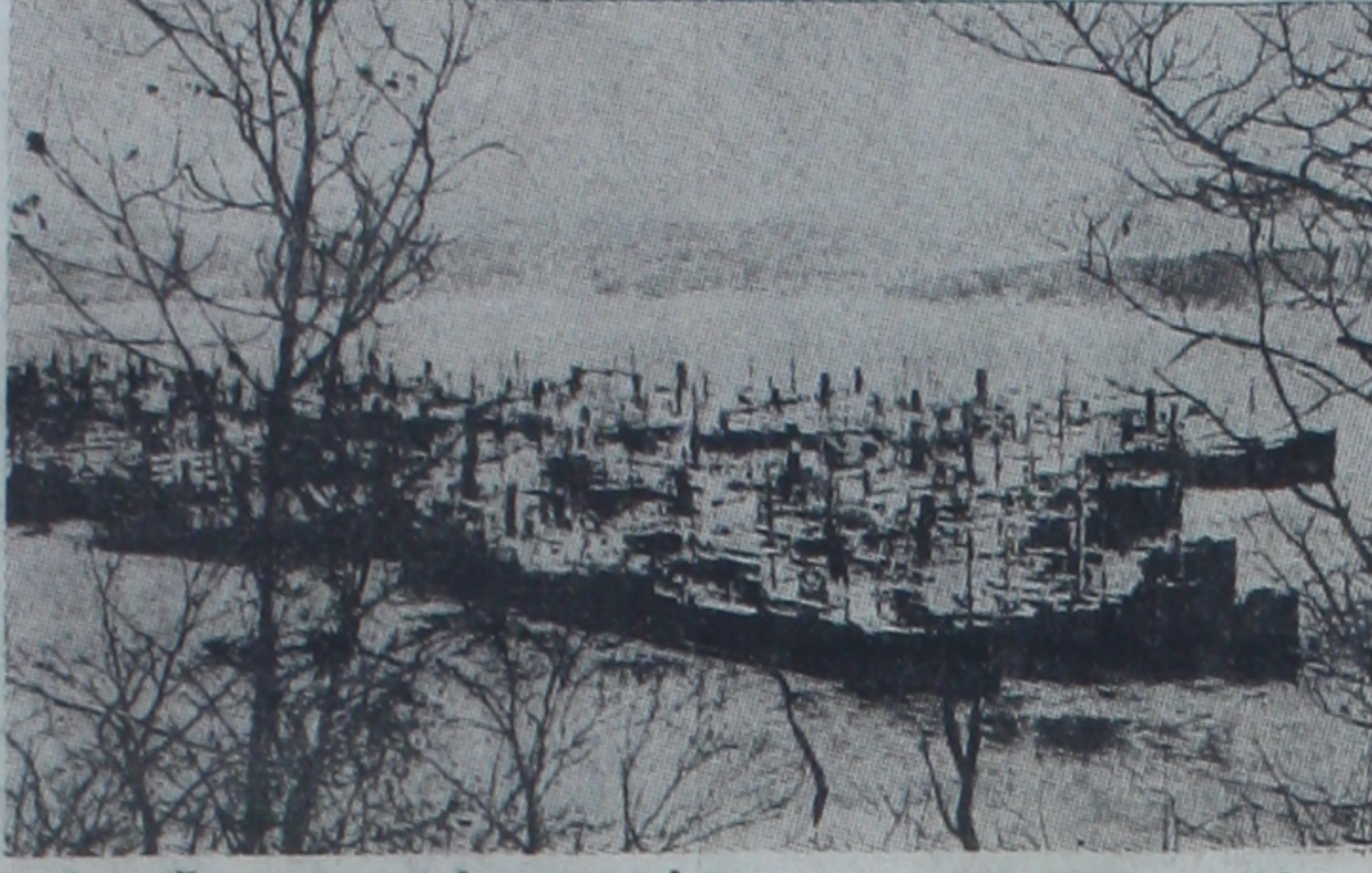
Amerikanın geçen harpte seri halinde yaptığı yüzlerce yük vapurlarından bir grup

Amerika geçen harpte Fransaya asker ve malzeme nakliyatını temin için az zamanda ve seri şekilde yüzlerce vapur yaptı. Bu gemiler o zamandanberi metruk kalmıştır, çünkü bunları ticari surette işletmekte hesap yoktur. Fakat vapur ihtiyacı karşısında hesap filân bir tarafa bırakılmıştır. Son zamanlarda Amerika hükümeti, bu vapurları faal bir hale koymaya zaten uğraşıyordu. Eğer Amerika gemilerinin, Amerikan filolarının himayesi altında işlemesi haberi doğru çıkarsa bu vapurlardan derhal istifade edileceği şüphesizdir.