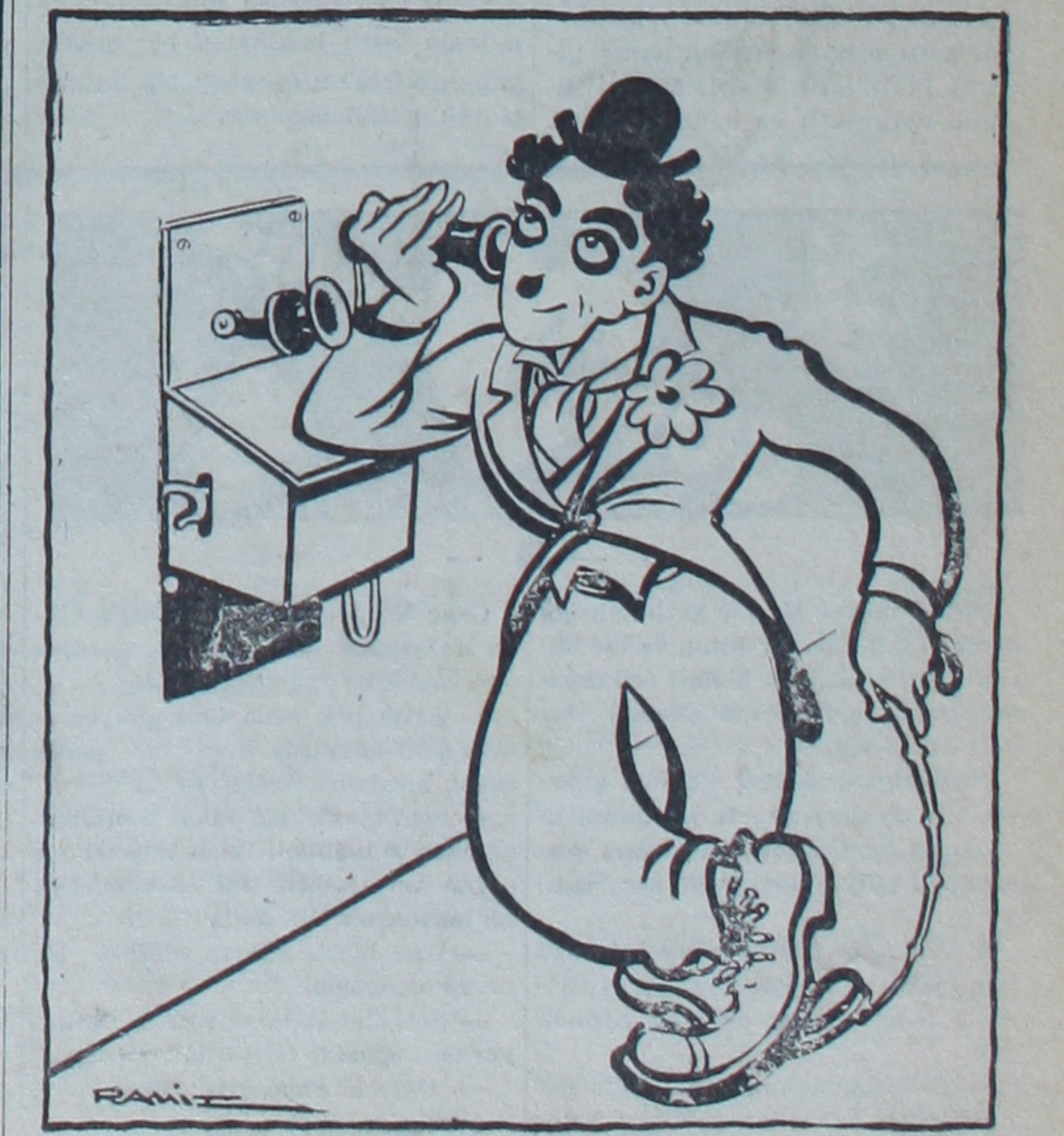
Şarlo — ... Hayır bayım, Avrupada çevrilen büyük diktatör oyunu benim değildir!

Arnavutluk cephesinin merkez * (Devamı: Sa. 3, Sü. 7 de)