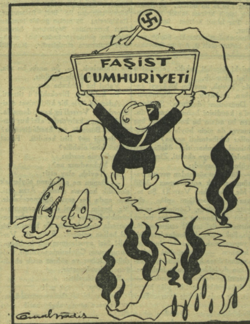
«Ba'de harab-el Basra!»

Tenekeye, kalaya, lehime ve her türlü malzemeye muhtaç bulunmamaza rağmen, bu ne israf!