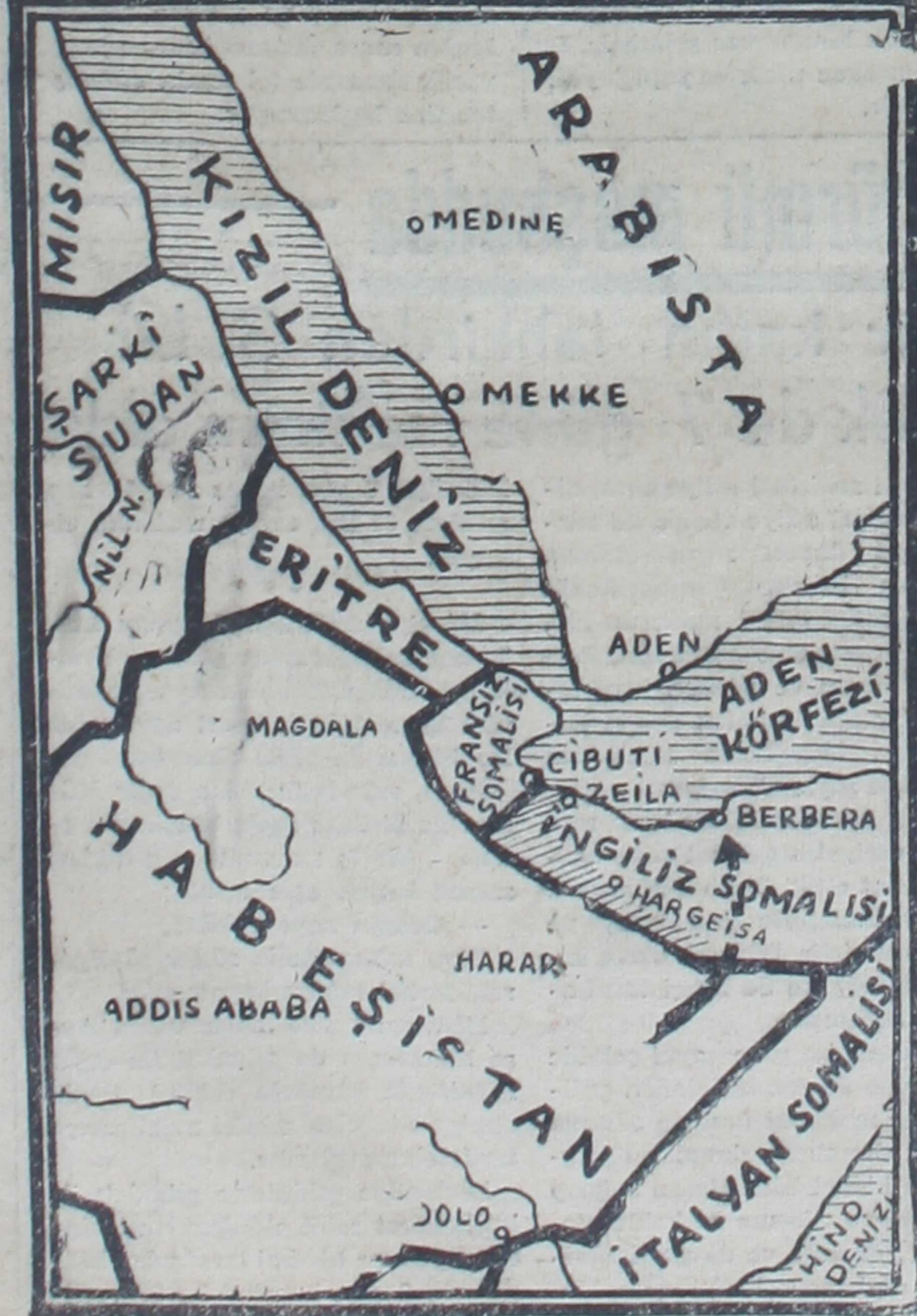
İngiliz Somalisi ile civarını gösteren harita.

itibaren şehrimizde ekmek narhı 11,75 kuruştan tatbik olunacaktır. Yapılan zam yalnız ekmek fiyatları için kabul olunmuştur. Francelâ imalinde kullanılan unlar serbest piyasadan alındığından şimdilik francelâ fiyatlarına hiç bir zam yapılmıyacaktır. Diğer taraftan buğday fiyatlarına zam yapılmasından sonra bile bugünkü ekmek narhını muhafaza etmek için Ticaret Vekâletinin hazırladığı formül üzerine yapılan tec- (Sonu 3 üncü sayfada)