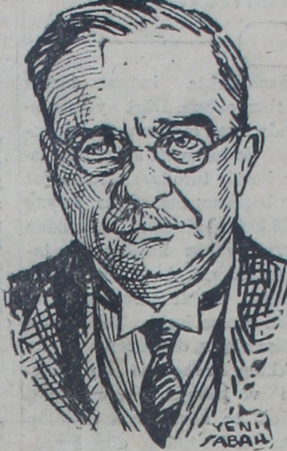
Yunan başvekili Metaksas

Berlinske gazetesinin Lizbon muhabiri İspanyanın askerî hazırlıklar yapmakta olmasından bahsederek şunları yazmaktadır: İspanyol gemileri derhal İspanyol veya bitaraf limanlara hareket etme emrini almışlardır. Telgraf ve telefon muhaberatına İspanyada şiddetli bir sansür konulmuştur. İspanyanın salâhiyyetler mahafilî tam bir ketumiyet muhafaza etmektedirler. Fakat müteaddid emareler İspanyanın İtalyanın yanında harbe girmeye (Sonu 3 üncü sayfada)