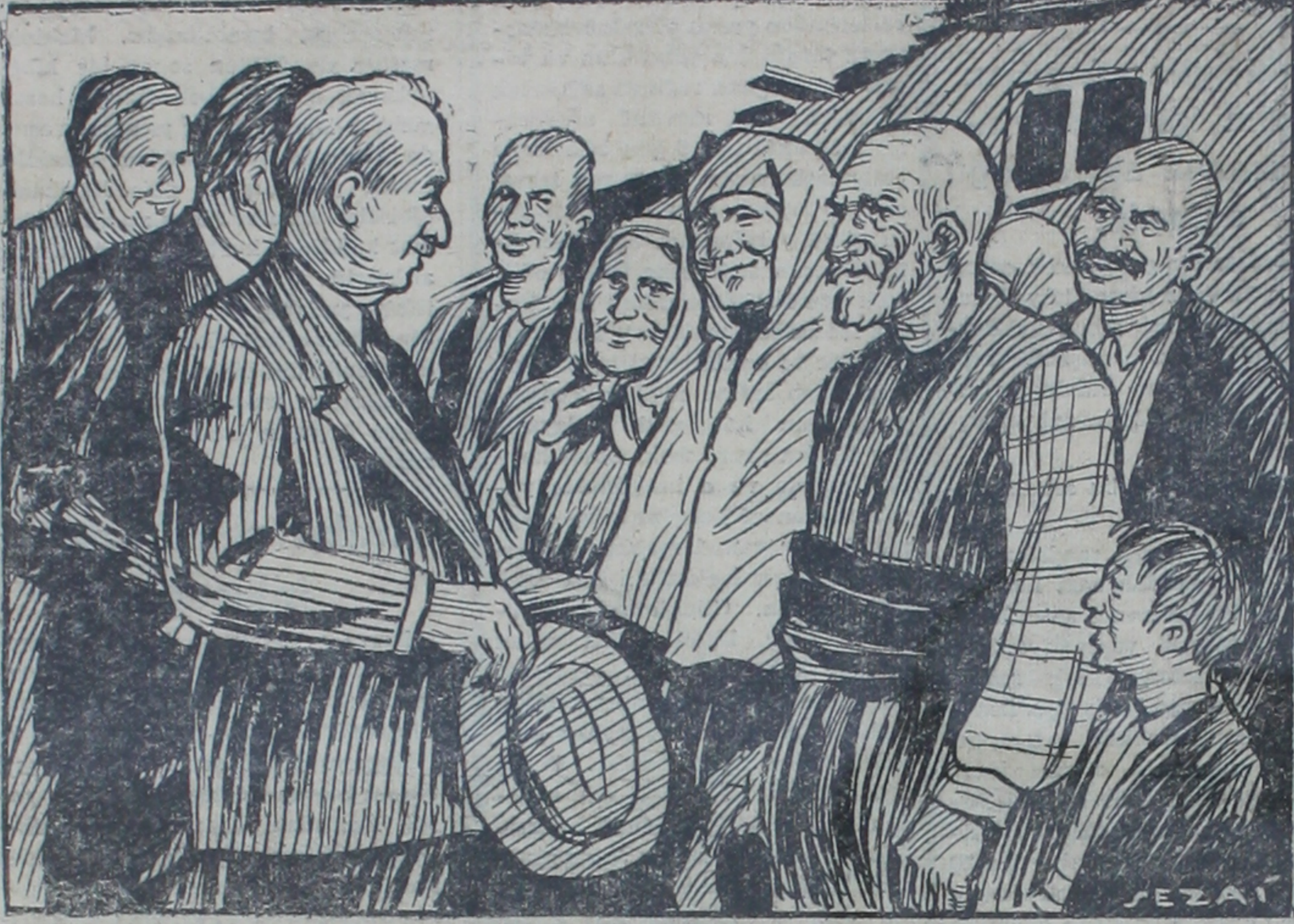
Millî Şef köylüler arasında

Millî Şef Samsundan sonra Çarşamba ve Çorumu şereflendirdi