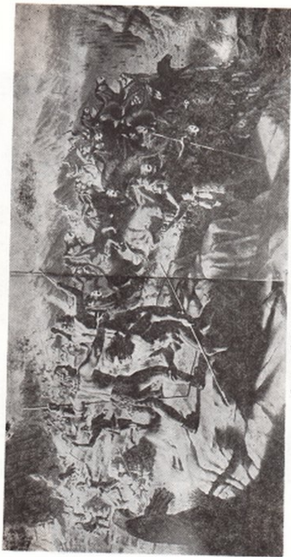
Рис. 4 - Ул Палеолитіне сэрккэ Үөлүмү Ат аы.