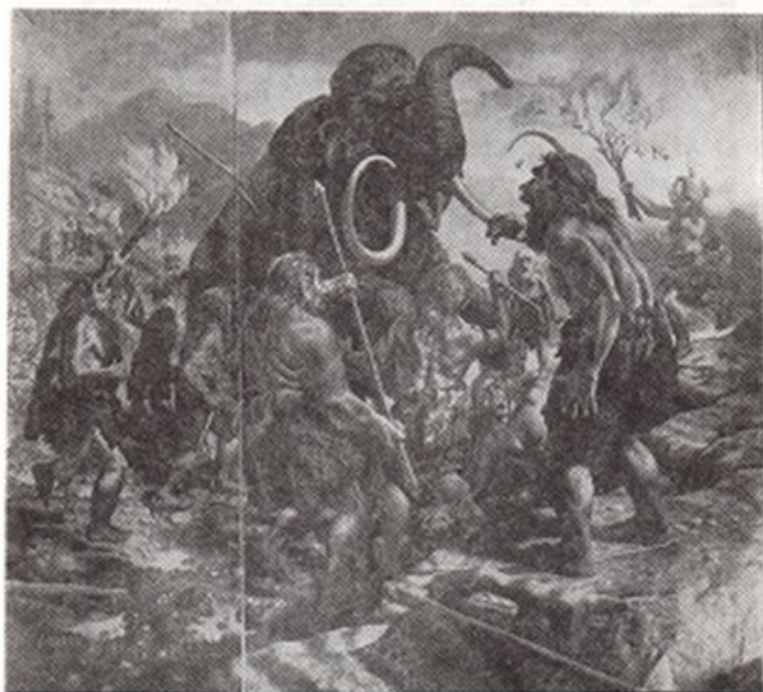
Resim. 3- Orta Paleolitikte bir Mamut avı.