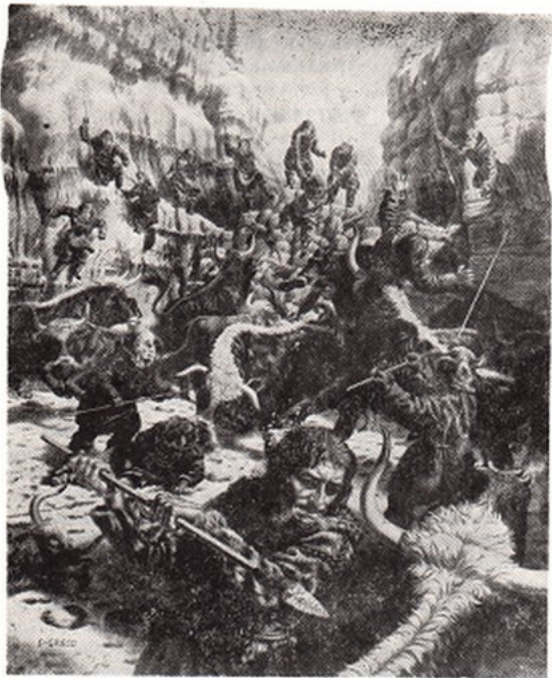
Resim. 6- Üst Paleolitikte Yaban Ökürü avı.