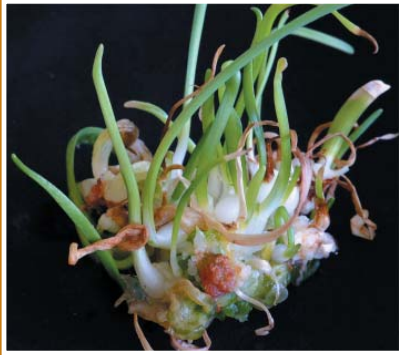
Doku kültürü teknikleri ile Geofitlerin çoğaltılması