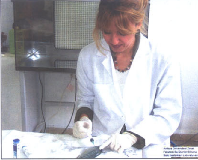
ANKARA ÜNİVERSİTESİ ZİRAAT FAKÜLTESİ BAĞIŞIKLIK BÖLÜMÜ BAŞKANLIĞI