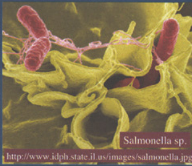
Salmonella sp. http://www.idph.state.il.us/images/salmonella.jpg

Kanatlı etlerinde dekontaminasyon amacıyla kullanılacak bileşiklerin başında organik asitler gelmektedir. Organik asitler fermente gıdalarda doğal olarak bulunurlar ve GRAS (Generally Recognised As Safe) maddeler grubunda yer alırlar. Mikroorganizmalar üzerine en yüksek antimikrobiyel aktiviteye sahip organik asitler laktik asit ve asetik asittir. Ayrıca laktik asit tüm et türlerinde doğal olarak bulunmakta olup, kanatlı etlerindeki miktarı 10 g/kg düzeyindedir. Organik asitlerin gıdalarda kullanımı genellikle güvenli kabul edilmekte,