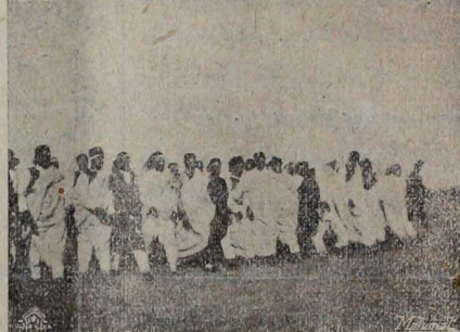
بنغازی — شهرده بولنان اهالینک اجرا ایتمکدری ایلیق تعمیرلری

اولدینی حقنده ایراد اولنان برسؤاله جواباً میستر چیرلین ، معاهده مذکورده نك تصدیق اولنه جتی وارسته شهیه اولدینی وشاید معاهده مذکورده تصدیق اولنیجه جتی اولورسه انگلتره حکومتك آنتیل مستلکه . سنک شکر صنایعی حمایه ایچون تدابیر شدیدیه توسل ایده جکی در میان ایلشدنر .