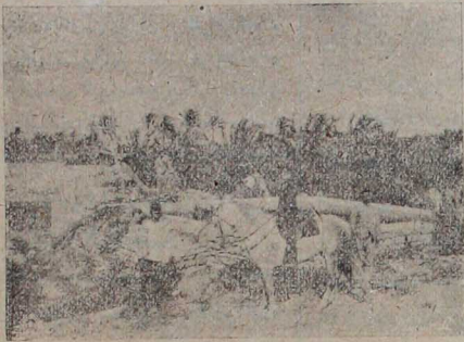
بنغازی — جهت شرقیده عرب بئجهرلی مناظرندن

لاهی : ۱۸ اگستوس — اوروپاده بولنان بوئر رؤسای ، ازمسنده مهم برخلاف ظهور ایلشدنر . بوئر جنراللری ایله محاصرلردن وهسل ، وولارانس واستاین معاهده صلحیه نك تصدیق اولوب بوسورتله اوروپاده کی بوئر رؤساستك ترانسواله عودت ایلجری موسیوقورکردن طلب ایتمکده درلر . موسیوقورکر ، دوقنور لهیدسك تئوتیق اوزرینه معاهده صلحیه یی تصدیقن اجتناب ایتمکده ومع هذا انگلتره یی اغضاب ایده جک برحرکتده بولنیجه جتی وعد ایتمکده در . ناپولی : کذا — ترانسوال محاربه سی اتمسنده برکوکالی مفرزه سنه قوماندان مشهور ایتالیالی سیرآلی ریچاردی ، بوئرلرک اسکاتی ایچون