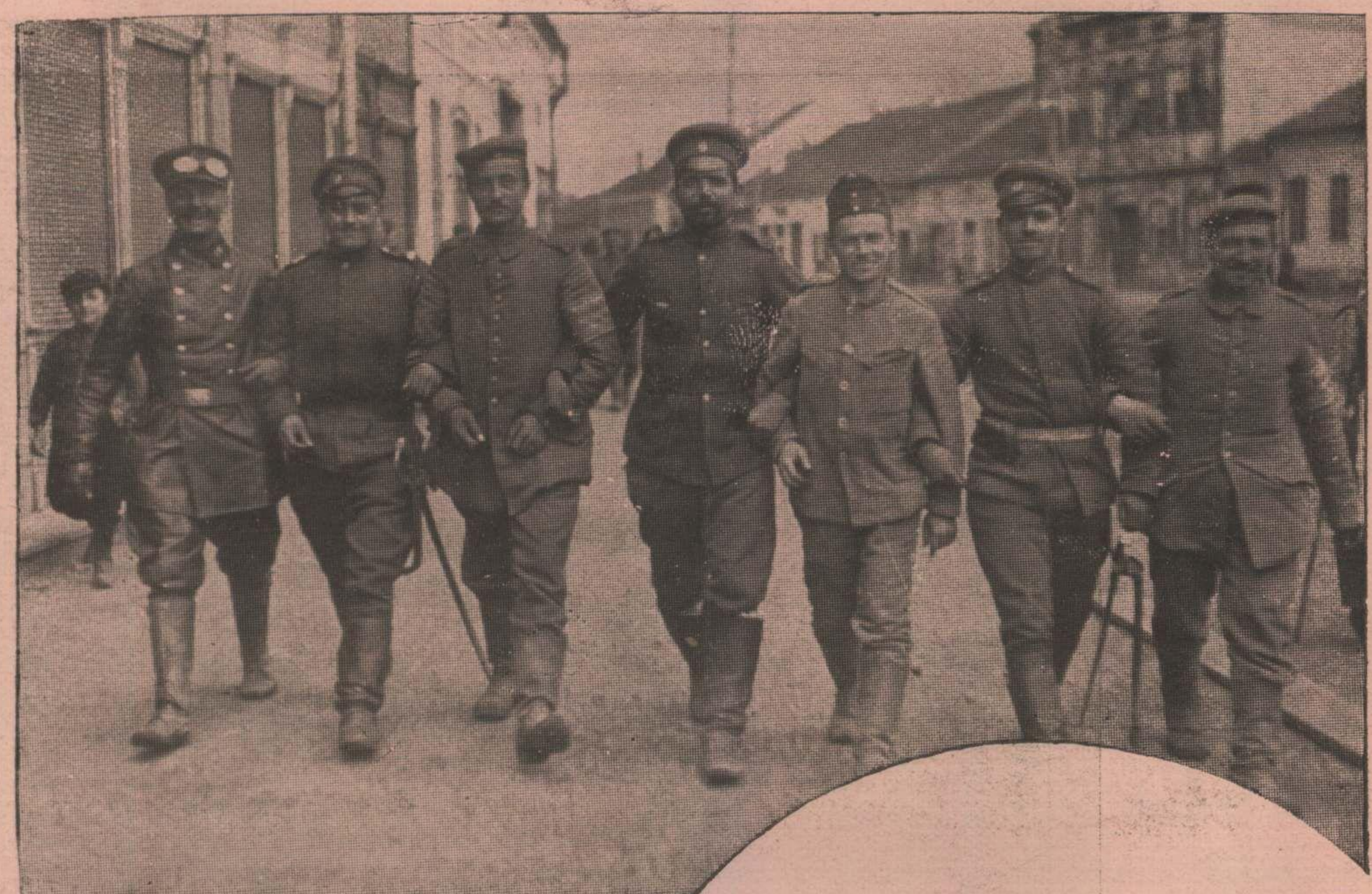
نیسده آلمان و بلغار عساکری Les soldats allemands et bulgares à Nich.

ا کتساب ایچون بوتون عزم و متانمزله ، ثبات و جسارت مزله صلح و صلاح ایستیرهک و بونی متادی بر صورتده عالم انسانیت و مدنیت ایچون تأمین ایلمک غایه سنی تعقیب ایده رک-جنکه دوامه حاضر و آماده بولو فحق صورتنده قبول و تلقی ایله یوزر .