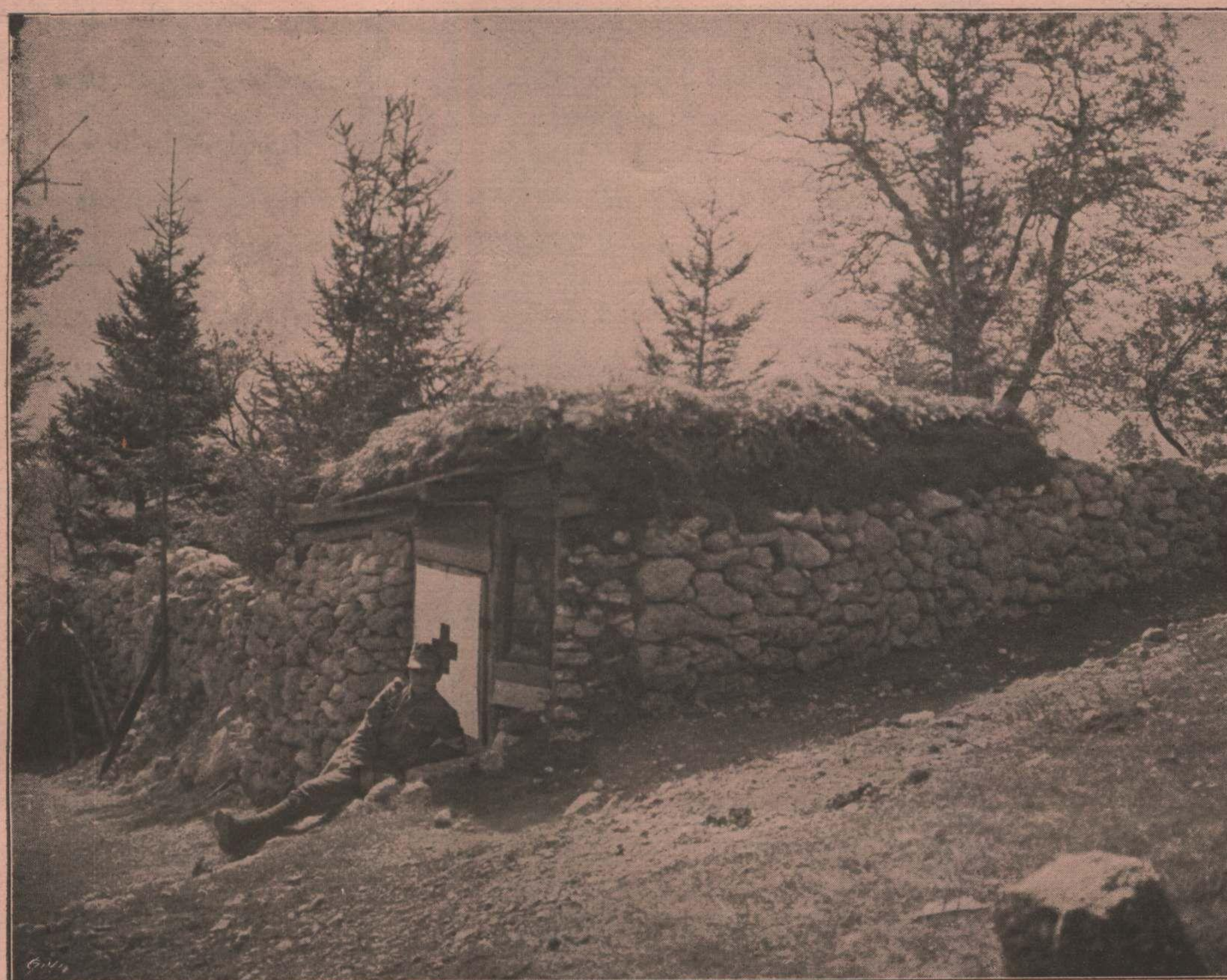
ایتالیان صحنه حربنده ، بوسك طاغ اوزرنده ، اوستريا و مجارستان صليب احمرينك بر معاونت مرکزی Une station de la Croix-Rouge autrichienne.