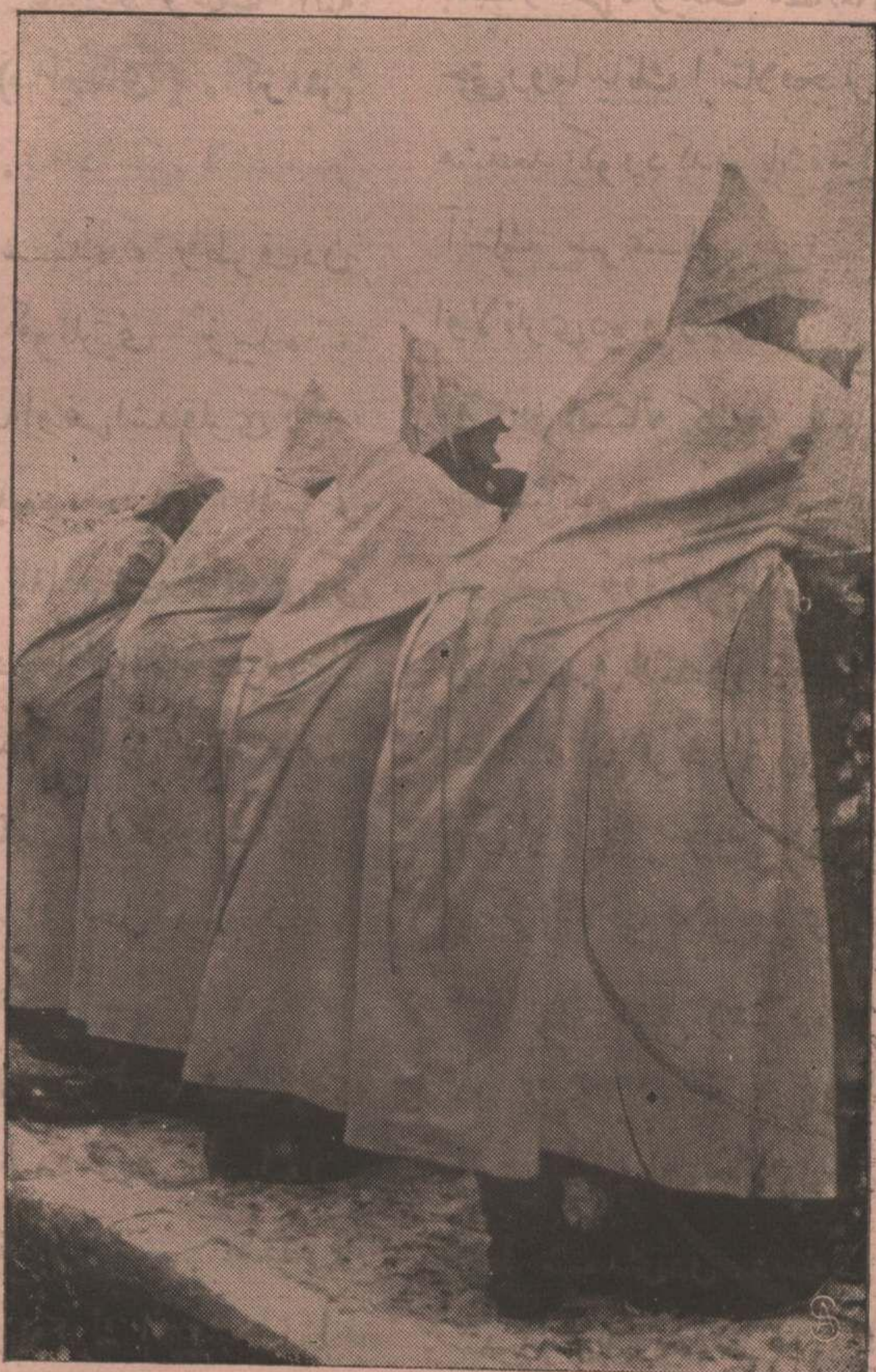
قارلر آلتنده کی سپرلرده دشمنک کورمسی منع اتمک اوزره بیاض اثوابلر کیمش اولان عسکرلر Les soldats en manteau blanc dans les tranchées couvertes de neige.

نیم رسمی بلغار غزته سی ، بونشریاتیله ، سلانیک منطقه سنده کی فرانسمز وانکلیرله قارشى واقع اوله جق هجومه بلغار اردولر- ینکده اشترک کنی صریحاً بیان ایتمکده در ؛ عینی زمانده یونانستانه قارشى بلغار دوستلنی حقدنده تأمینات ویرمک بالندیکجه یونانیلرک ، کنیدیلرینه بلغارلرک نه درجه ده دوست اولدقلرینا کلابه جقلرینا ده علاوه ایدیورر . یونانستانک وضعیت مشکله سیله برابر ، ائتلافچیلرک تعدیات و تجاوزانی یوزندن