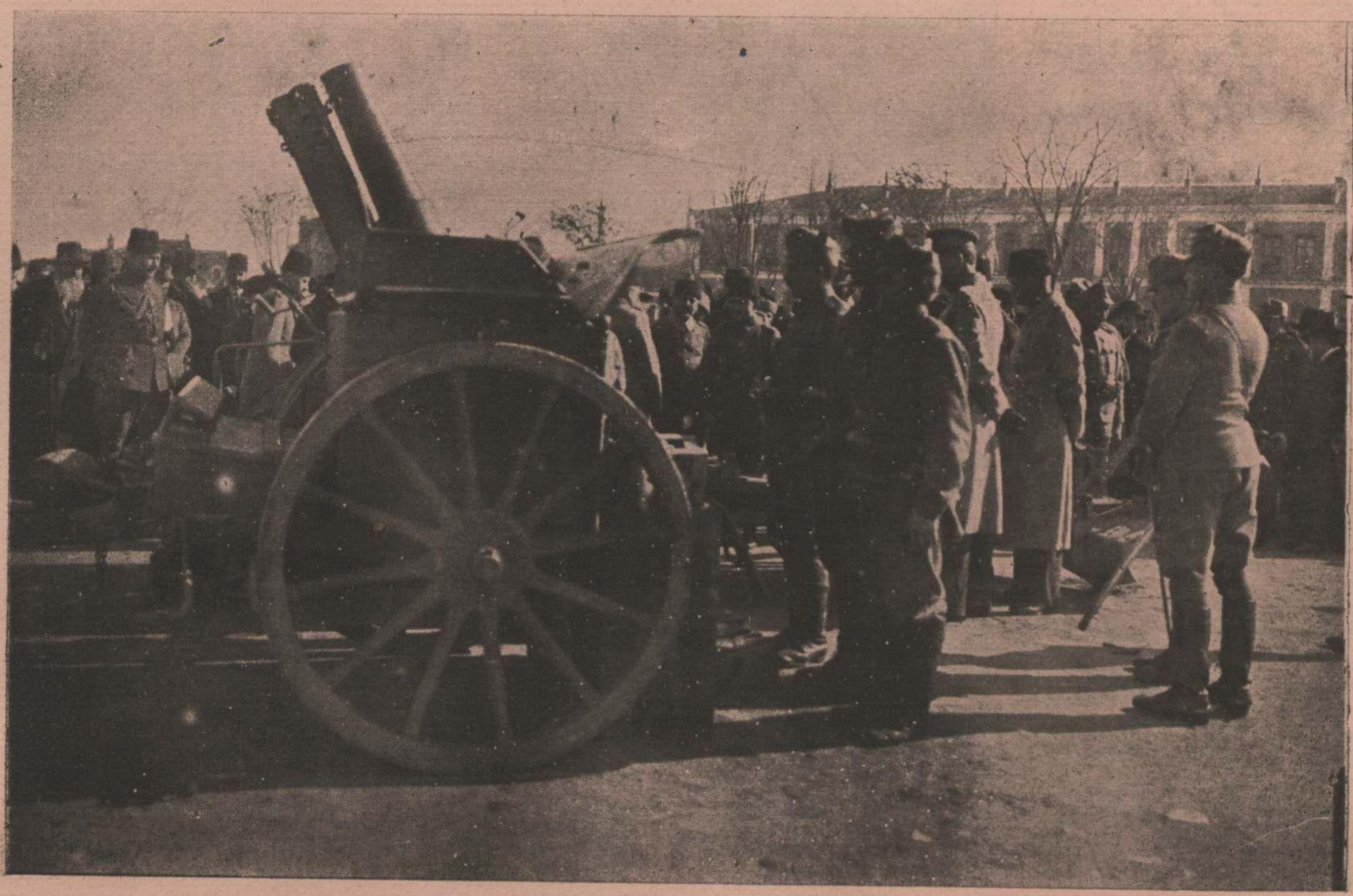
باش قوماندان وکیلی و حربیه ناظری پاشا حضرت تریله ارکان عسکریه طرفدن حربیه نظارتی میداننده یکی اوستریا اوبوس طوب بطاریه لرینك معاینه سی Les obusiers autrichiens au Ministère de la guerre.

دها نه قدر دوام ایدله چیکی سلیمه یوزر ؟ بلكه هیچ كیمسه ده سلیمه یوزر . فقط هر حالده دنیا بویه مدت مدیده محارب قاله چی دكلدر ؟ ابركچ شو مبارزه عمومیه بی بردور صلح و مسالمت تعقیب ایدله چیكدر . حرب دوام ایدلیکی ، باخصوص ، بوموسم بهارده ، بویك محاربه لره ، قطعی ضرر لره ، مهم نتیجه لر استحصالی امید ایدلیکی بر صره ده صلح دن بحث ایتك عبث كورولسه ده ، زمان زمان ، بر تأثیر تسخیر قاری اولان بولگه نك یاد و تکرار ایدلمسندن ده فراغت اولونما یور . بودفعه ده بلغار فنونلردن « میر » بو مسئله بی میدانه قوتقه ، شویوله مطامات یور و تمكده در : اوروپا ملتلی محاربه به کیریشه لی بر بوچوق سفینه اولدی . بویك سوزلر ، ده ماهاربه ترتیب اولوندی سولیه بن یکی پلانلر ، حرب میدانلرنده جریان حادثاتی و حقایق اشیایی تبدیل ایدمه دی . كوزل جمله لر ، حربده برایشه یاراما یور . اوروپای مرکزی دولتری غالبدر . ائتلافك صوك امید ایلوقه ایله صلحه اجبار ایتك ایكن بولمورده اقول ایتدی . جمامیر متفقه آمریقانك ، ایدله چیك و دیگر بی طرف حكومتلرك برو تستورلی قارشینده انكلتره بویون نه ككده ، و بی طرف لیمانلره قارشی ایلوقه اعلان ایتك تصور ائندن واز كچكده مجبور اولدی . ائتلافك بو حرب عمومی ده یكانه امید ، او كزده کی ایتك بهارده وقوعی تخمین اولونان قانلی و شدتلی محاربه لرك نتیجه سفینه مربوط قالدی . معافیله ائتلافی تشکیل ایدن ملتلك كندیلر ده ، ایتك بهار محاربه لرینك ، اوزون مدت بری بلكه دكاری قالیقی كندیلرینه توجه ایدله چیكنه ایتانما یورلر . بو یوله بر ظنلری وار ایسه بیله بك ضعیفدر . ائتلافك شیمدی به