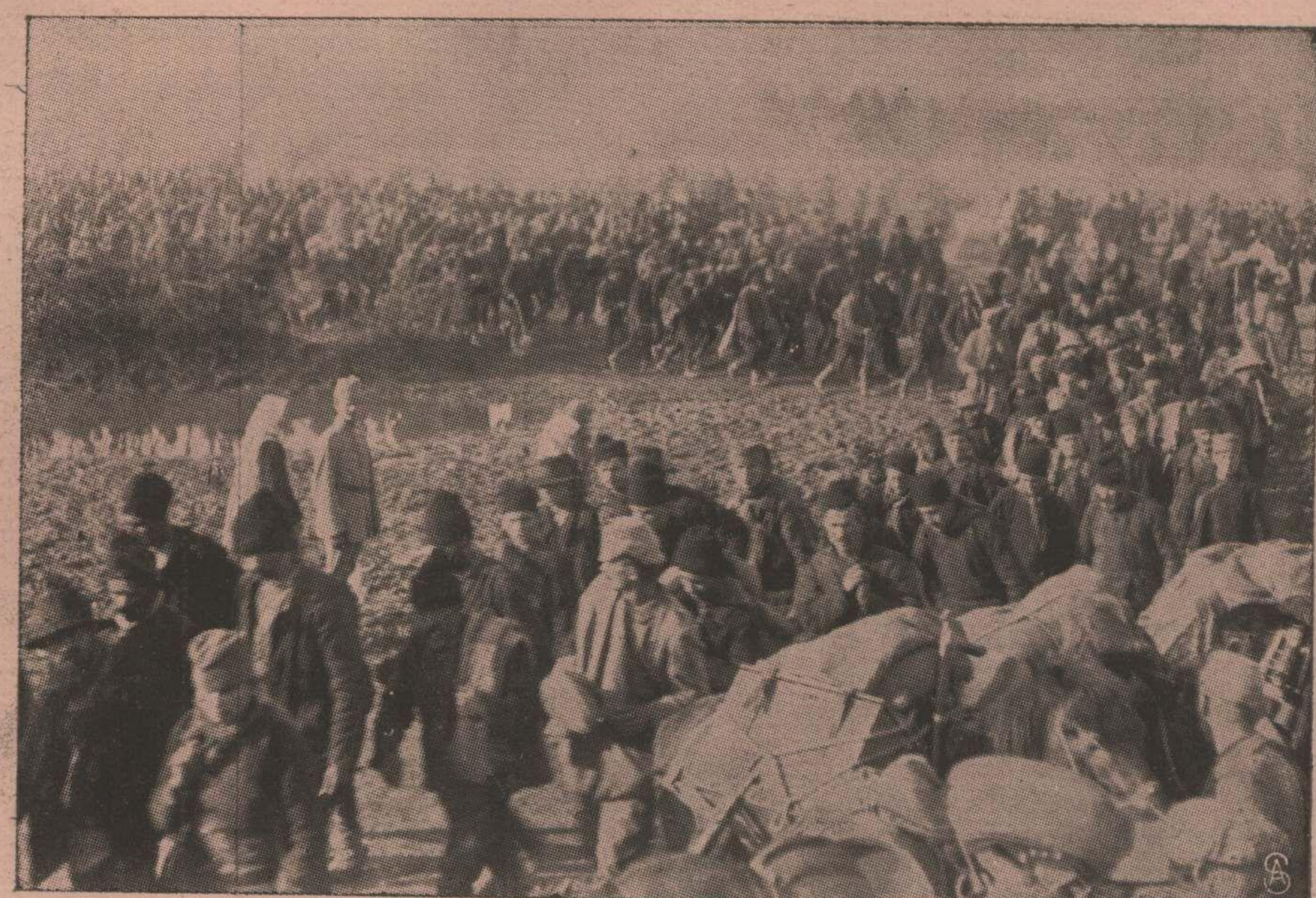
صرب اسیراسی Les prisonniers de guerre serbes.

عدنده انکلیرلرک وخیم موقعی قاهره دن ( کولنیشه چایتونخ ) . اصل اولان معلوماته کوره ، اورایه عدنده انکلیرلرک وضع و موقعی صوک درجه وخیم واندیشسه ناک بولوندیغنه دائر خبرلر ورود ایتمشدر . بوخبرلرده ، انکلیرلرک وضعیتی بک مهلک اولدنی ده علاوه اولومشدر . مجروح اوله رق اورادن کیش بولونان انکلیرلرک ضابطلری ده وضعیت و خامتی تصدیق ایتمکده بولومشدر در .