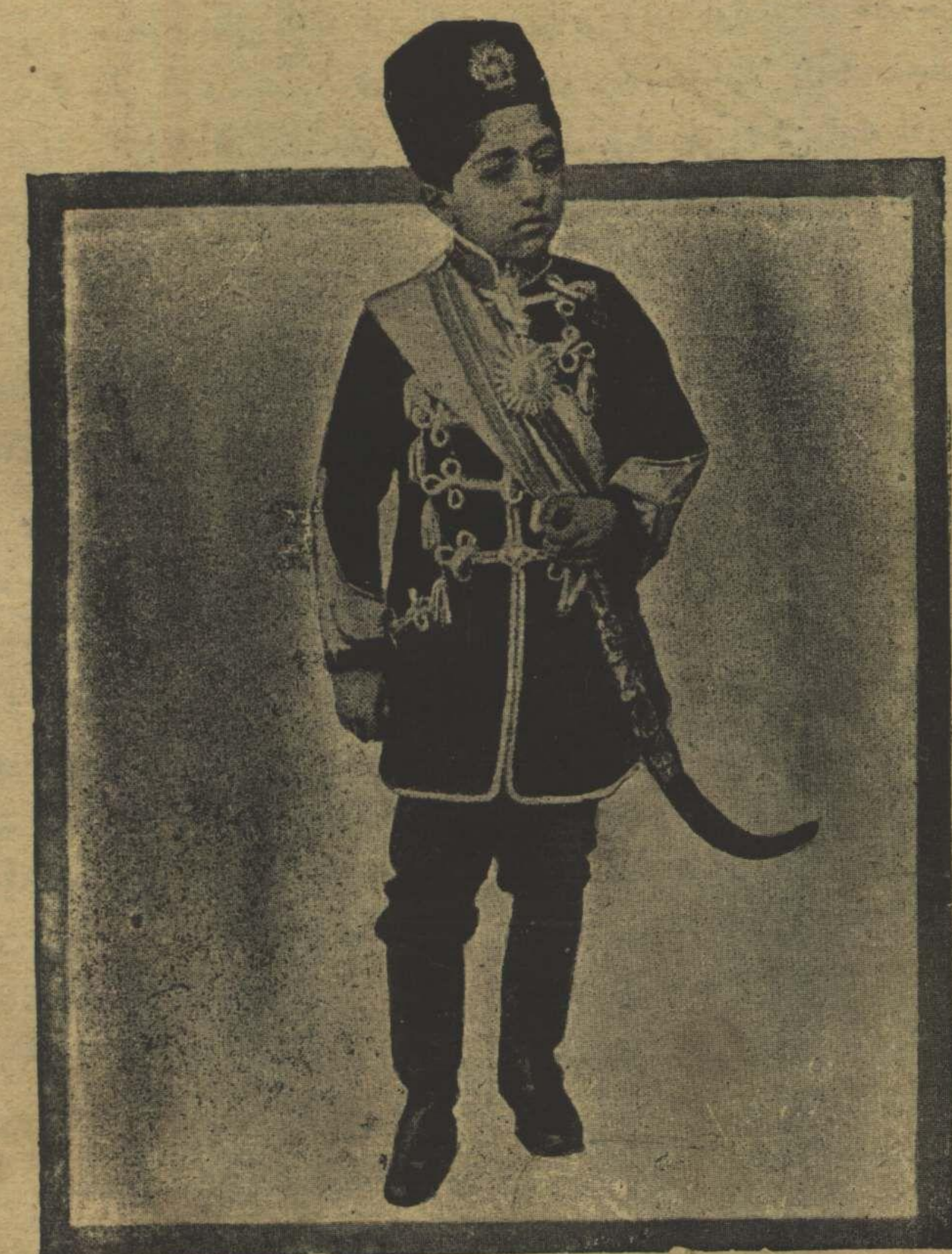
استانبولده مسافر رض شاه ايران حضرتلي نيك زمان جلوسلرنده كي تصويرلري Le Shah de Perse à son avènement.

بونيائتسز عالمي حيات اينچنده آتجق نهائيتسز بر تولوم ساكن اوله بيلدي . بيلم ، آهنگ آقا حرمت ايجونميدي ، شيمدي هيچ بر رض لايردي ايتك ايسته . ميوردق . صمت محيط پك لرضي كليله شدي . موجود بشلرض صرده بر سكوت اينچنده متنفس بر رسكوتدي ... اوزمان حس ايتدم كه بو طريقي مضمومك اوچنده بلده كربلادن باشقه منزل بولونه مازدي !