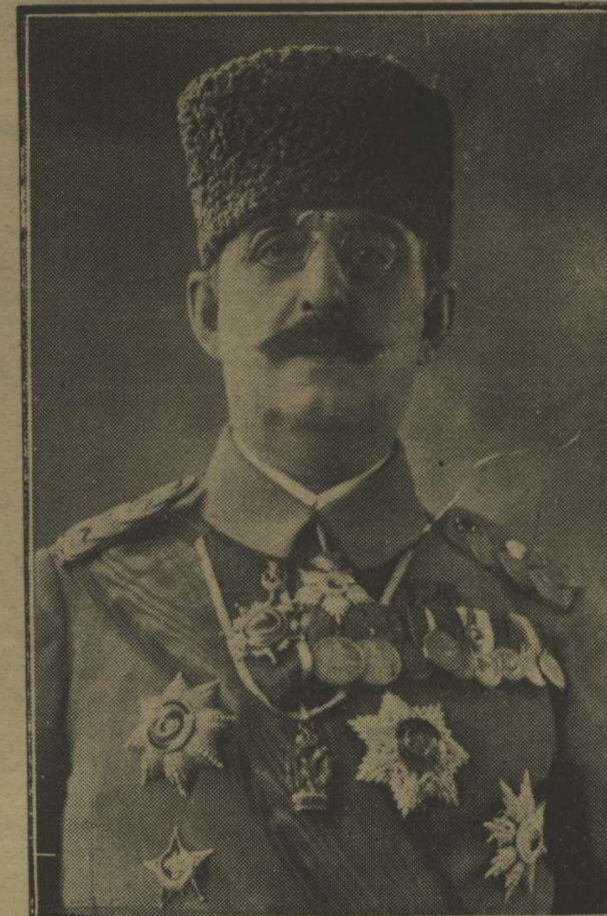
حريه ناظر جديددي سليمان شفيق كالي پاشا حضرتلري S. E. Suleiman Chefik Kémali pacha, le nouveau ministre de la guerre.

واراده اوچ سنه دوام ايدن مدت مأمور بننده اردوي هابون طويجي قوماندانلي و كالتنده افقاي خدمات ايله مش و ۲۱۲ . سنه سي او اخرنده طرابلس عرب طويجي قوماندانلغنه و او ائشاده ظهور ايدن يونان محاربه . سنه تساليا ده متشكل جبل بطاربه لر قوماندانلغنه كلش ايدي ۱۲۱۳ سنه سنه دردمجي اردوي هابونه و ۱۳۱۵ ده طوخانه عامره ديوان حرب دائمي اعضالغنه كلش مأمورا اعزام ايدلش ايسده اعلان مشروطي متعاقب چنانجه ايكنجى لوقوماندانلغنه بر آرز صكره اسكدار جهق قوماندانلغنه تعين اوله روق ۲۱ مارت هائله سياسي . سنه اسكدارده قطعه سي باشندن آيريليه روق اسكدار جهتده انتظام و اسايشي موقبيله تأمين ايتشدر ۱۰۲۵ ده حزران واسطنده مستقل عسبر متصرف و قوماندانلغنه تعين اوله روق محل مأمور بنه كيمش ؛ يالچين قبالقرله ، دوزخي چوللرده اراضيك مشكلات طبيعيه سنه و وساطت ماده و معتوبه نك فدائنه رغما ادريس سلسله محارباتنده خدمات فوق العاده ابر ايتمش و بيك