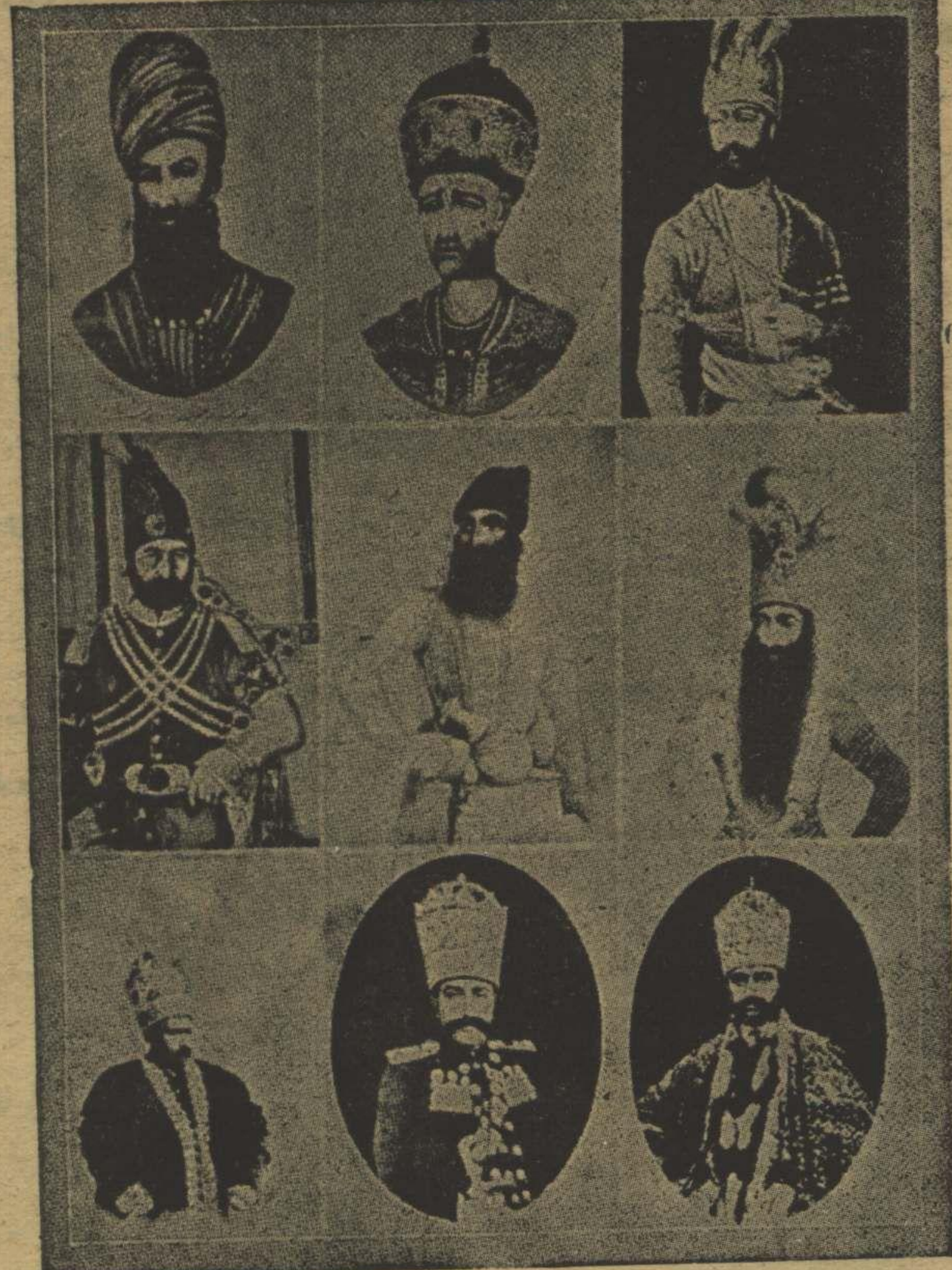
ايرانك قاچار خاندان سلطنته منسوب شاهار La famille royale Katchar de Perse.

آرتق چولك بوشلني ، فخرليكي و چيلاقلني بتون با سيله كوروندي . نه بر قوش ، نه بر بوجك ، نه بر يراق ... راكد بر قوم درياسي سكوت ضيا آتنده صانك طوغندي . بزه اويله كليوردي كه