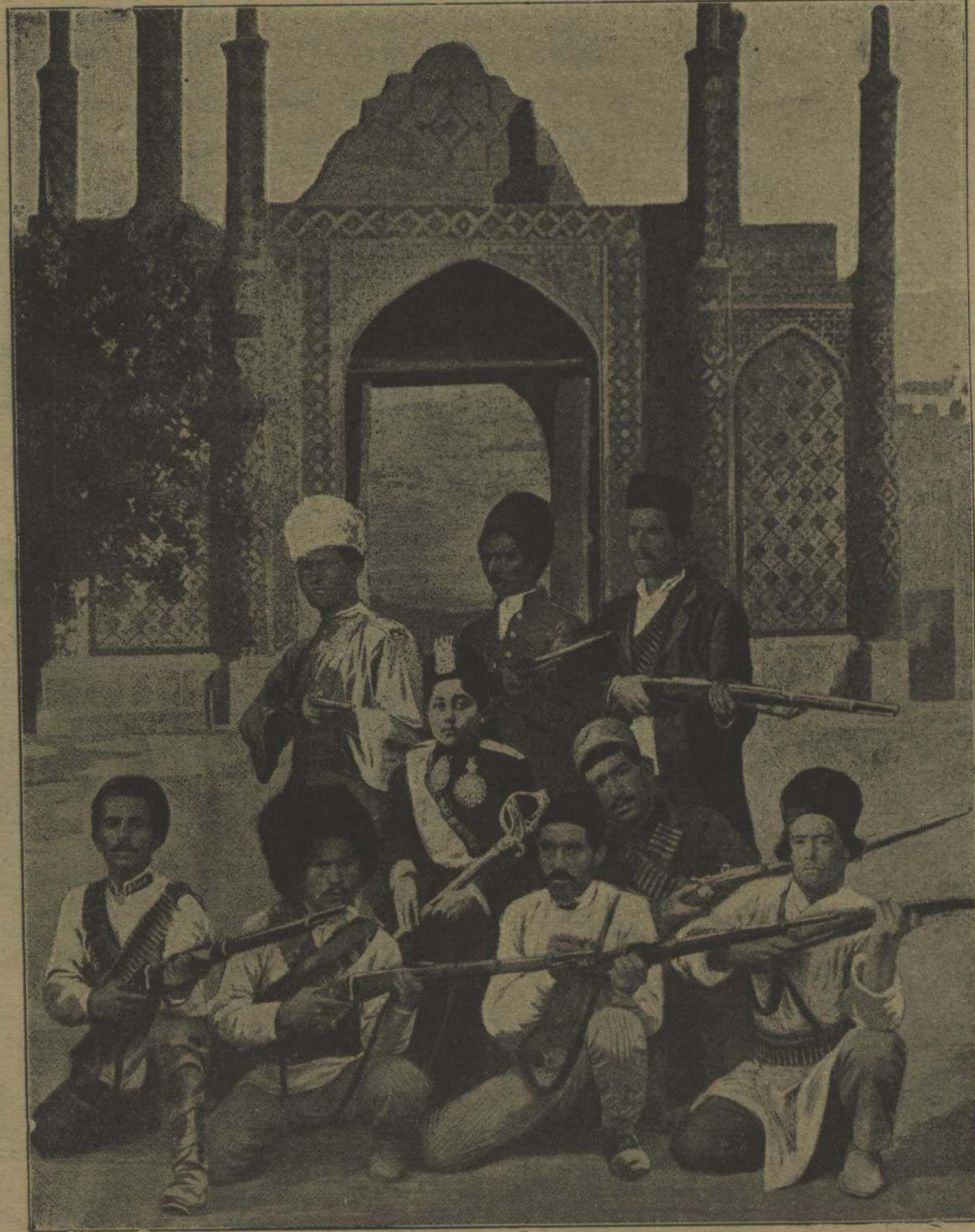
طهران منظره سي : شاه ايرانك سلاحشورانيه برلكده تصويرلري Le Shah de Perse avec sa suite à Téhéran.

پيداسنه موق اولمش و ابن السعوده مخالف اولان و اتحاد جيق دعوا سنده بولونان ابن الرشيد و عجم سمعون طرفدار ايدنك بصره بيللا واقع بر تعرضلري اوزرنه زبيره قصبه سنه عسكرله كيدرك اوراده بولونان اتحاد فلو بنده اجتاع ايدن اشقيانك سوز ديكله مسمي و عسكروه سلاح استعمالنه قيام ايتسي اوزرنه مذكور فلوي طوب آتشيله خاك ايله بكسان ايتمش و سونكو عجميله قصبه بي اشغال ايله حكومه قارشى كلان خذله بي تيه له مش و كيقق باب عالي به عرض ايله مش و الدين جوايده عجم سمعون و ابن الرشيدك اصداقاي دولتدن اولدنلر دن بونلر حقتده في مابده حسن معامله ايدلسي و عين زمانده اسايشك محافظه سي اصر اولونقله ولايتدن استمفا ايتمش و بالاخره عزل و تقاعده سوق اولشدر .