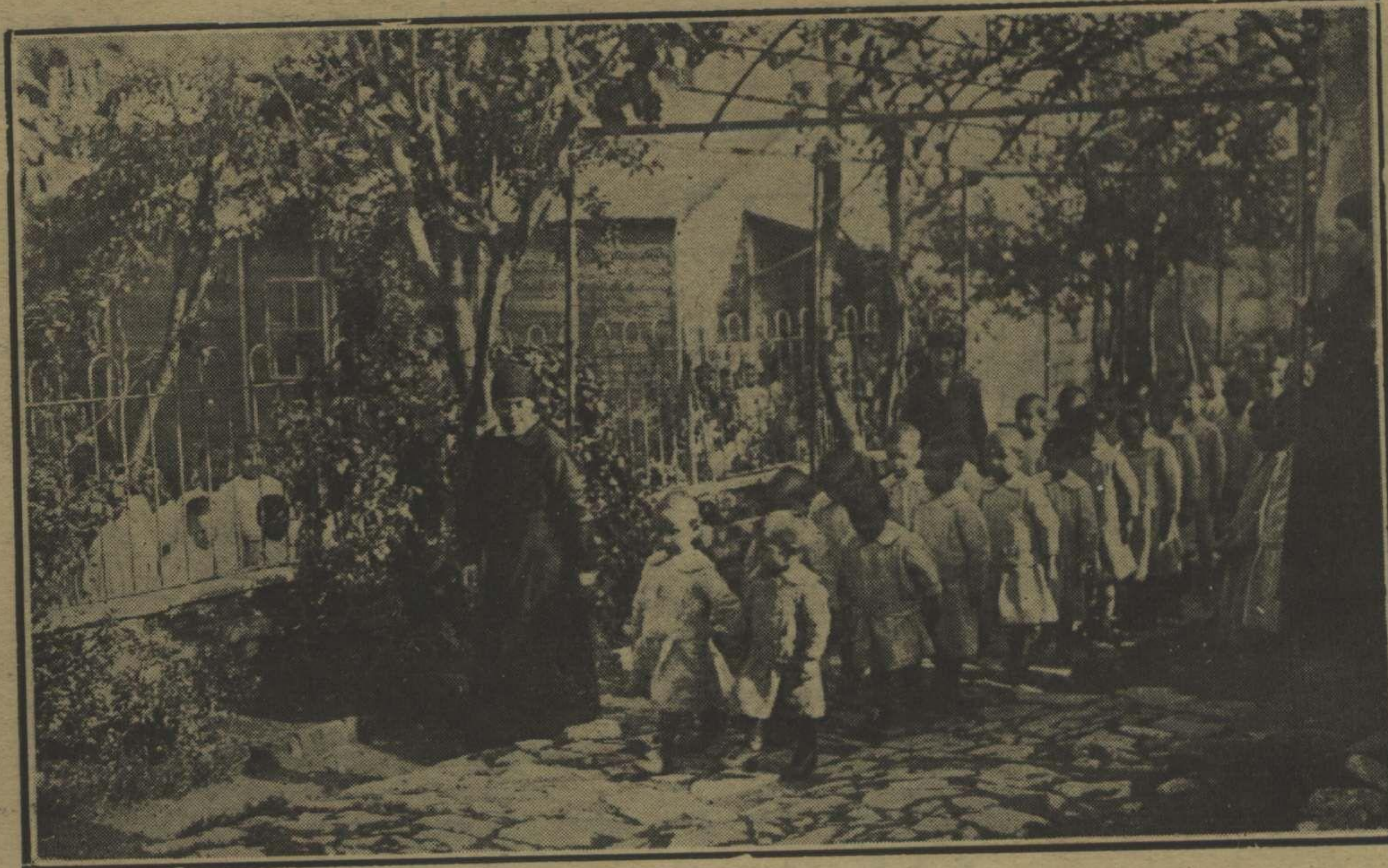
حمایه اطفال جمعیت خیریه سنک آثار حسناتندن La Société de la Protection de l'Enfance à Constantinople.

تنورینی خانلره قارشى مسدود ولدیمرق عنادنن طب فا کولته سنک یاقینده واز کچه چکنی ده بسم عمر پاشا تبشیر و دیه بیلور که تأمین ایتمدی. هیئت اجتماعیه - مزک نصف معزلی عصرلردن بری دوچار اولدینی قلیچ مزعجمن نهایت قورتوله جق دیمک.