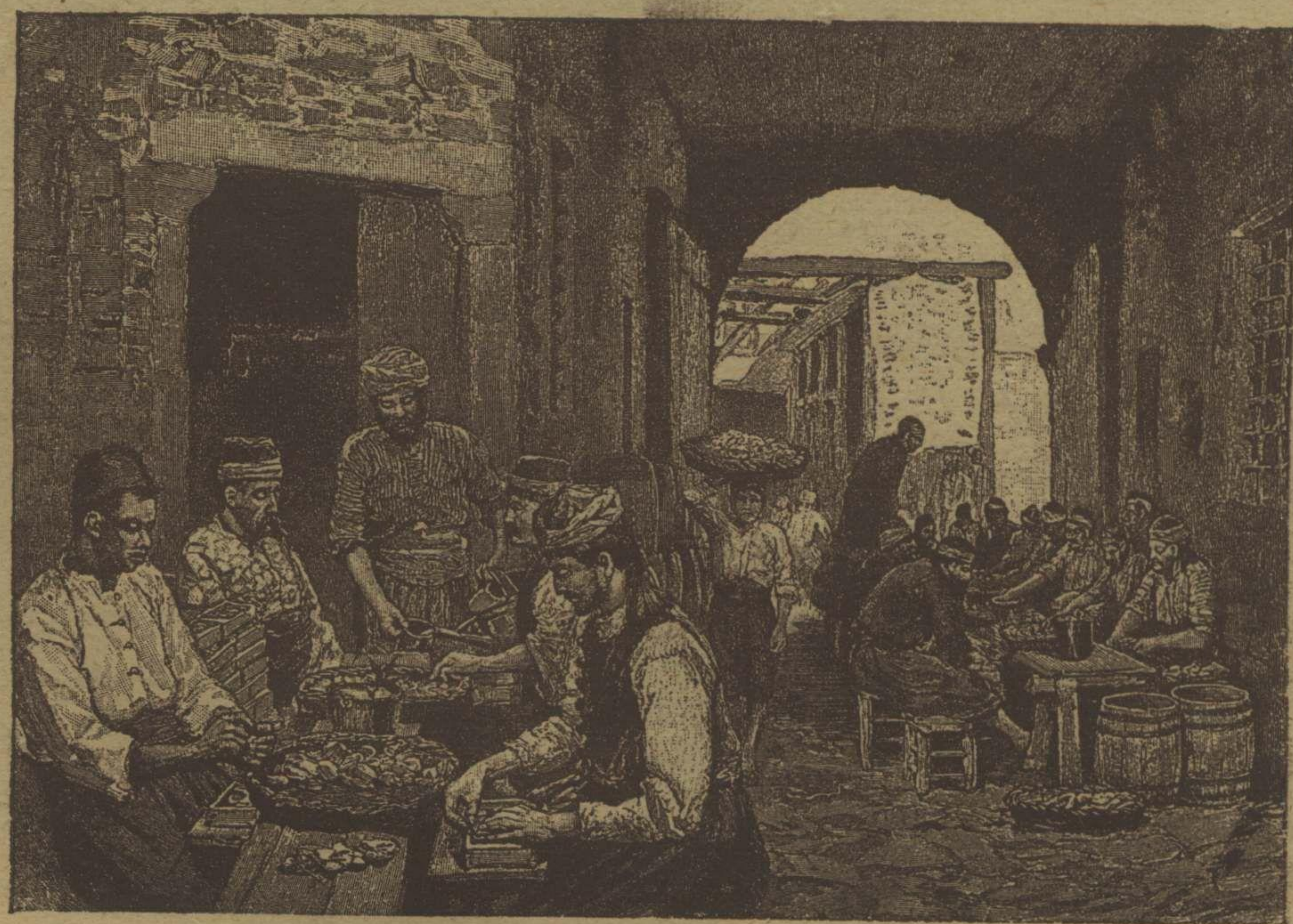
ازمیرده قورو ایغیر استحضاراتی Commerce de figues sèches à Smyrne , la mise en boîte pour l'exportation .