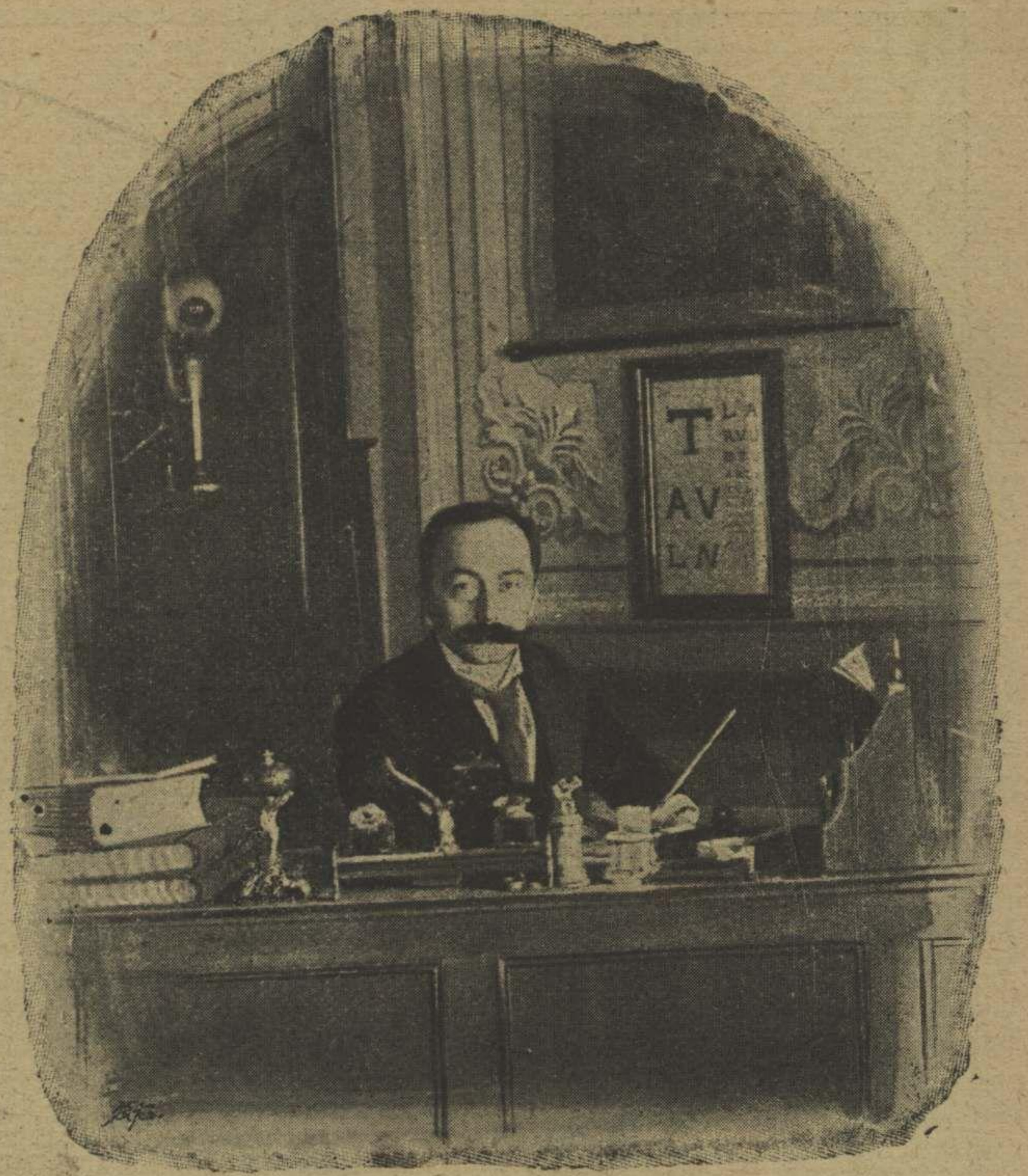
دوقتور اسعد پاشا

بیلر کچورکه، یا محمد، آیلر بزه هب محرم اولدی... آقشام نه کونشلی برکیجه بدی... ابواه، اوده لیل ماتم اولدی... عالم بوکون اوچویوز الی ملیون مظلومه یامان بره نام اولدی: