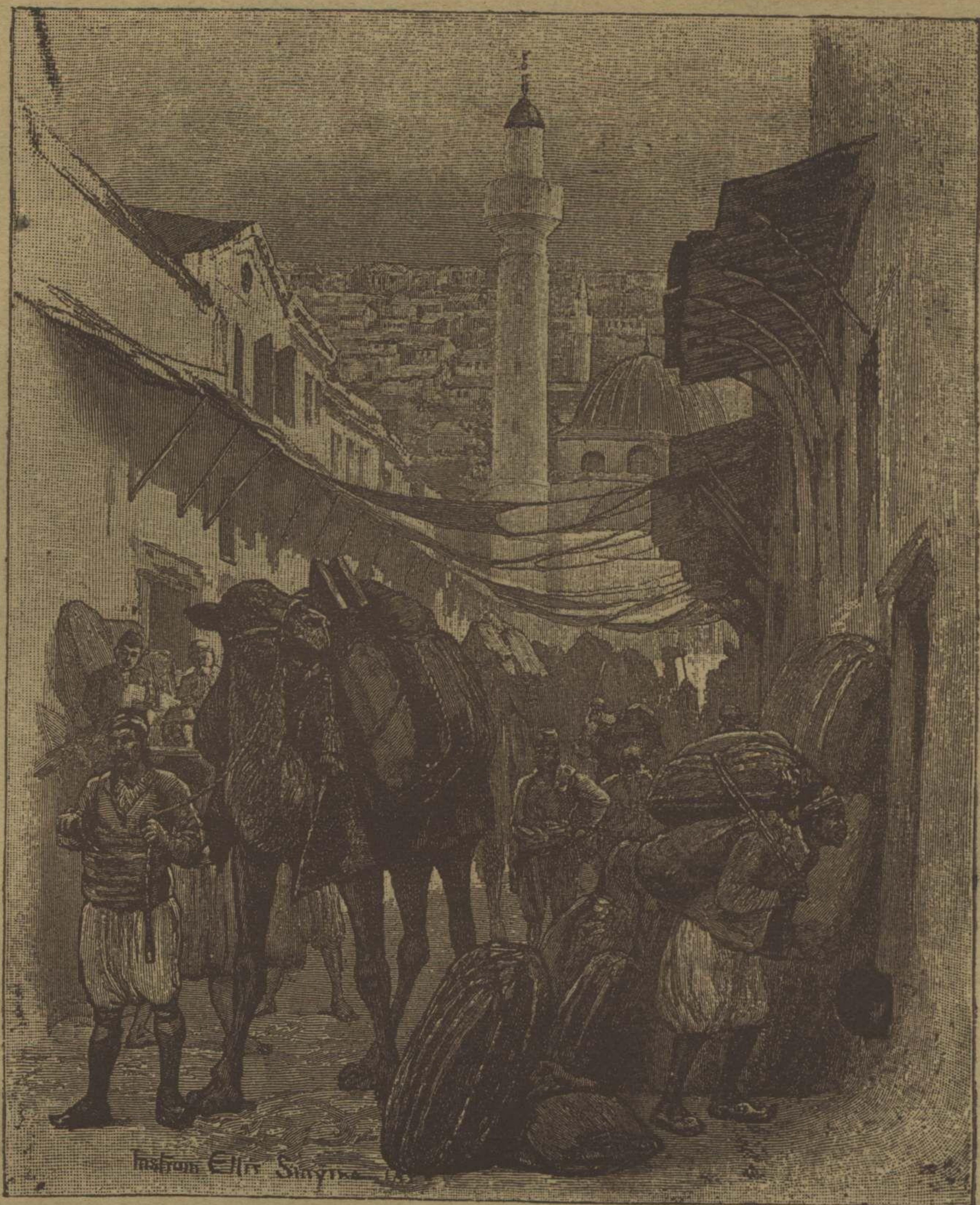
ازمیرده برسوقاقی وایغیر محسولی نقلیاتی Une rue à Smyrne

اولان دو حه ایمان ، علوم مثبتته تک صرصر تقنیناتیه بیقلمادی . اعتقادی تقلیددن تحقیقه ایصال