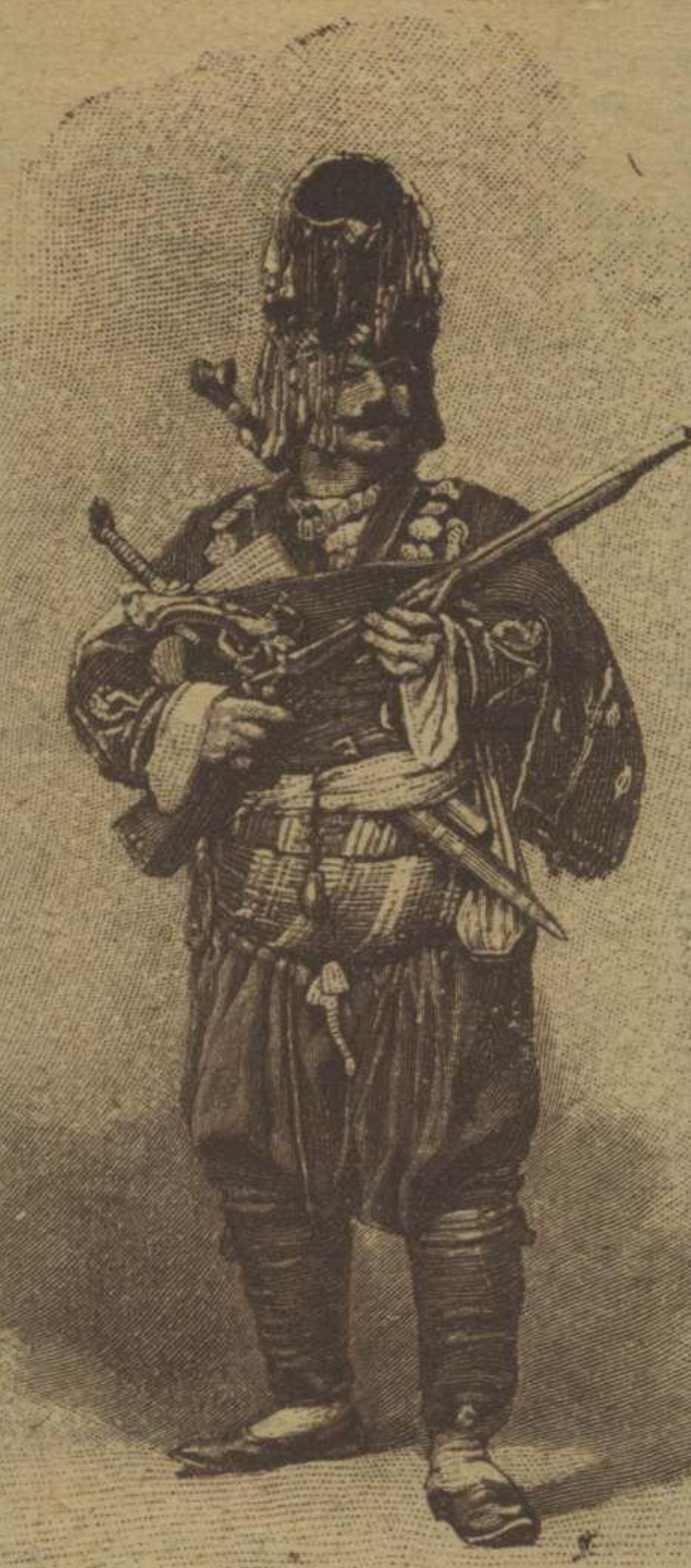
بر آيدنلى وطنداش زيبيك Ua Zeibek d'Aidin

موتاسندن زياره احياسنه حرمت ايدن شام اوزون عصر لردن بري حق افتخا... بيوك نولورندن آير : دون روضه صمدح الميريه ي زيارت ايمشسك ، بوكون تربة محبي الميريه . كيديوروز ، قهرمان سياستدن صوكره قهرمان معرفت .... معركه كي مدرسهنك ده قهرمانى واردر : صرقد صمدح الميريه ده سيف اسلامى سلاملا مشدق ، شيمدى شيخ اكرك قراكاره ابديسنده معرفت اسلامى سلاملا جهقدق .