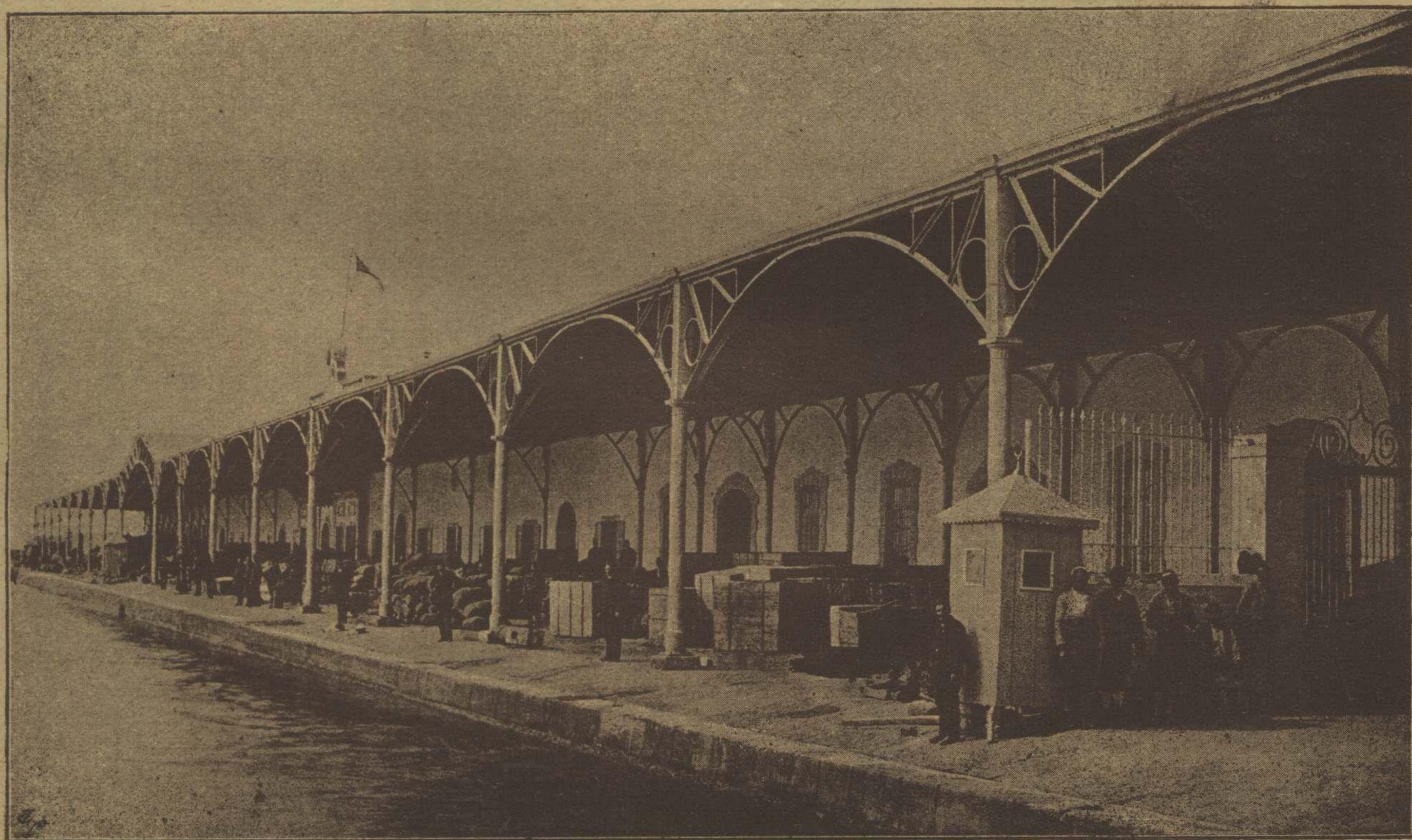
آناطوليك الك مهم مخرج اقتصادي و تجاريسي اولان واليوم يونان اشغالنه اوغرامش بولنان از مير شهي منظره لرندن Le qual de la douane de Smyrne

— اووخ ، حضرت ، هر عصر سنك كرمي خاطره كه بيكي بر قدمه اولور ؛ سنلر تعدد ايتدكه سن بو كسلورسك ؛ انسانيت كاله يانلاشدجه سكا باقلاشه جق ؛ نور عرفانمز قوتانديك سسك