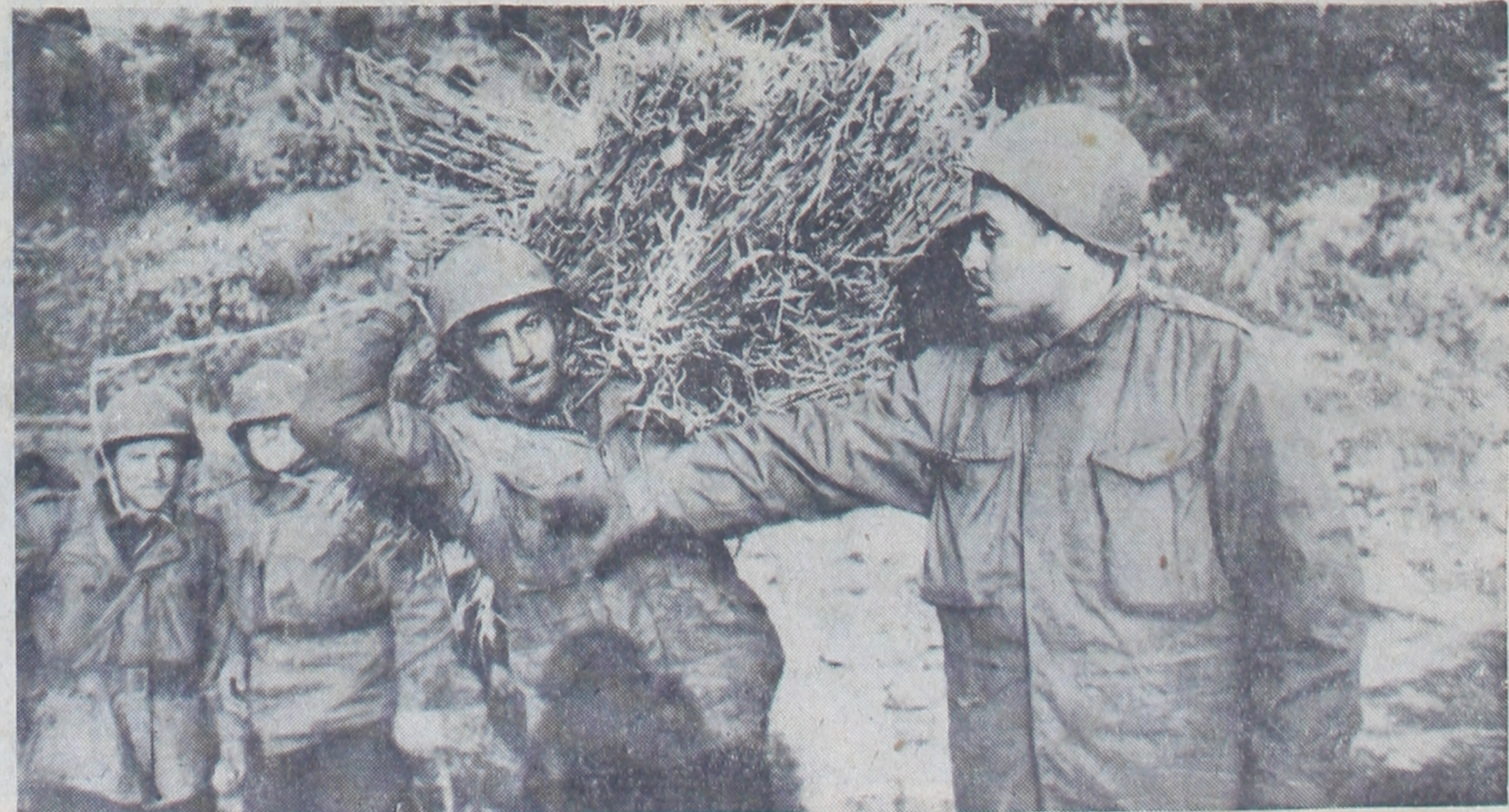
Kamufflaj için hazırlık