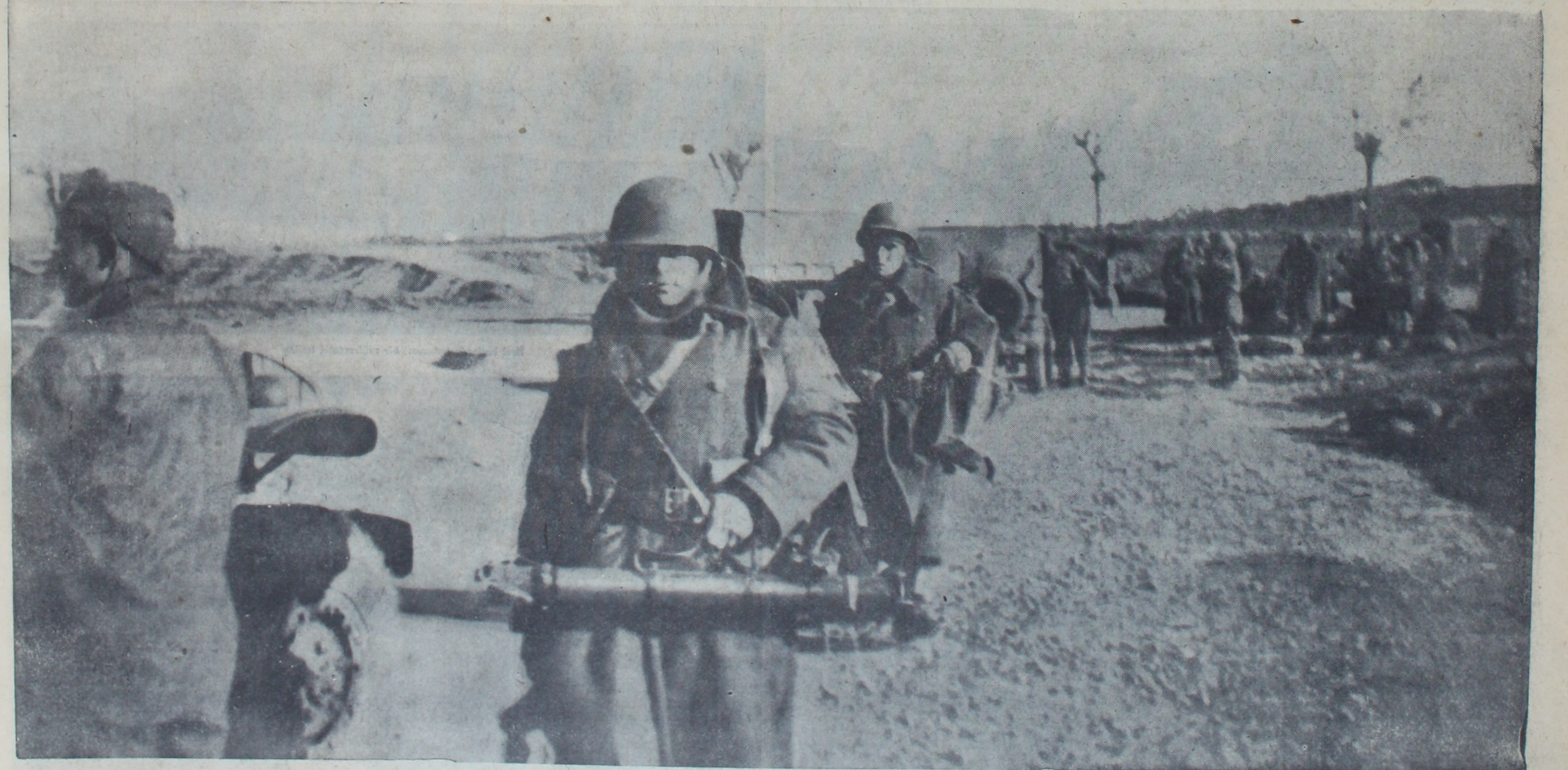
Kuzey Korede dondurucu bir soğukta cephe hattına doğru yol alan Türk Savaş Birliğinden bir takım

Bir yepyeni âyet gibi, efkârı uyandır, Dünya, bunu bekler, koca Türk hayli zamandır.. FARUK ŞÜKRÜ YERSEL