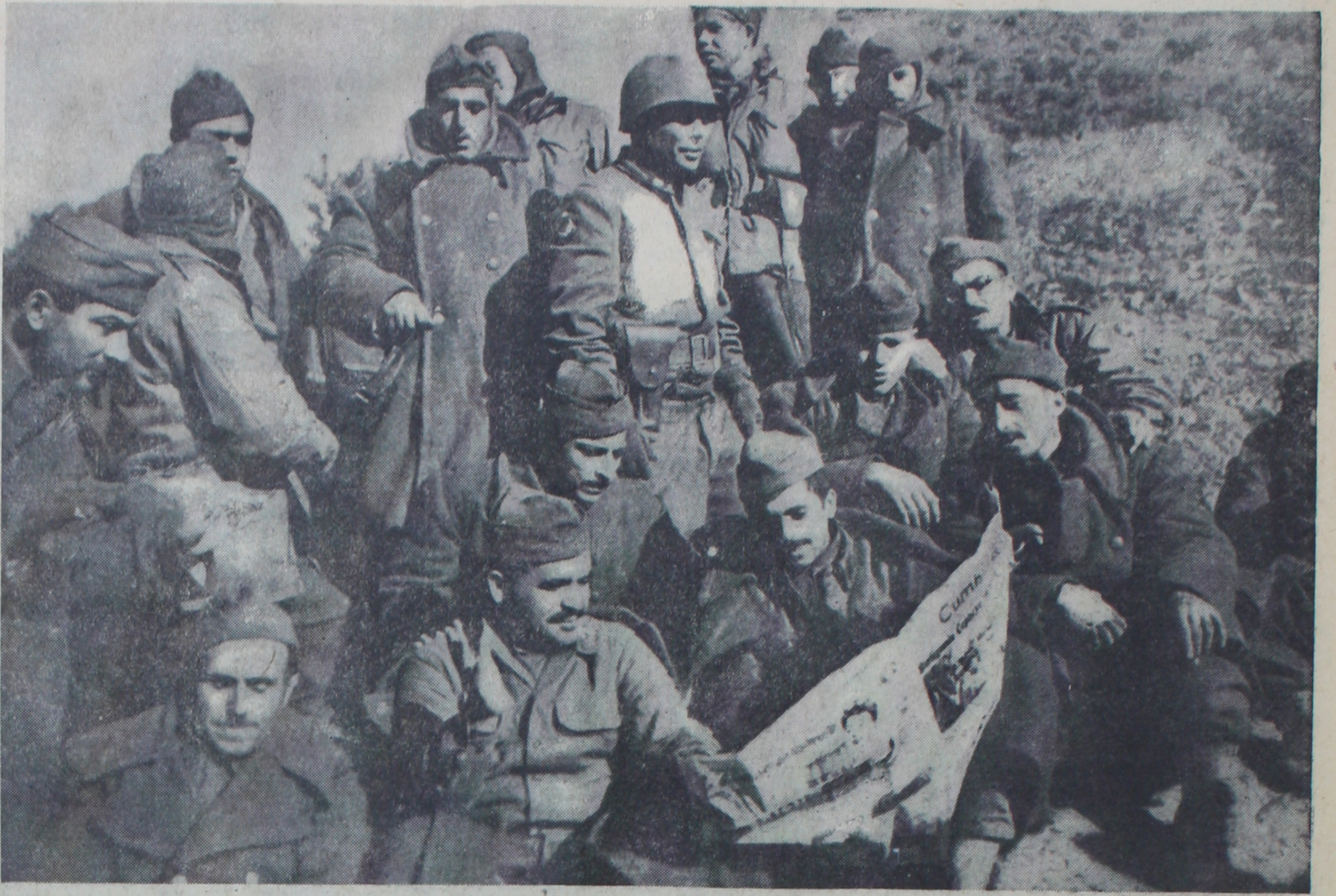
Cephe gerisinde erlerimiz istirahat esnasında. Askerlerimiz (Cumhuriyet) gazetesinde Anavatandan gelen mektupları okuyorlar