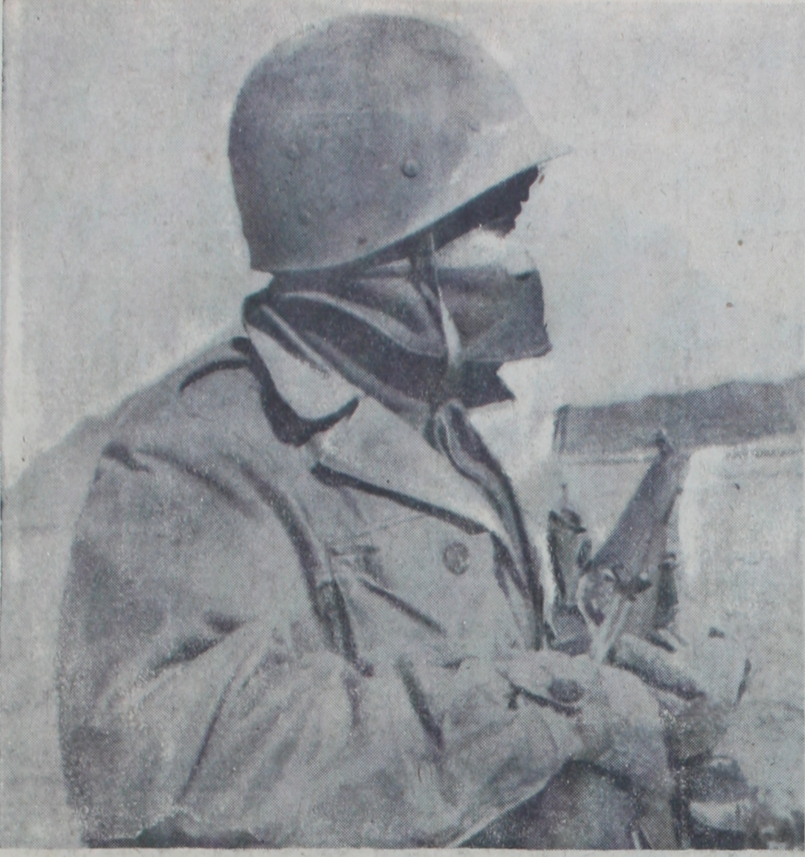
Kuzey Kore cephesinde iyi teçhiz edilen bir Türk eri, silâhı elinde düşmanı bekliyor