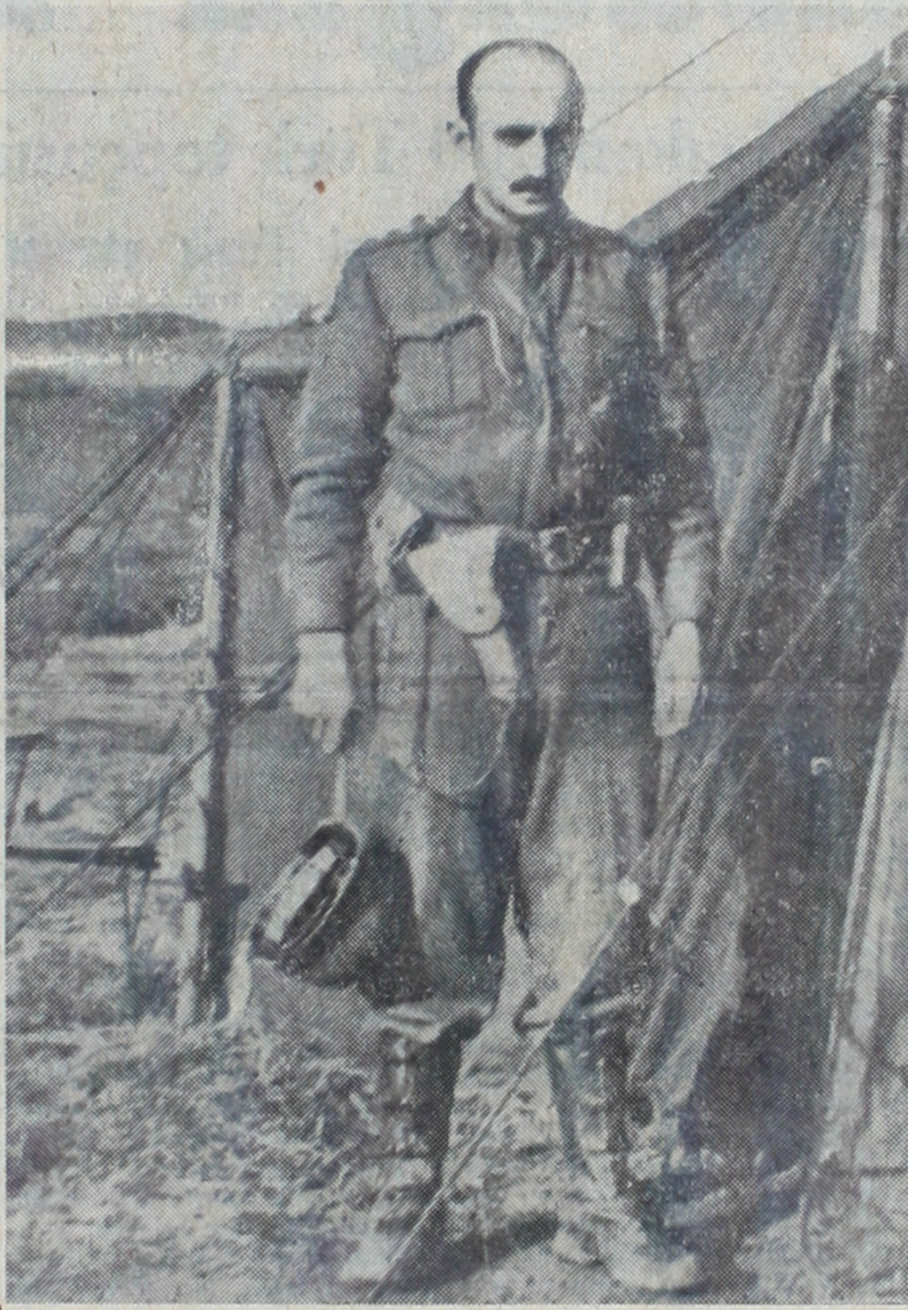
Kuzey Kore cephesinde bir Türk subayı çadırının önünde