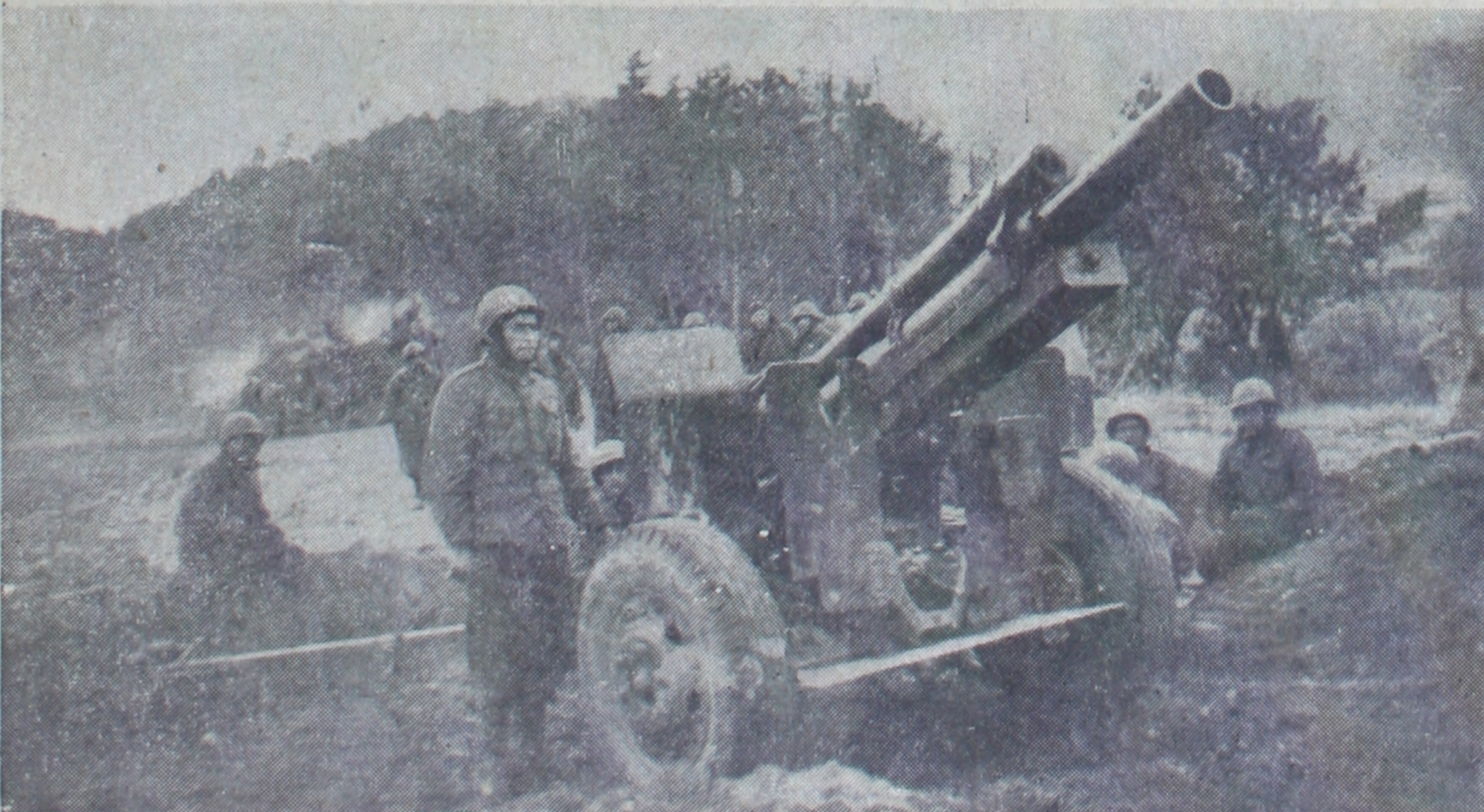
Kahraman topçuları mız vazife başında