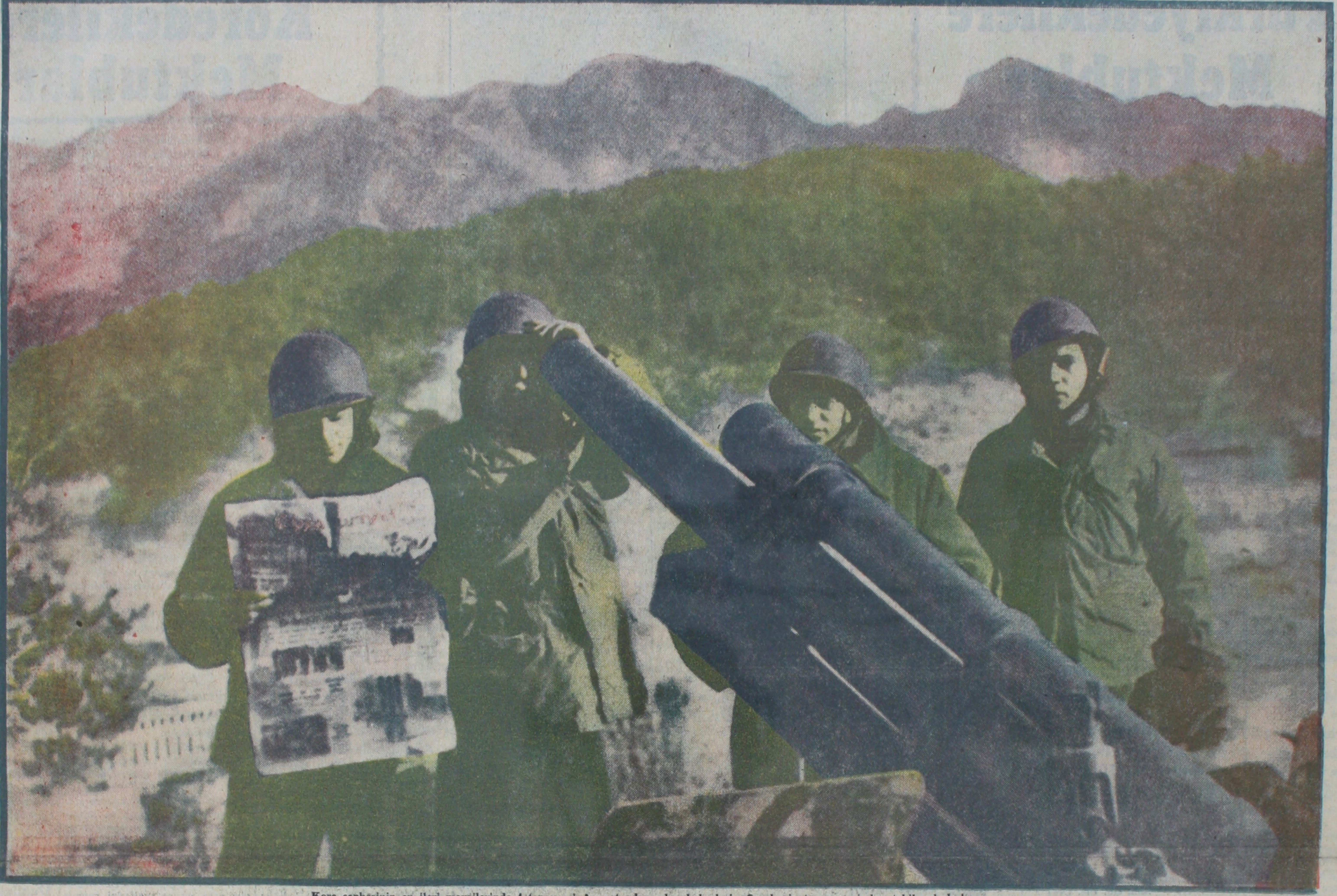
Kore cephesinin en ileri mevzilerinde 4 topçu eri Anavatandan gelen haberleri «Cumhuriyet» gazetesinden takip ederlerken