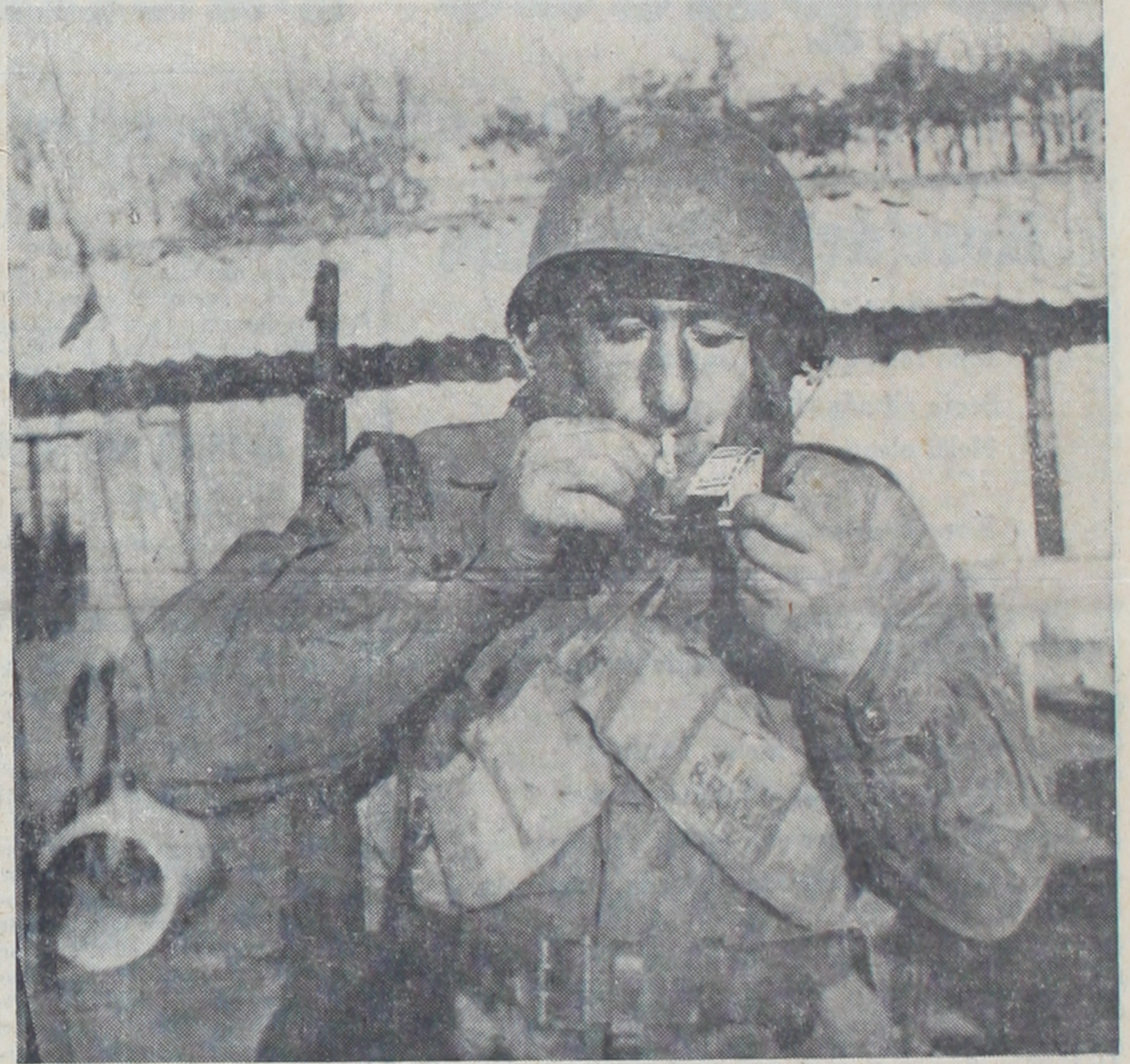
Korede savaşan Türk askeri çok güzel teçhiz edilmiş durumdadır. Yukarıdaki resimde Amerikan kibritleriyle bir Amerikan sigarası yakan erimiz görülmektedir.