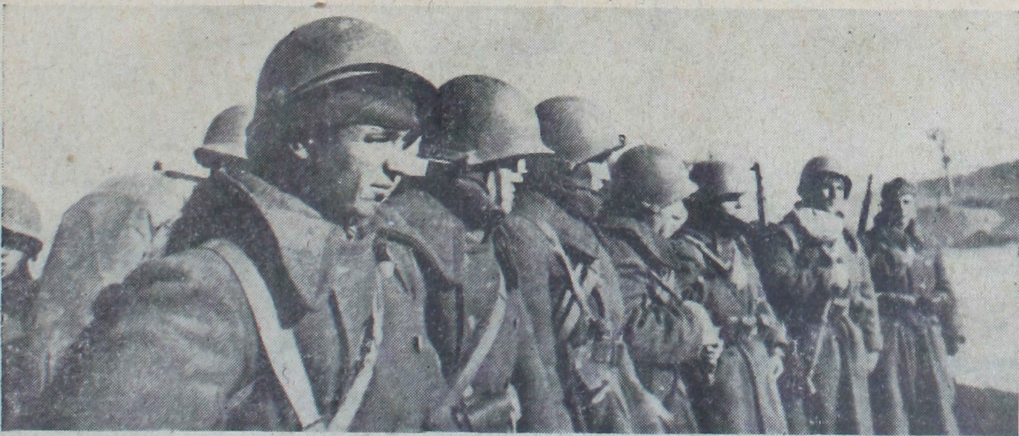
İleri hatlara hareket için emir bekleyen kahraman askerlerimiz