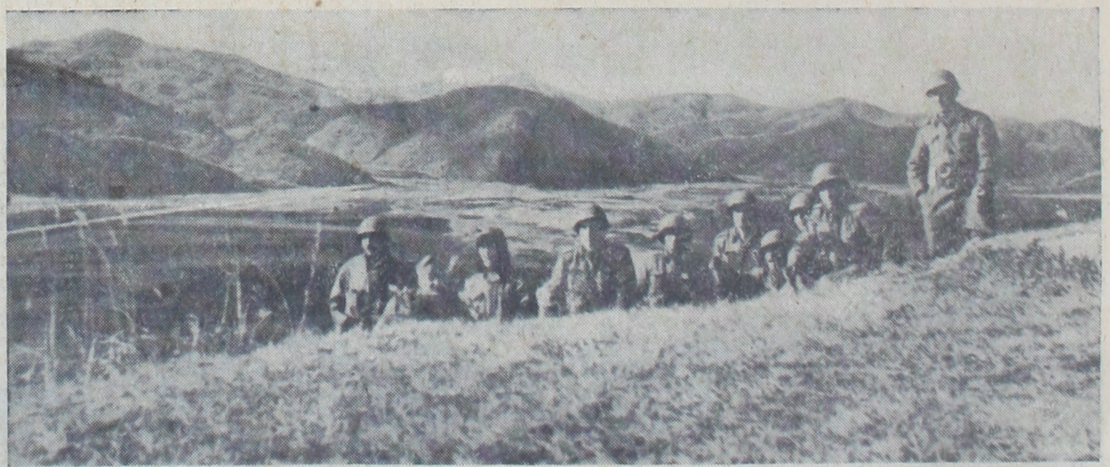
İleri hatlarda bulunan bir müfrezemiz tetikte