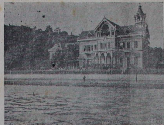
طرایه ده المانیای سفارتخانه سی

دونی کون ساعت سکر یقنده غلطمه برکل بقور اطرافه صالدرمقده اولدینی کورولسلیله مامورین ضابطه طرفدن حیاً طوبیلوب لاجل المایه داوا اکلک عملیایخانه سنه کورلدشدر .