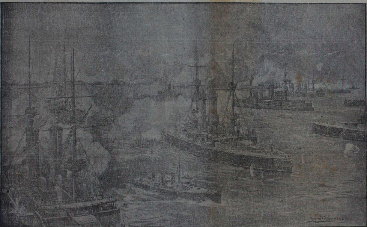
متمقین دو غنای طرقتن چیشدہ کان ناقو استحکاماتک طوبہ طو تلمسی

شرائط اشترا درسعادت ایچون : سنہ کی ۱۸۰ غروش تعیم مطبوعات مقصدیہ ولایات شاهانہ ایچون سنہ کی ۱۲۰ غروش اتقائتی ۶۵ اوچانی ۴۵ اتحاد پوستی اولی اولان مالک : سنہ کی ۴۰ غروش اتقائتی ۲۰ ارج ایچی ۱۰ اولیہ ہرئی ابتدائی وہ اون شندن اعتباراً قید اولور بدلی پیشین کومیلیدر