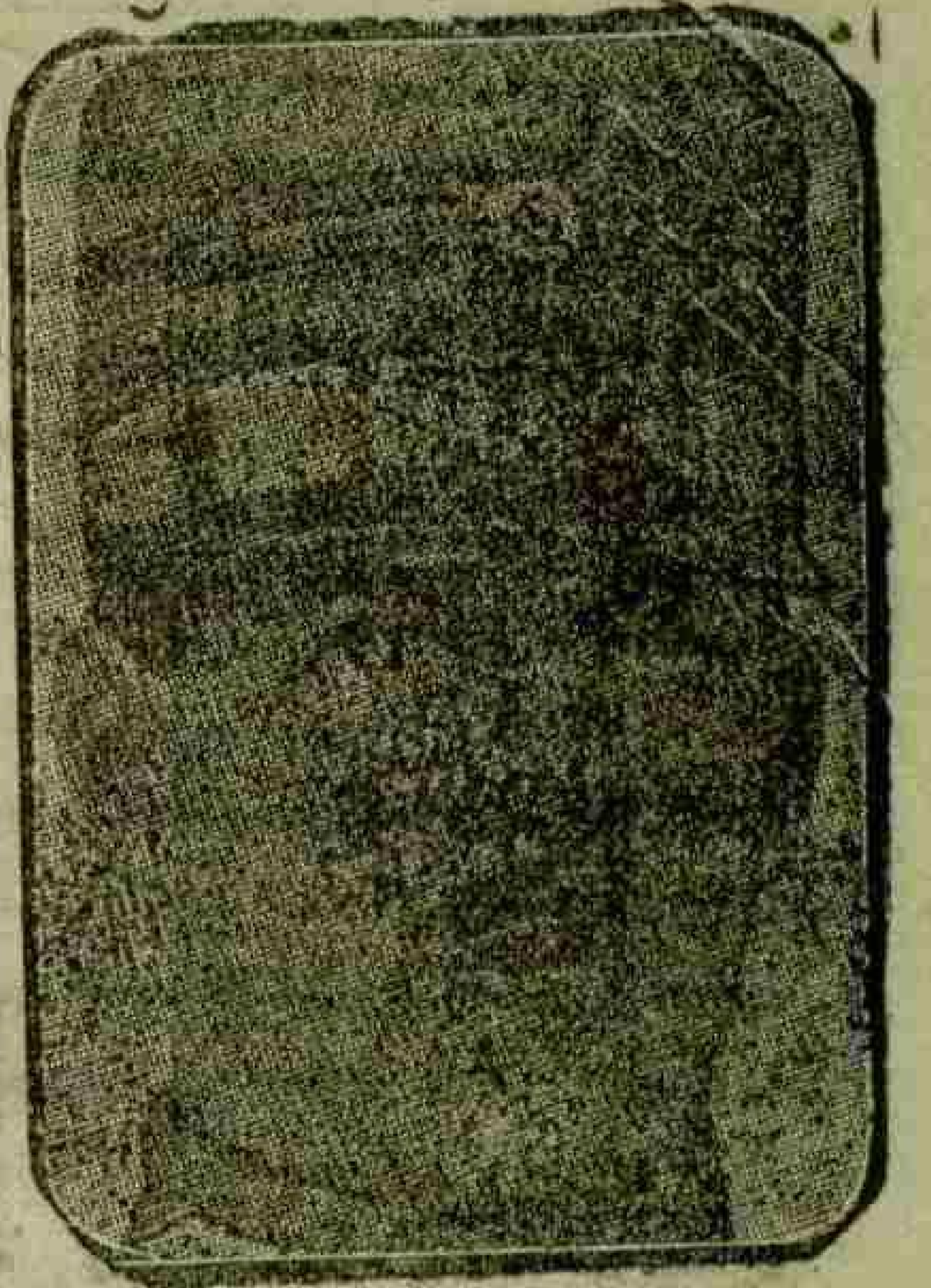
یارسدن از میله متوجاً حرکت ایدن یونان قرالی آلکساندر

پش کوندن بری آناتولیده کی یونان تعرضی حقیقه یونان قرار کاهنک محافظه ایلمکنده بولوندی، مگون معیندار حالا درام ایدوب کیمکنده در. بویصاح انتشار ایدن روجه غزته لده نه ایکی، نه ده یکی هیچ برتبلیغ رسمی بوقدر. حرکت