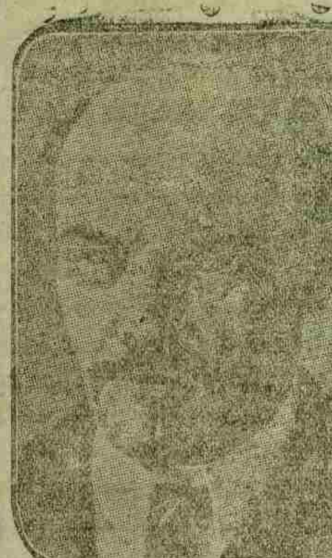
پوتون اخراجی مراقبه آلتنه بولنلر

پارس، ۱ (ب) - (بونی یازیلن) سینفورس (دن آیدیلکی معلوماتی)